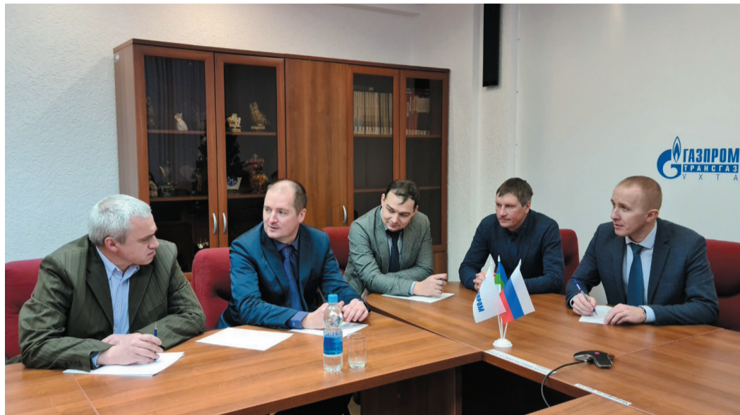
Команда Вуктыльского ЛПУМГ «Утомлённые газом» готовится к ответу на вопрос турнира

3 место – команда «Горящие нейроны» (Ин-