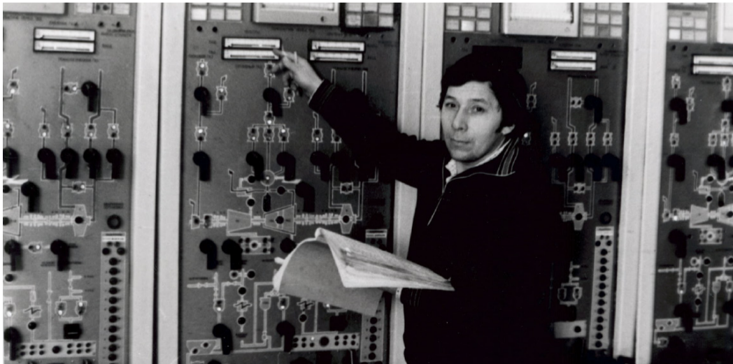
Главный щит управления газоперекачивающими агрегатами ГТК-10-4 операторной цеха № 4 Вуктыльского ЛПУМГ до сих пор в строю (фото сделано в 1982 году)

Оборудование меняется, вследствие модернизации внешний вид щитов управления изменился – отсутствуют ключи управления, самопишущие приборы, фиксирующие параметры работы диаграммы на бумажных носителях заменены на электронные, данные, с которых хранятся в базе данных на сервере. Автоматика модернизирована, и все основные параметры работы газоперекачивающих агрегатов выводятся на мониторы компьютеров АРМ оператора (автоматизированное рабочее место). Тем не менее пуск, регулирование режимов работы и останов газоперекачивающих агрегатов выполняется с этих щитов.