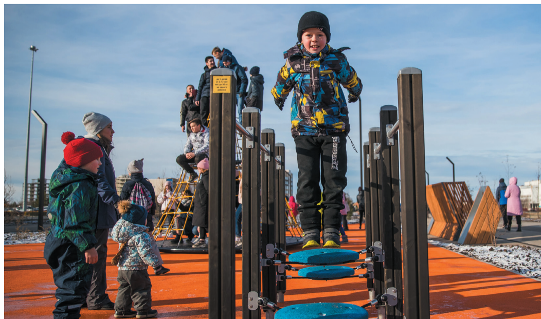
По инициативе ООО «Газпром трансгаз Ухта» в рамках корпоративной программы благотворительности в Ухте появилось благоустроенное пространство по набережной Газовиков протяжённостью более двух километров