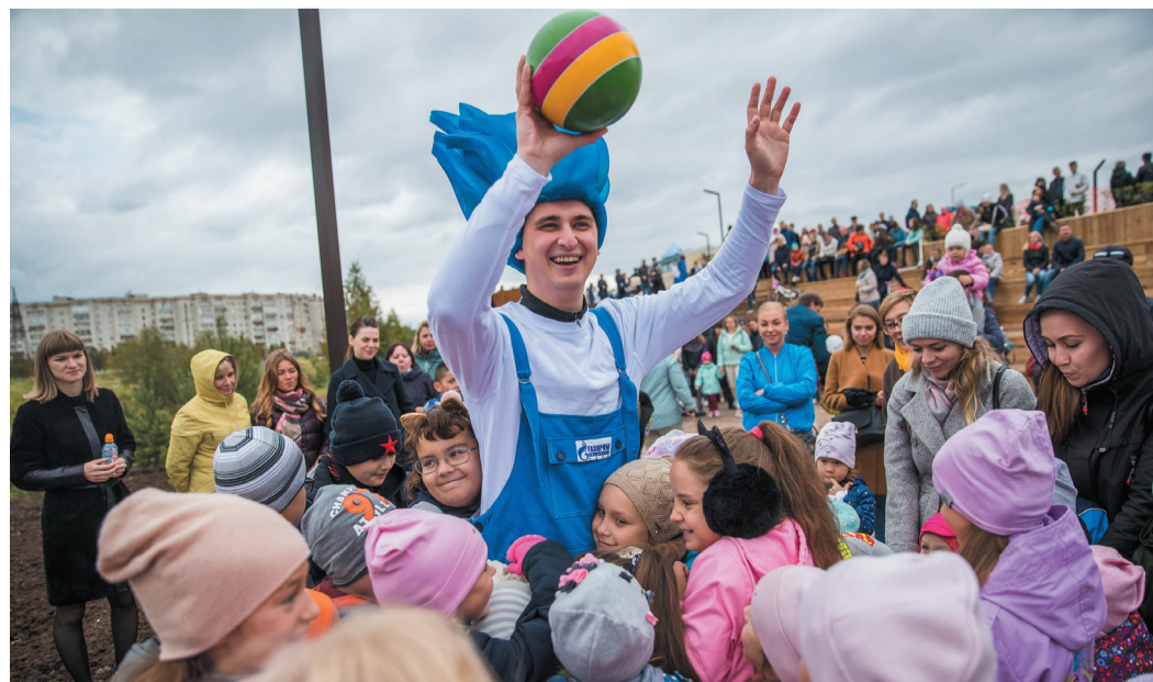
Один из главных героев профориентационных проектов предприятия – Северок, с ним регулярно встречаются дети во всех регионах производственной деятельности