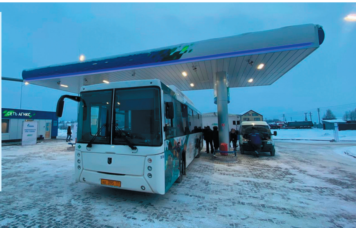
13 декабря в столице Республики Коми г. Сыктывкаре открылась вторая газозаправочная станция

АДРЕС, МЕСТОПОЛОЖЕНИЕ, РЕЖИМ РАБОТЫ, ЦЕНА – УДОБНЫЙ ПОИСК ПО РЕГИОНАМ.