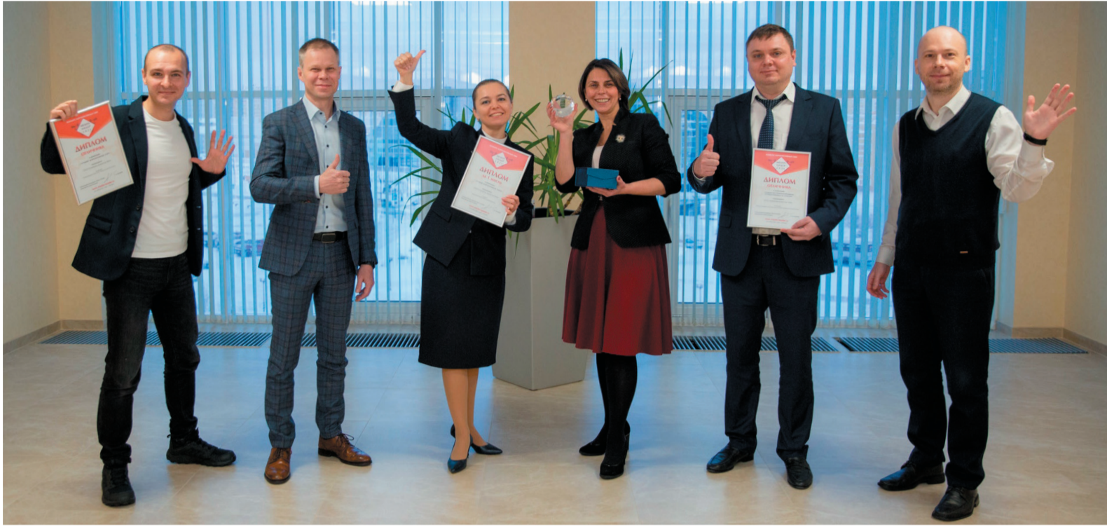
Команда корпоративной газеты «Севергазпром» с наградами конкурса «Медиалидер – 2021»

Уважаемые коллеги! Дорогие друзья! Подшёл к завершению ещё один год в истории нашего предприятия. Год, насыщенный производственными событиями, яркими мероприятиями, новыми успехами и победами. Он стал юбилейным для корпоративного издания, газете «Севергазпром» исполнилось 30 лет.