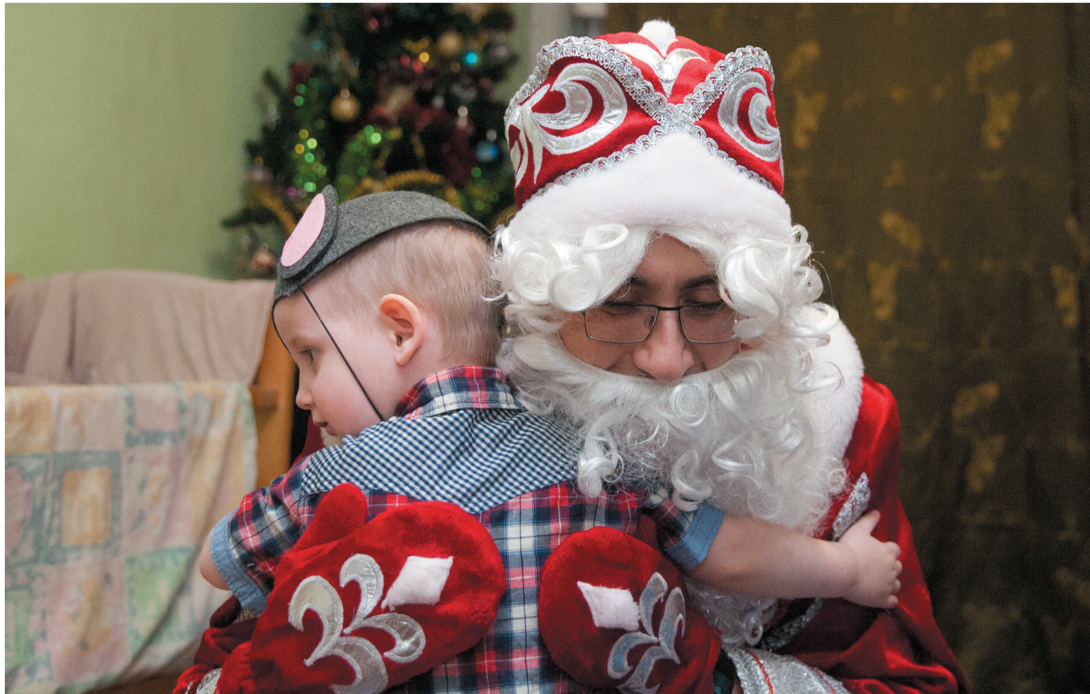
В преддверие Нового года Дед Мороз со Снегурочкой развозят подарки детям

– Они все забирают частичку души, каждое пропускаешь через себя, чтобы оно было не проходным, а с изюминкой. Мне ни за