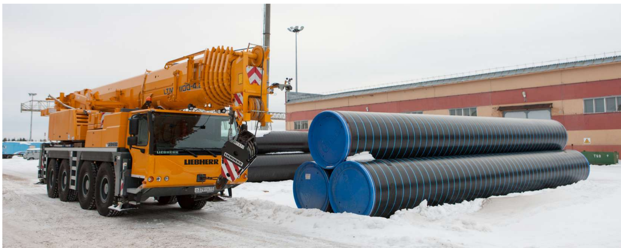
Площадка погрузки-выгрузки труб большого диаметра участка по хранению и реализации материально-технических ресурсов в г. Ухте