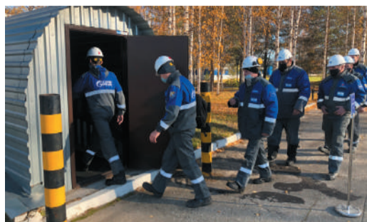
АКТУАЛЬНО Чрезвычайно ответственно стр. 2