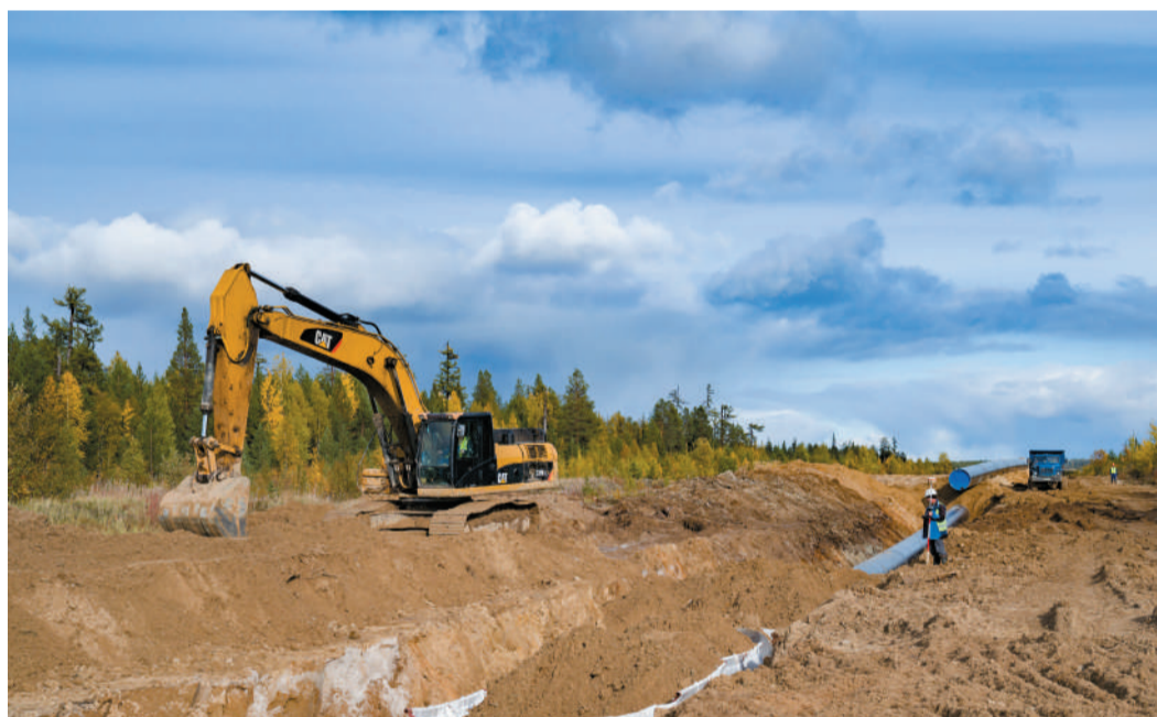
Балластировка участка нового газопровода с применением устройств из нетканых синтетических материалов