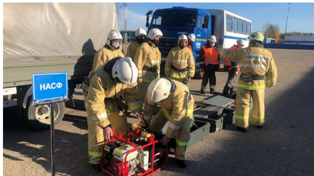
Смотр готовности нештатного аварийно-спасательного формирования Сосногорского ЛПУМГ

Основные усилия были сосредоточены на обеспечении управления и координации действий силами и средствами системы гражданской защиты предприятия, организации эвакуации работников, проведении аварийно-спасательных и других неотложных работ, повышении устойчивого функционирования объектов предприятия.