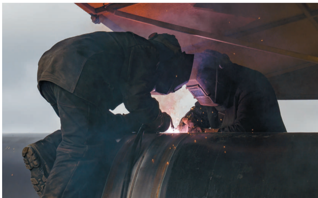
Сварка труб в секцию