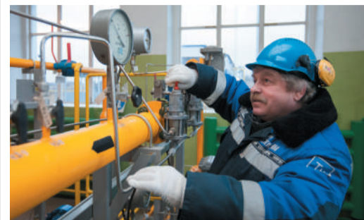
ВЕЧНЫЕ ЦЕННОСТИ Станционный смотритель стр. 7