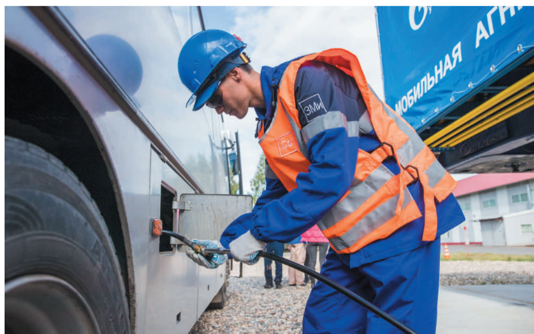
Наше предприятие – один из лидеров в регионах своей производственной деятельности по реализации федеральной программы перехода автотранспорта на экономичное и экологичное газомоторное топливо