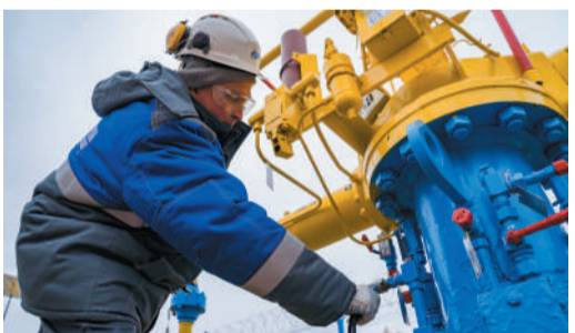
Правлению поручено продолжить работу по газификации сельских территорий

С начала 2021 года «Газпром» уже обеспечил условия для газификации 167 сельских населённых пунктов – больше, чем за весь 2020 год. Доступ к сетевому газу здесь открыт для более чем 43 тыс. домовладений и квартир, 105 котельных.