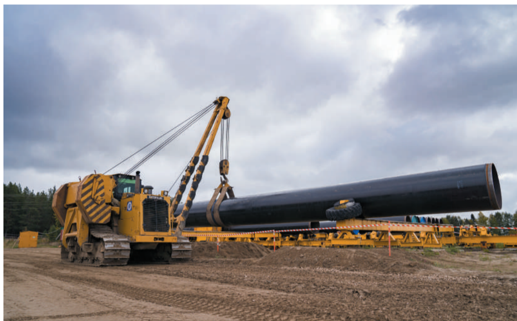
Трубоварочная база, кран перемещает трубу

На северо-западе страны, в районе п. Усть-Луга, в мае начато сооружение Комплекса по переработке этансодержащего газа. Здесь, в частности, будут выпускаться значительные объёмы этана, востребованного для производства полимеров, а также сжиженный природный газ.