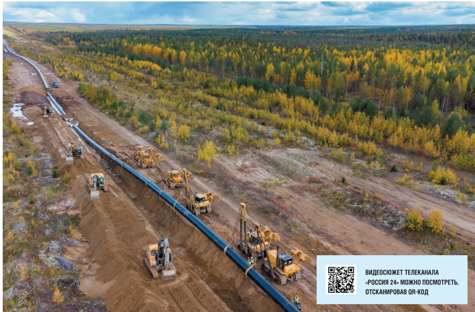
Ремонт магистрального газопровода «Пунга-Ухта-Грязовец III» методом сплошной замены труб