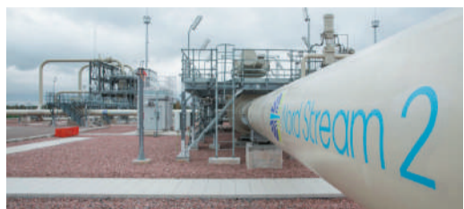
Объекты на участке берегового пересечения в России в сентябре 2021 года

В середине октября процедура по заполнению газом первой нитки газопровода «Северный поток – 2» была завершена. Нитка наполнена так называемым техническим газом в объёме приблизительно 177 млн м 3 , что обеспечивает уровень давления 103 бар в газопроводе. Давления достаточно, чтобы в дальнейшем начать транспортировку газа. Пусконаладочные работы на второй нитке продолжаются.