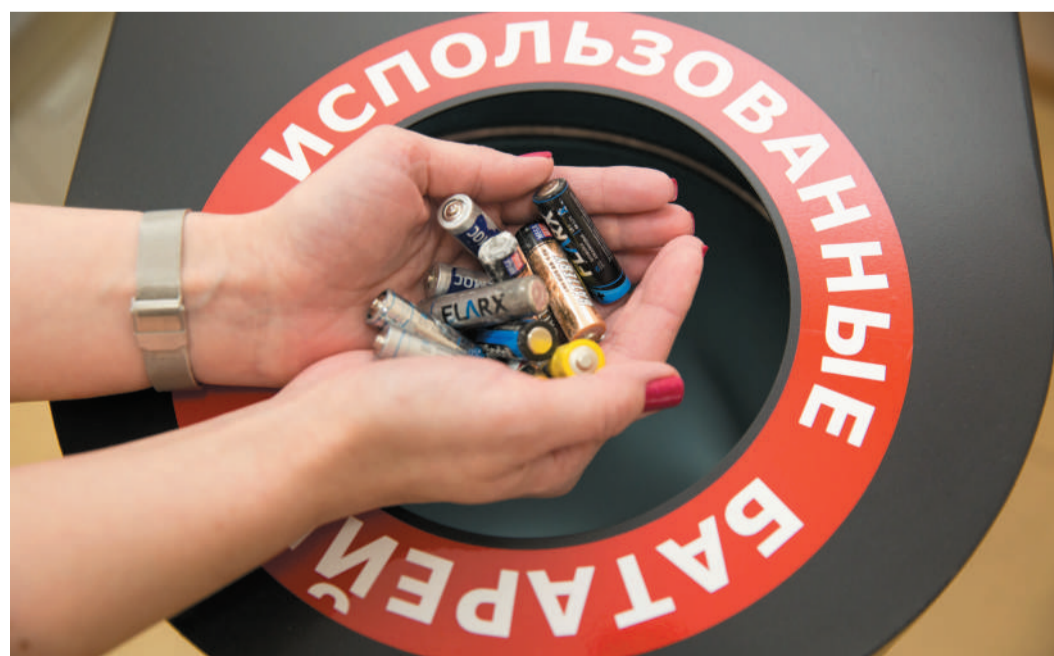
В ООО «Газпром трансгаз Ухта» в целях снижения негативного воздействия на окружающую среду организованы отдельный сбор мусора и отправка его на переработку