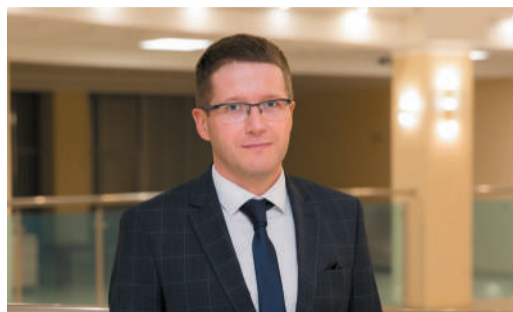
ГОСТЬ НОМЕРА «Каждый должен осознавать ключевую миссию предприятия» стр. 3