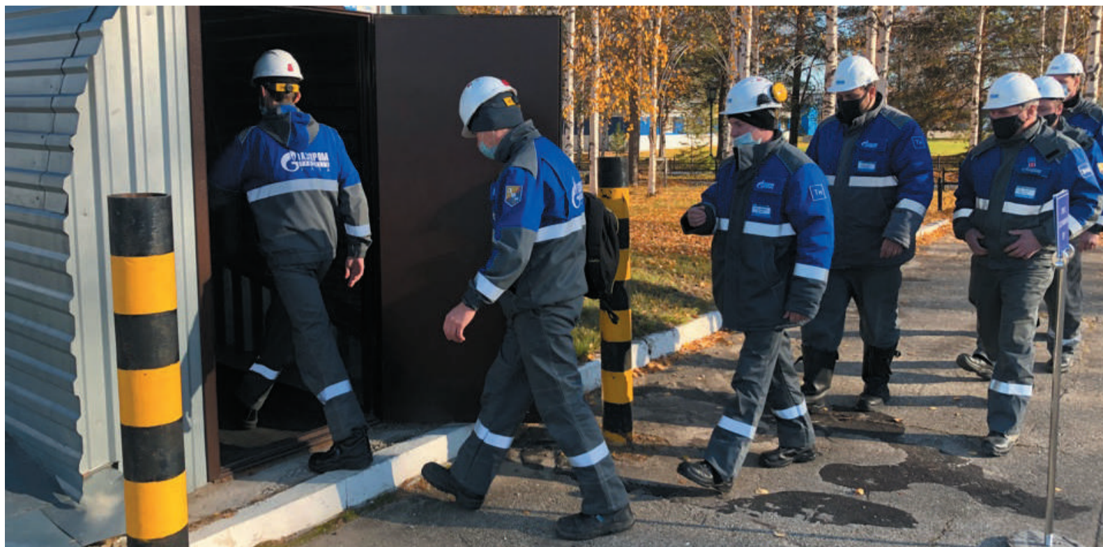
На предприятии более 30 сооружений гражданской обороны для защиты работников от вредных факторов при разрушении объектов и химическом воздействии

Несмотря на то что мы живём в мирное время, угрозы военных конфликтов не перестали существовать, а чрезвычайные ситуации разных масштабов, от ДТП до взрывов на опасных объектах, ни на один день не исчезают из общероссийской повестки дня. Поэтому, как говорится, надеяться на лучшее, а готовиться к худшему. Сотрудники нашего предприятия шестого октября успешно провели штабную тренировку по гражданской обороне и отработали навыки действий в чрезвычайных ситуациях.