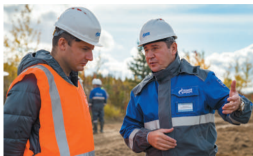
ФОТОРЕПОРТАЖ Надёжность каждого метра трубы – главная задача стр. 4-5