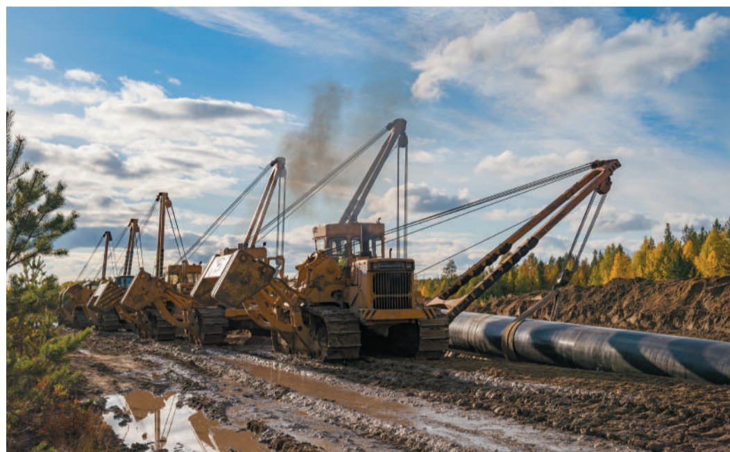
Укладка трубной плиты в траншею