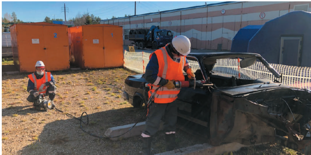
Проведение спасательных работ в условиях дорожно-транспортного происшествия в Управлении аварийно-восстановительных работ

В ходе тренировки отработывались следующие задачи: