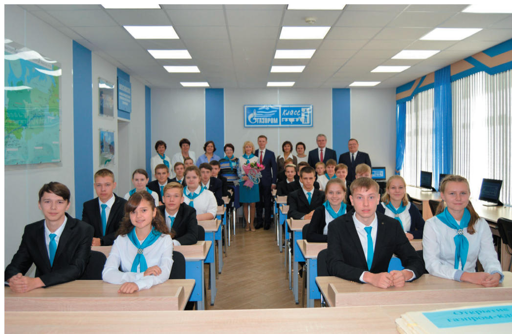
Ученики «Газпром-класса» Ухтинского технического лицея имени Г. В. Рассохина