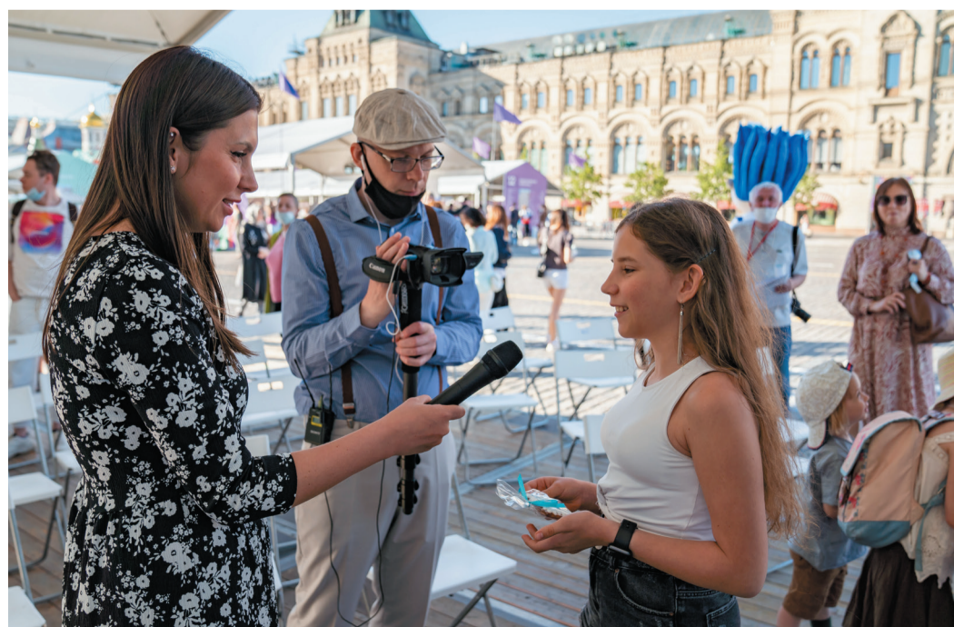
Юные гости фестиваля активно делились впечатлениями о проекте