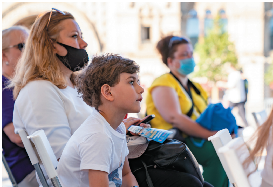
Во время просмотра мультфильма юные посетители получили знания о правилах пользования бытовым газом и его транспорте