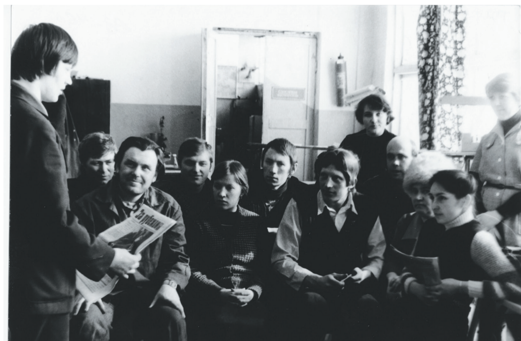
Проведение политинформации на предприятии