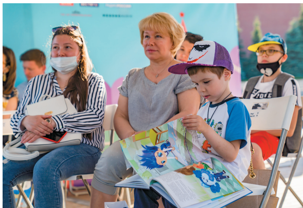
Герои книги вызвали у юных читателей неподдельный интерес