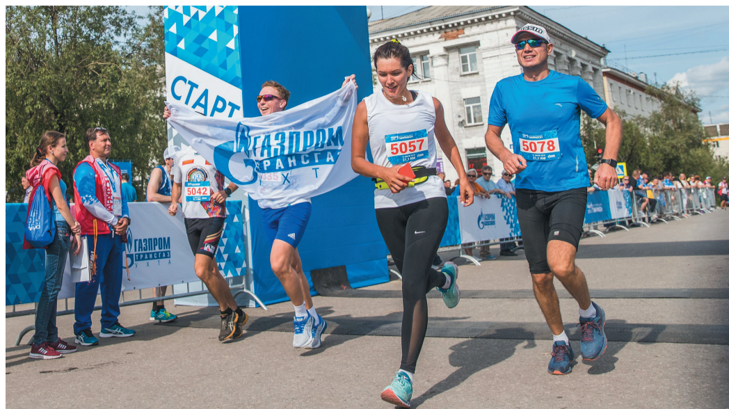
Участники «Арктического марафона – 2019»

Любители бега и профессионалы в лёгкой атлетике дождались старта регистрации на уникальное спортивное событие – «Арктический марафон – 2021»! Мероприятие пройдёт 14 августа в Воркуте. Уже в третий раз его организуют наше предприятие, ОППО «Газпром трансгаз Ухта профсоюз», администрация МОГО «Воркута» и ООО «Мир бега» (RUSSIA RUNNING).