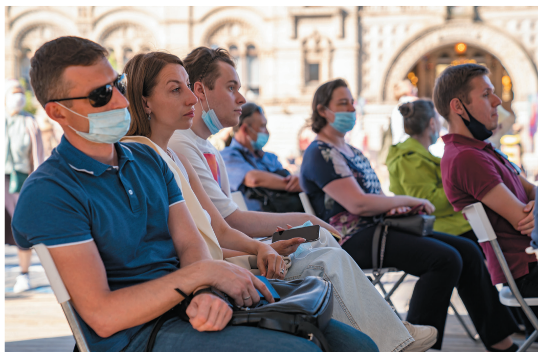
Презентацию проекта с интересом смотрели не только дети, но и взрослые