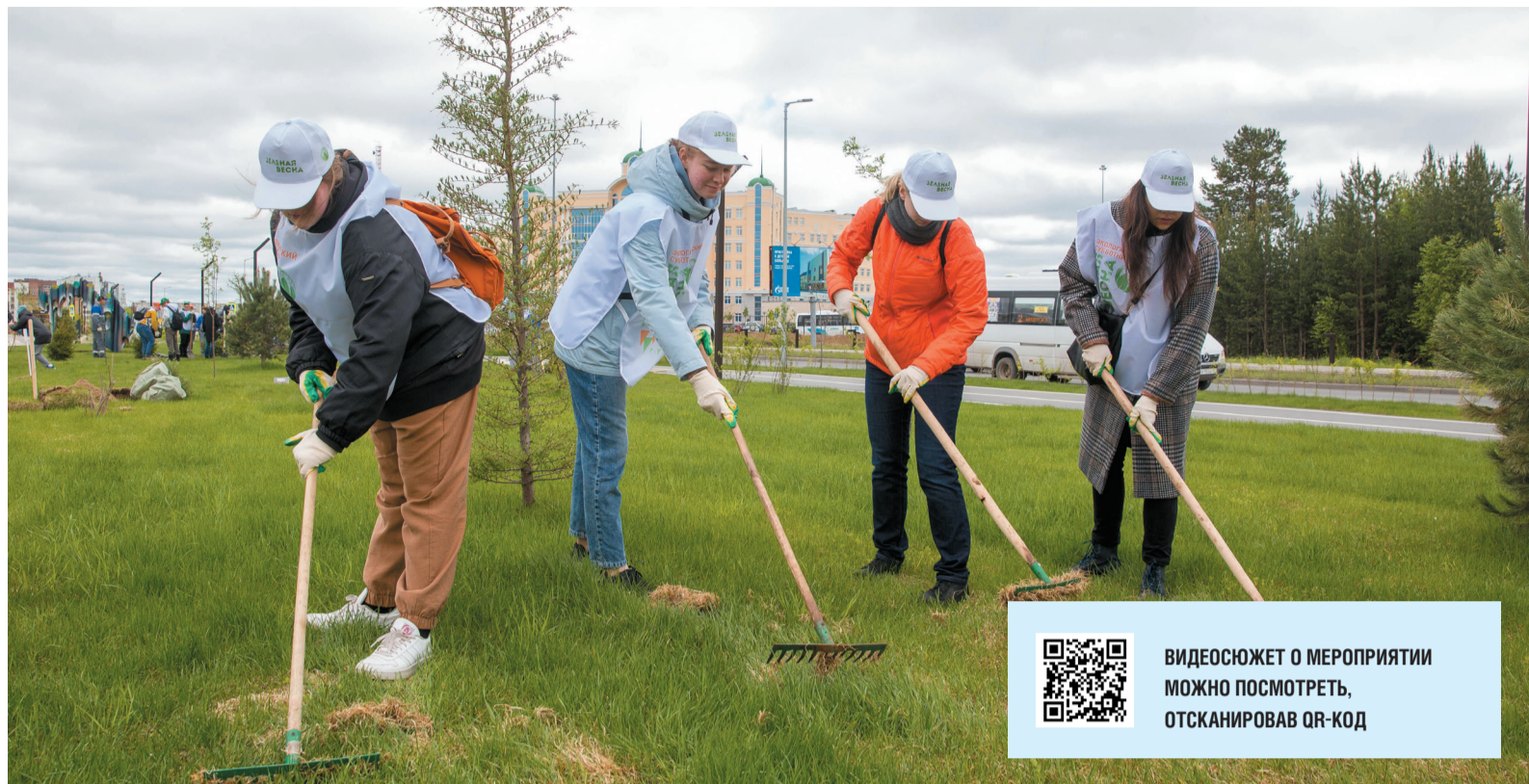
Учащиеся «Газпром-класса» Ухтинского технического лицея впервые приняли участие в акции

5 июня – Всемирный день окружающей среды и День эколога. Сохранение благоприятной окружающей среды – приоритет в деятельности «Газпрома» и в том числе нашего предпри-