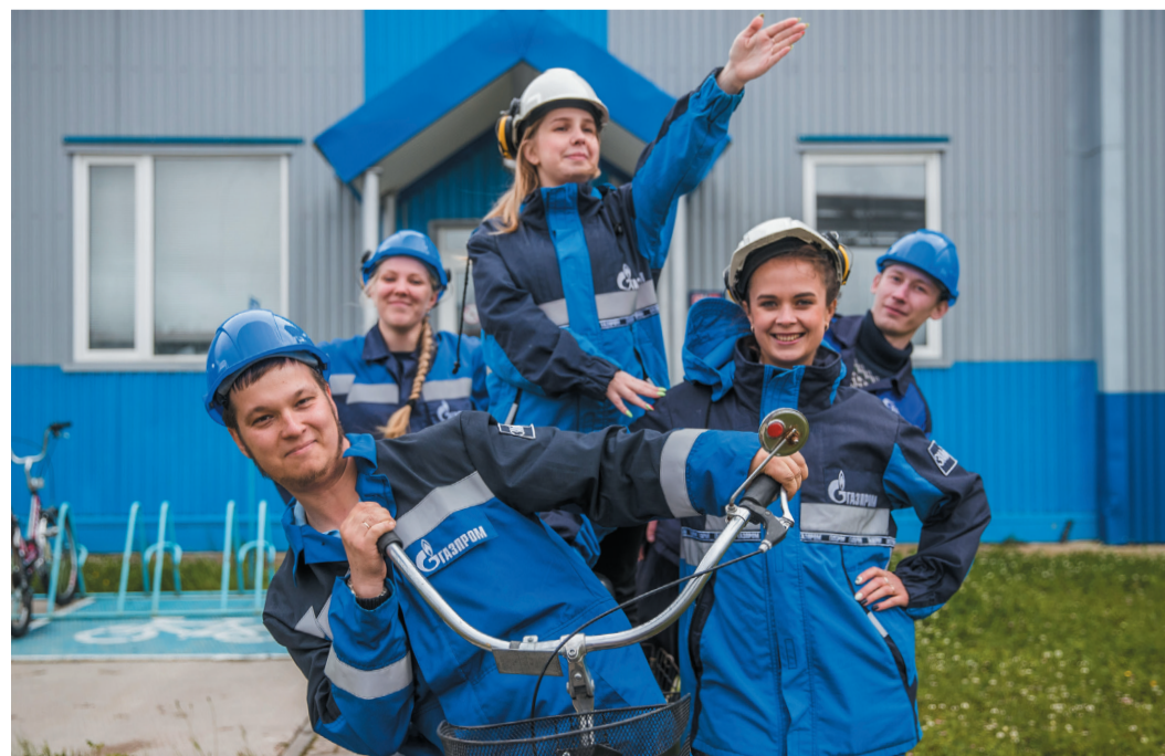
Молодые работники Синдорского ЛПУМГ