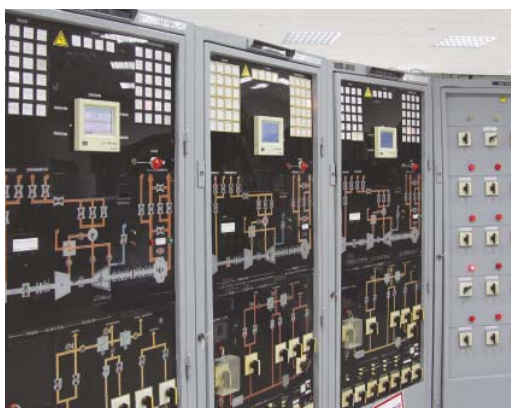
Безбумажные регистраторы параметров ГТК-10-4.

устройств, выработавших свой ресурс. В 2014 году экспертизу прошли четыре газотурбинные установки и три центробежных нагнетателя.