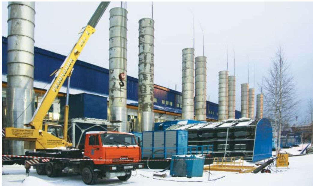
Работы по замене КВОУ ГПА-35

Большой объем работ был проделан и в КЦ № 4. Для диагностики подключающих шлейфов использовали «точечную» шурфовку. На двух из четырех вскрытых участков трубопровода, а также на одном сварном соединении выявлены дефекты, резко снижающие уровень надежности газопровода и недопустимые к дальнейшей эксплуатации. В результате было принято решение о проведении ремонта сварочного соединения и замене дефектного участка. В летний период была произведена замена подземного крана, установленного на узле подключения, и осуществлен демонтаж четырех неработоспособных электроприводных задвижек в подземных колодцах на линиях рециркуляции цеха № 4. Они были негерметичны и имели протечки газа по корпусным соединениям, что представляло потенциальную опасность для обслуживающего персонала цеха. Работы были сложными, так как в колодцах было проложено большое количество различных коммуникаций. Была проведена немалая работа по обследованию технических