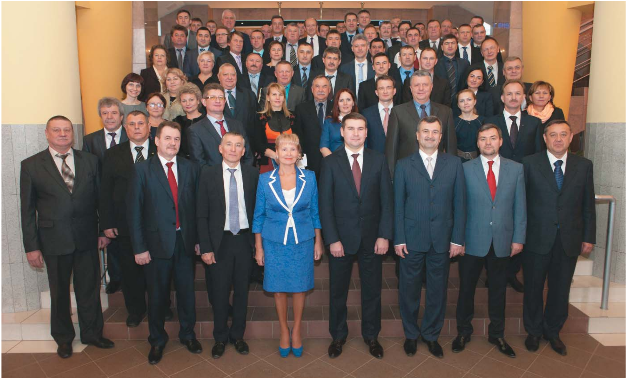
Участники Совета руководителей