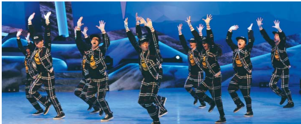
Ансамбль «Юнайтед Бит»