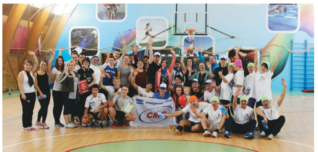
Веселые старты «Бегом от сигарет» прошли в Приводино