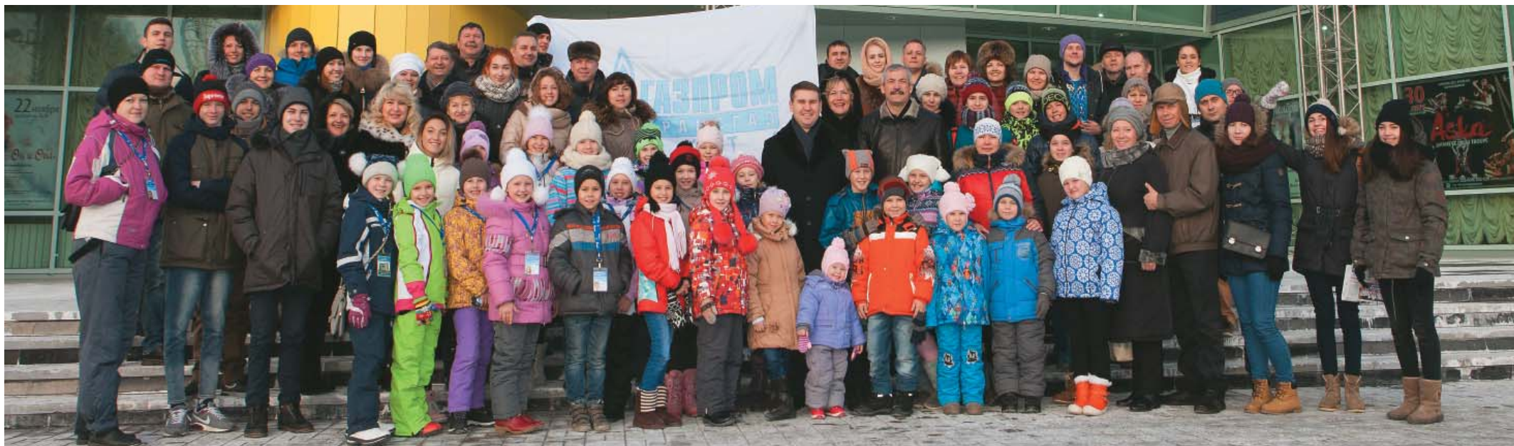
Творческая команда ООО «Газпром трансгаз Ухта»

Наш корреспондент