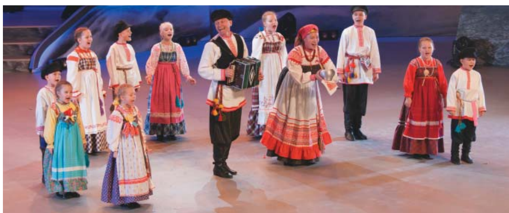
Фольклорный ансамбль «Боркунцы»

С 8 по 15 ноября 2014 года распахнул свои ворота современный, креативный, спортивный и на целую неделю фестиваль, северный город Ханты-Мансийск. Город шахмат и биатлона принимал людей искусства – участников зонального тура корпоративного фестиваля «Факел». В числе участников была и творческая делегация ООО «Газпром трансгаз Ухта».