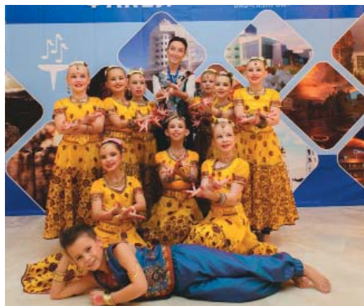
Ансамбль индийского танца «Лакшми»