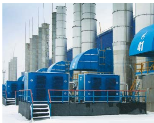
АВО масла на КЦ-4.

Важное место в работе ЛПУ отводится модернизации оборудования, что положительно влияет на производительность техники, способствует безопасности работы и облегчает обслуживание узлов и агрегатов.