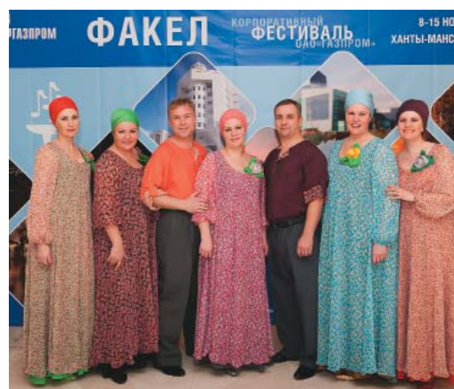
Вокальный ансамбль «Камертон»