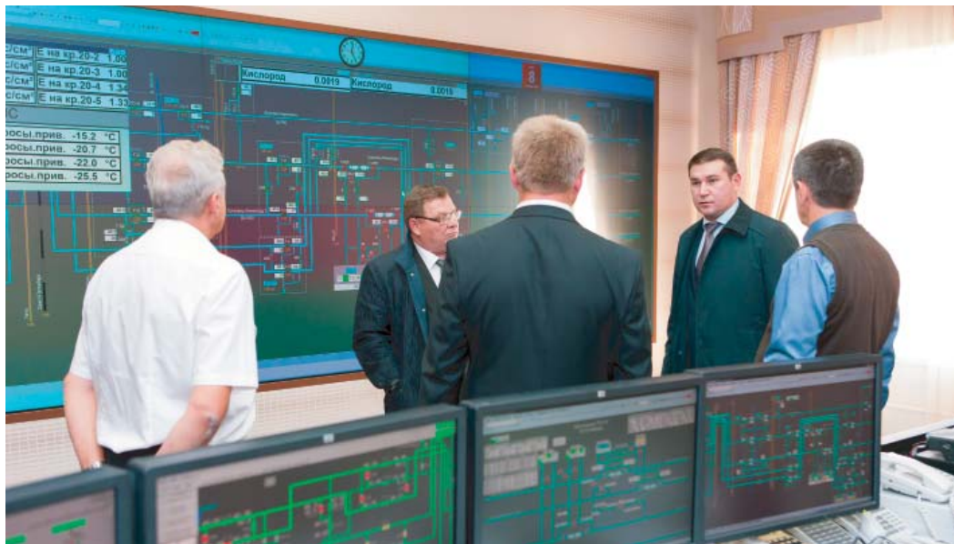
В ПДС Шекснинского ЛПУМГ