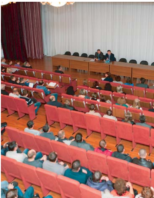
Встреча с коллективом Мышкинского ЛПУМГ