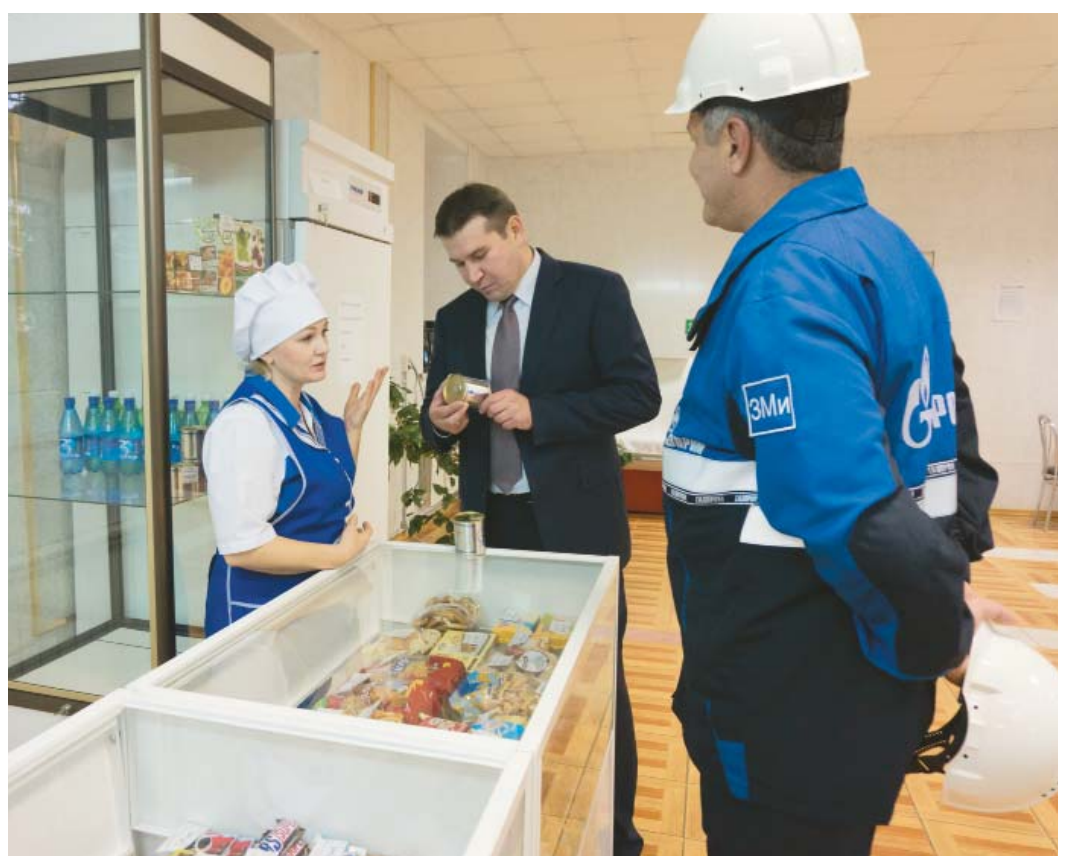
КС-31 Данилов. Социальная сфера под особым контролем