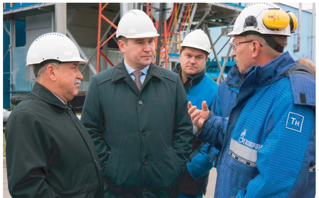
КС-17 Грязовец. «Разговор с персоналом»