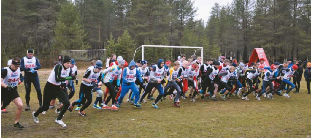
На старте легкоатлетического кросса