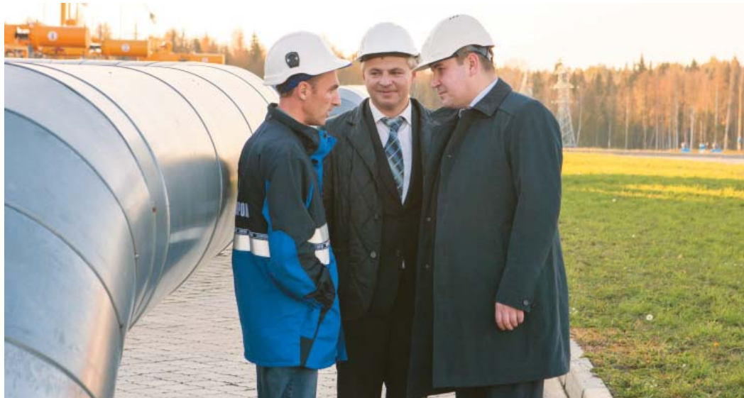
В Шекснинском ЛПУМГ