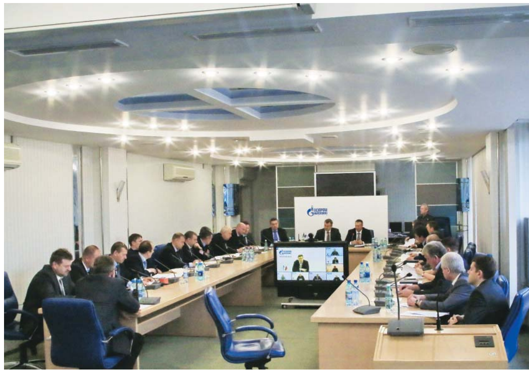
Заседание штаба учений.