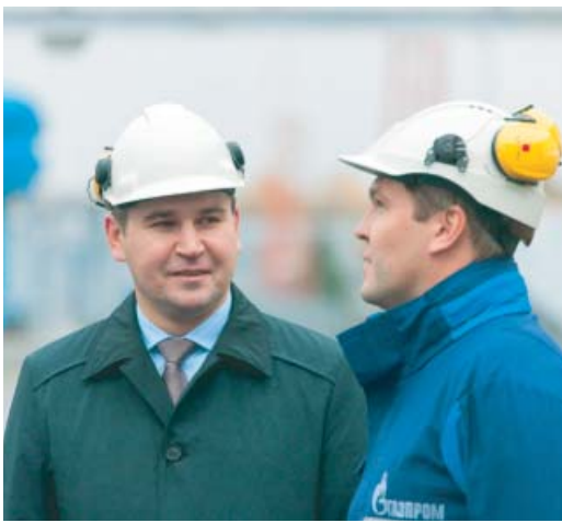
КС-18 Мышкин. «Разговор по душам»