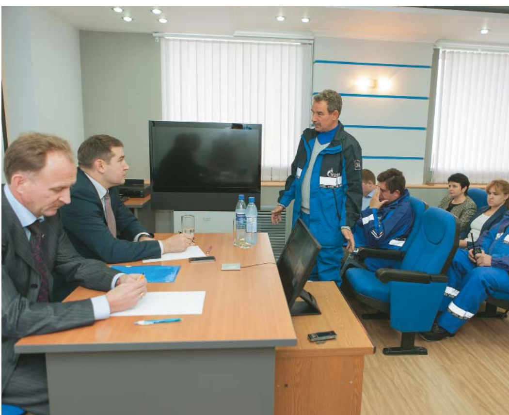
КС-33 Переславль. Встреча с коллективом