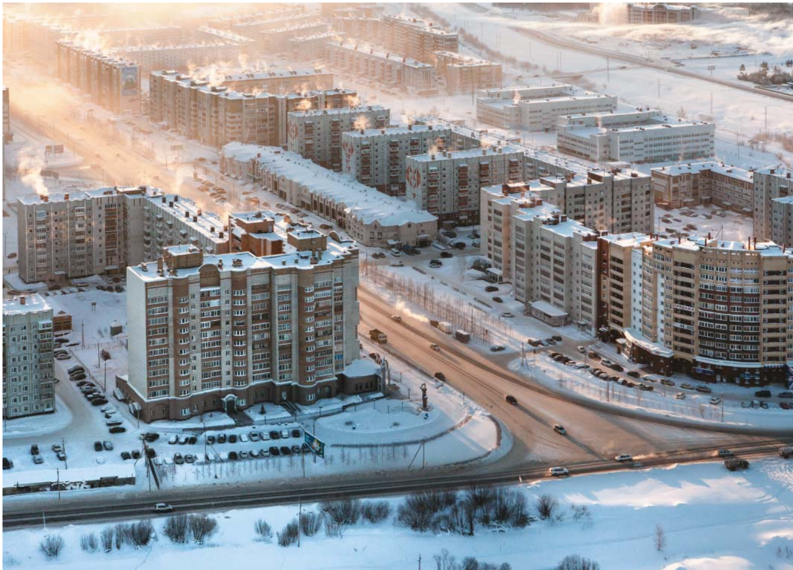
Ухта. Предзимье.