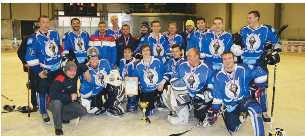
Хоккейная команда «УАВР»