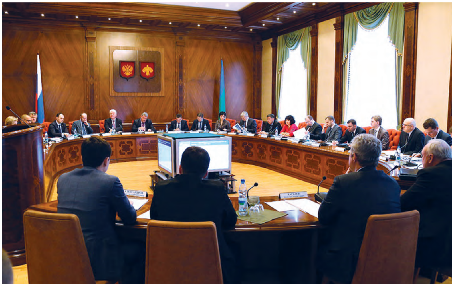
Совещание по вопросам развития газификации Республики Коми