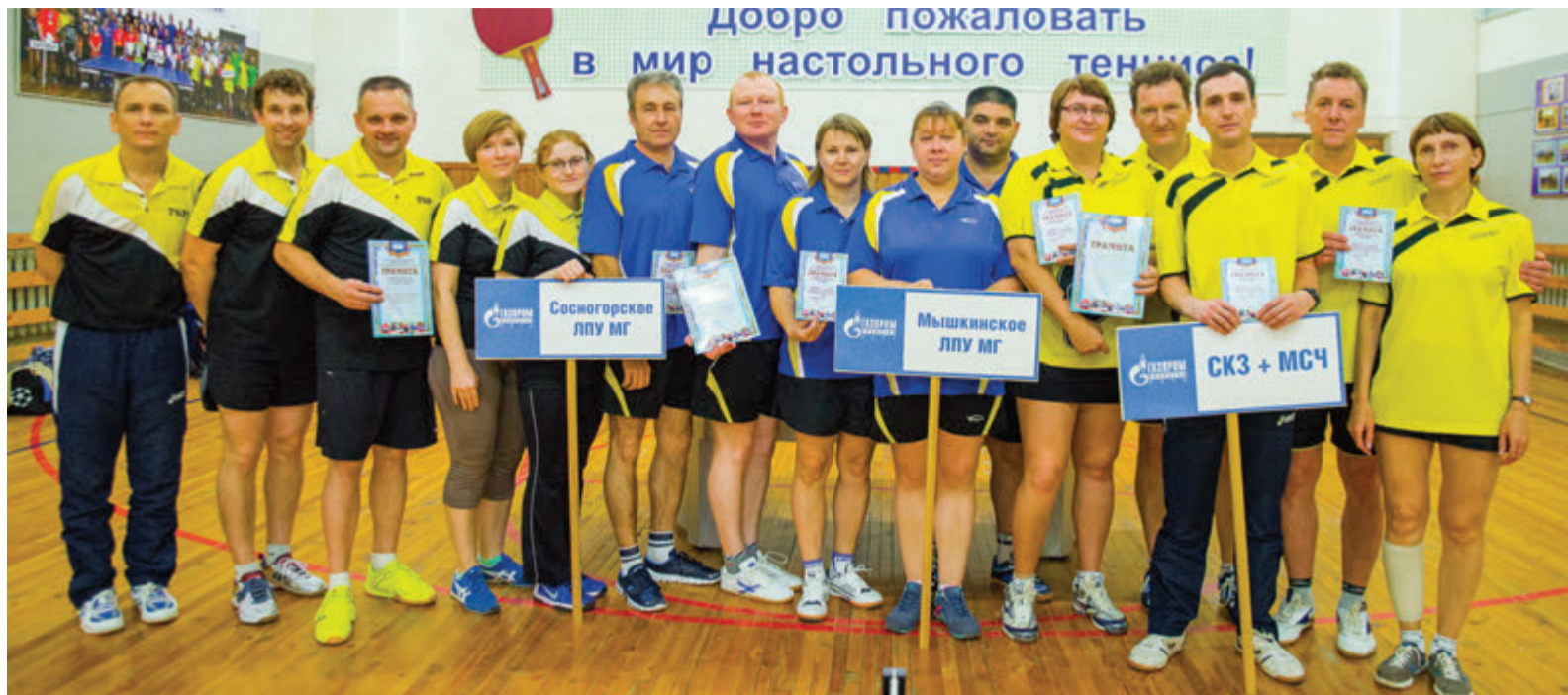
Призёры: 1 место – Мышкинское ЛПУМГ; 2 место – СКЗ+МСЧ; 3 место – Сосногорское ЛПУМГ