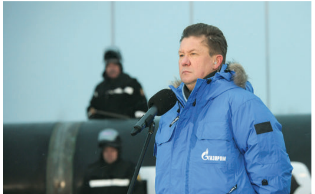
Алексей Миллер на связи с Президентом

Во время мероприятия, посвященного сварке первого стыка, Алексей Миллер рассказал, что в начале прошлого месяца