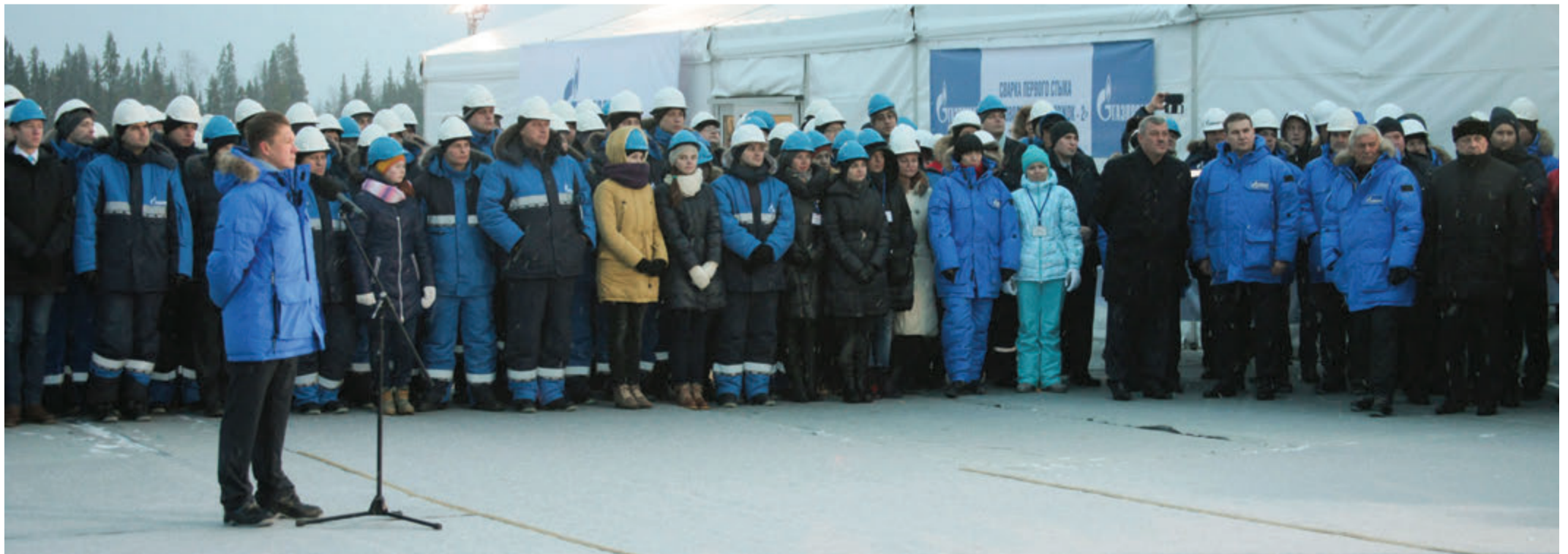
Митинг перед сваркой первого стыка

Соединённые вместе два отрезка трубы будут храниться на память об ещё одном важном шаге по развитию газовой отрасли России.