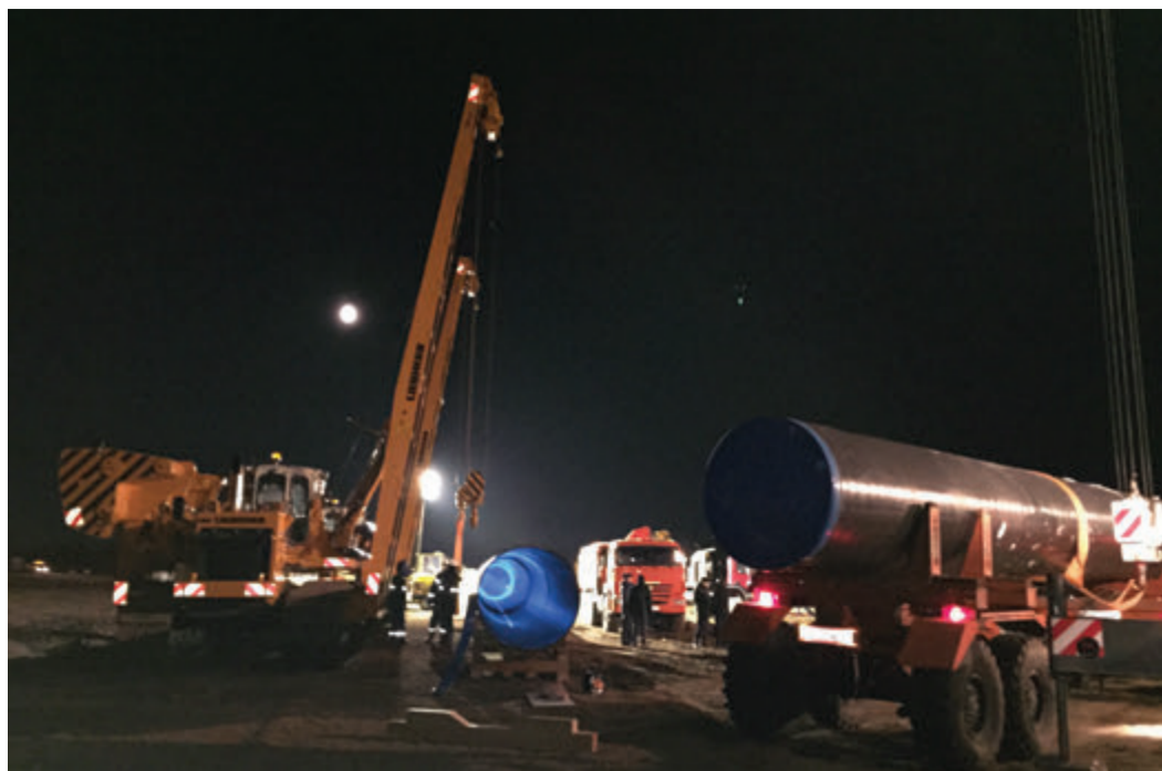
На площадке. Подготовка к сварке первого стыка.