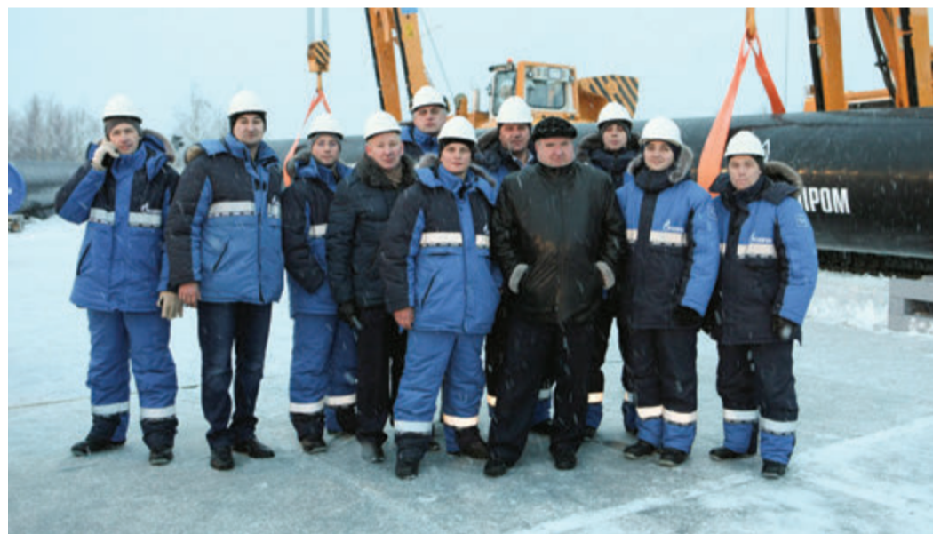
Работники Сосногорского ЛПУМГ