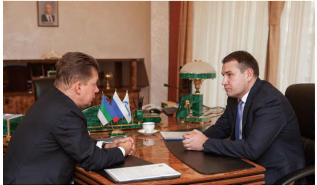
Обсуждение первоочередных задач

Это серьёзный, большой, многовекторный проект, который заслуживает особого внимания и самой компании «Газпром», и Правительства Российской Федерации. Я хочу пожелать успеха в этой работе всем, кто будет осуществлять этот проект.