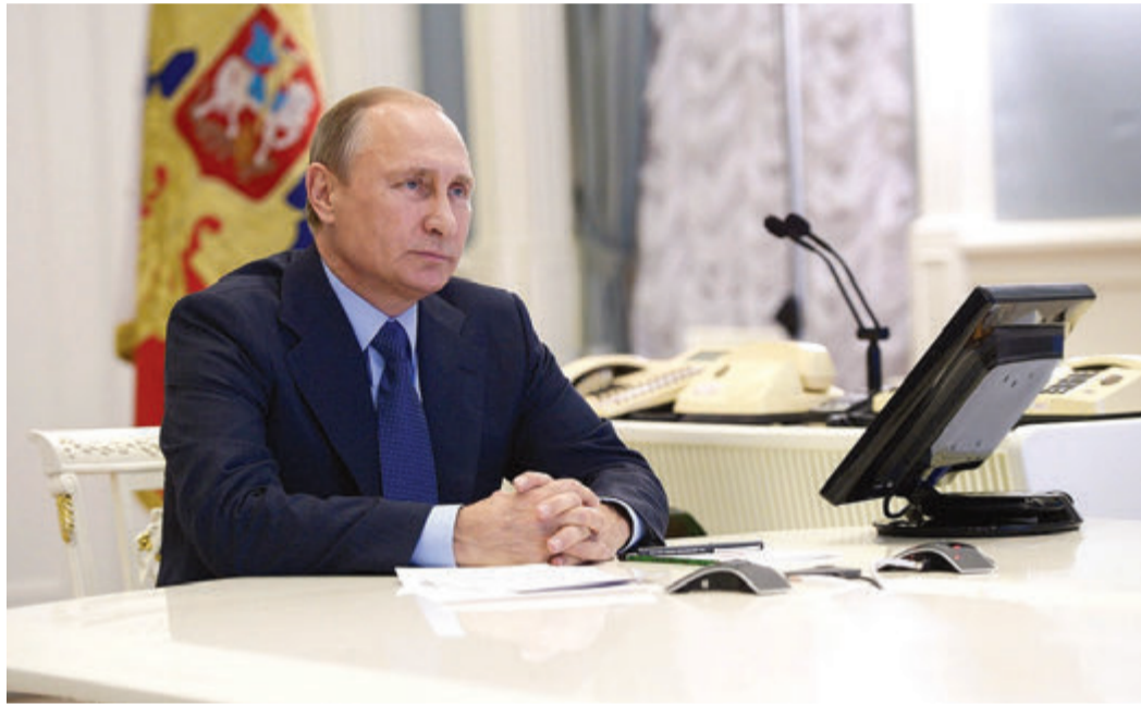
В режиме телемоста к участникам церемонии обратился Президент России