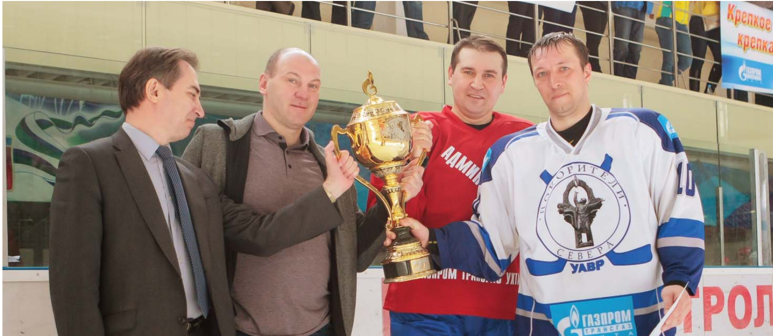
Главный кубок вручен команде УАВР.

интригующий финал, заставивший зрителей задуматься: за кого болеть? Ведь в борьбе за первое место сошлись ухтинские команды администрации Общества и Управления аварийно-восстановительных работ.