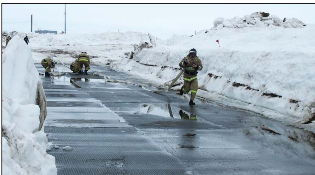
КС-41 «Байдарацкая». Протягивание рукавной линии

ЛПУМГ каждой команде из шести бойцов предстояло преодолеть три этапа. Первое задание – на скорость облачиться в специальную одежду с амуницией. Второе – боевое развертывание: завести мотопомпу, с ее помощью забрать воду, развернуть пожарные рукава, сбить мишень напором воды, эвакуировать пострадавшего и