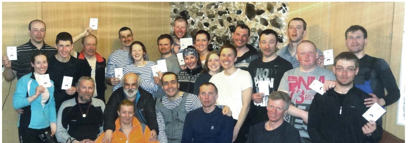
Итог сборов – 21 новый российский альпинист