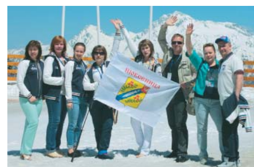
Покорители вершин из Нюксеницы