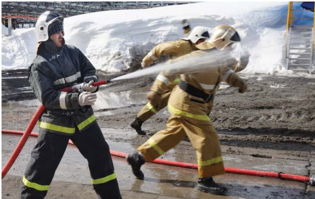
КС-43 «Гагарацкая». Работа ствольщика

В Воркутинском ЛПУМГ прошли традиционные соревнования по боевому развертыванию между командами добровольных пожарных дружин (ДПД). В них приняли участие команды ДПД КС «Байдарацкая», «Ярынская», «Гагарацкая» и «Воркутинская».