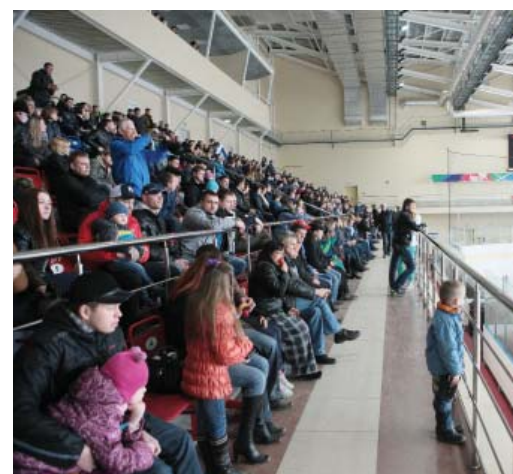
Для зрителей проводили розыгрыши лотерей