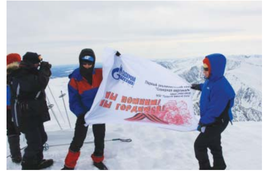
Мы помним, мы гордимся