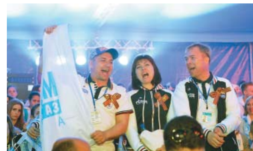
Болеем за наших!