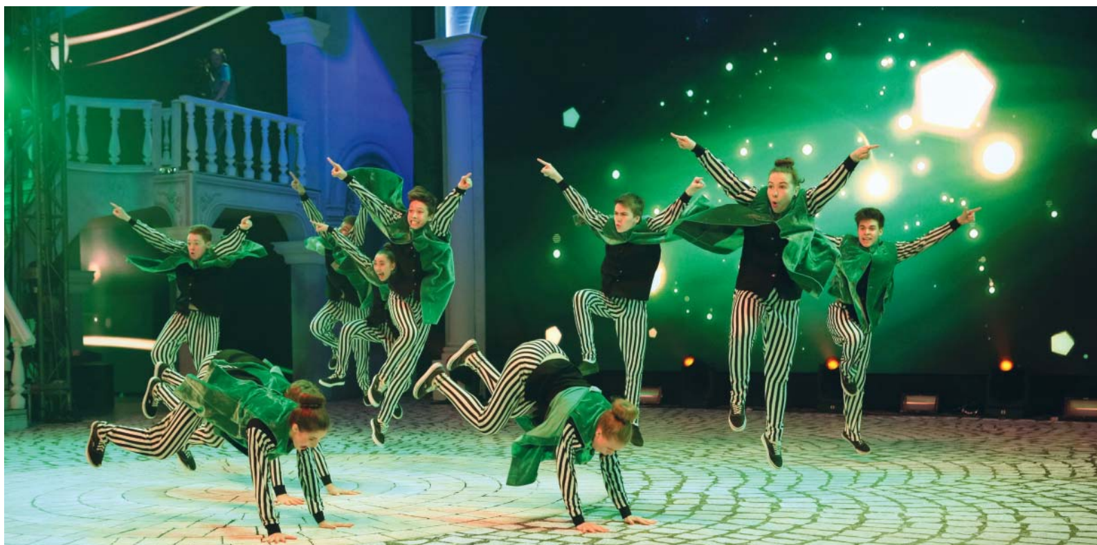
Танцевальная команда «Юнайтед Бит» (УАВР)