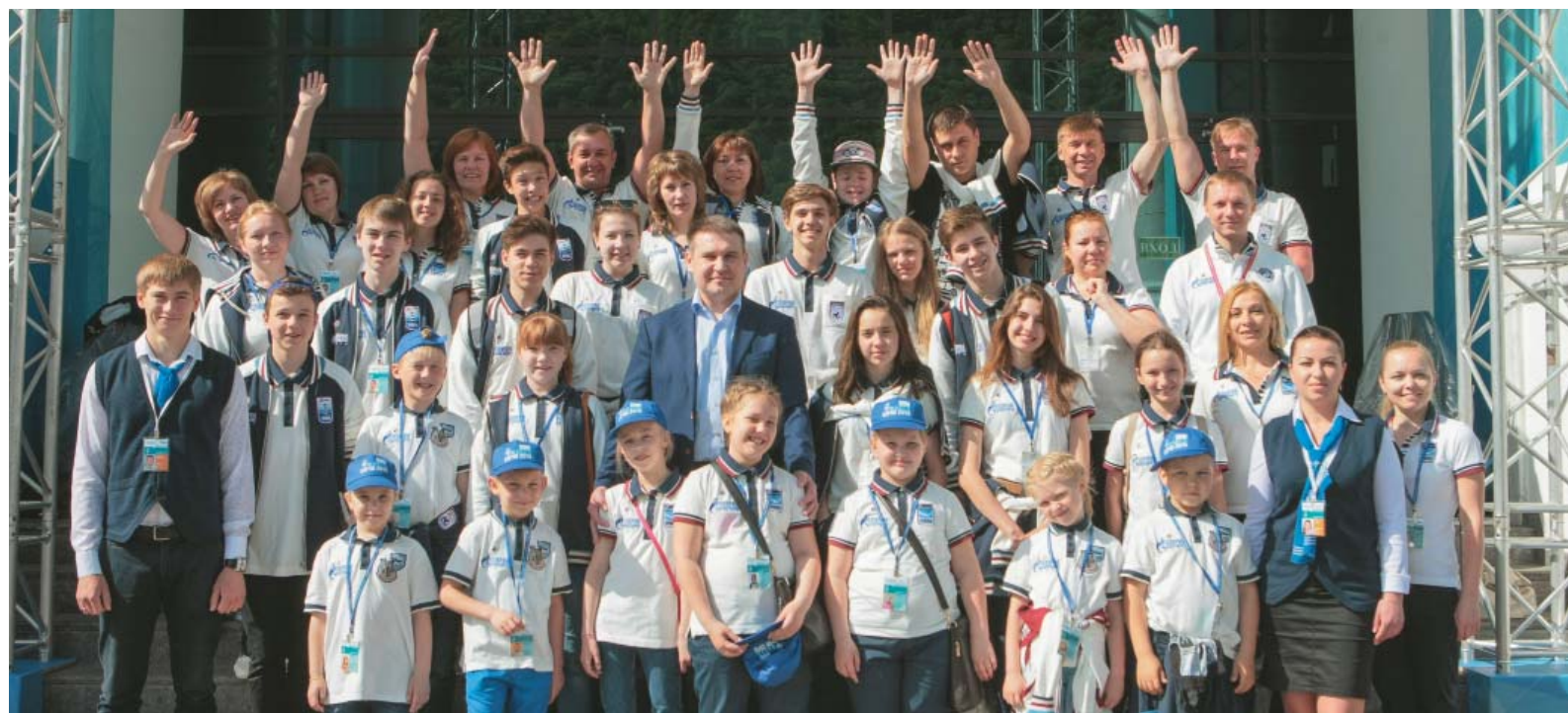
Творческая делегация ООО «Газпром трансгаз Ухта»