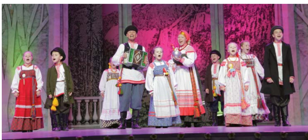
На сцене «Боркунцы»