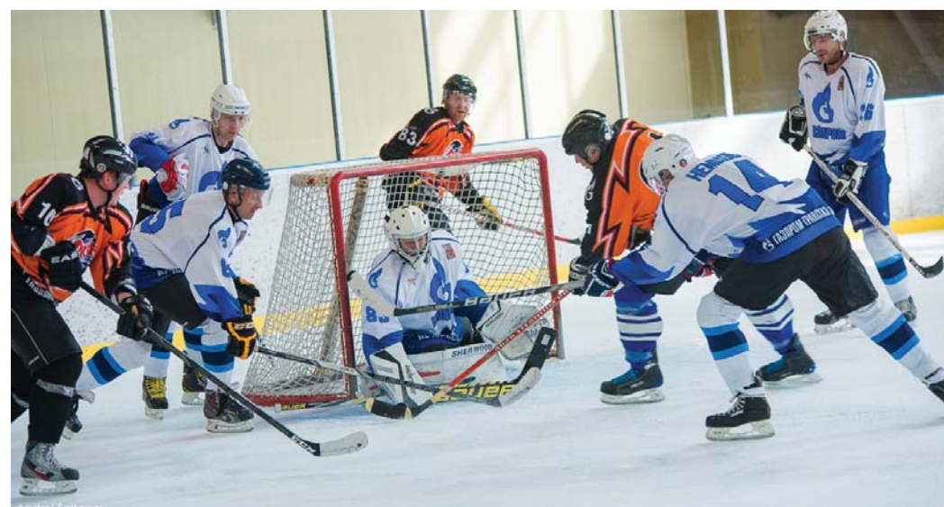
Баталия у ворот