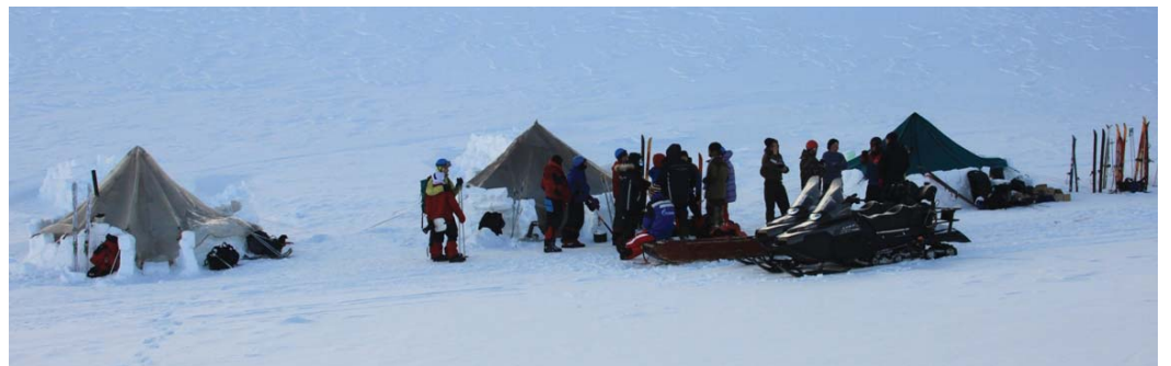
Базовый лагерь у подножия горы Народной