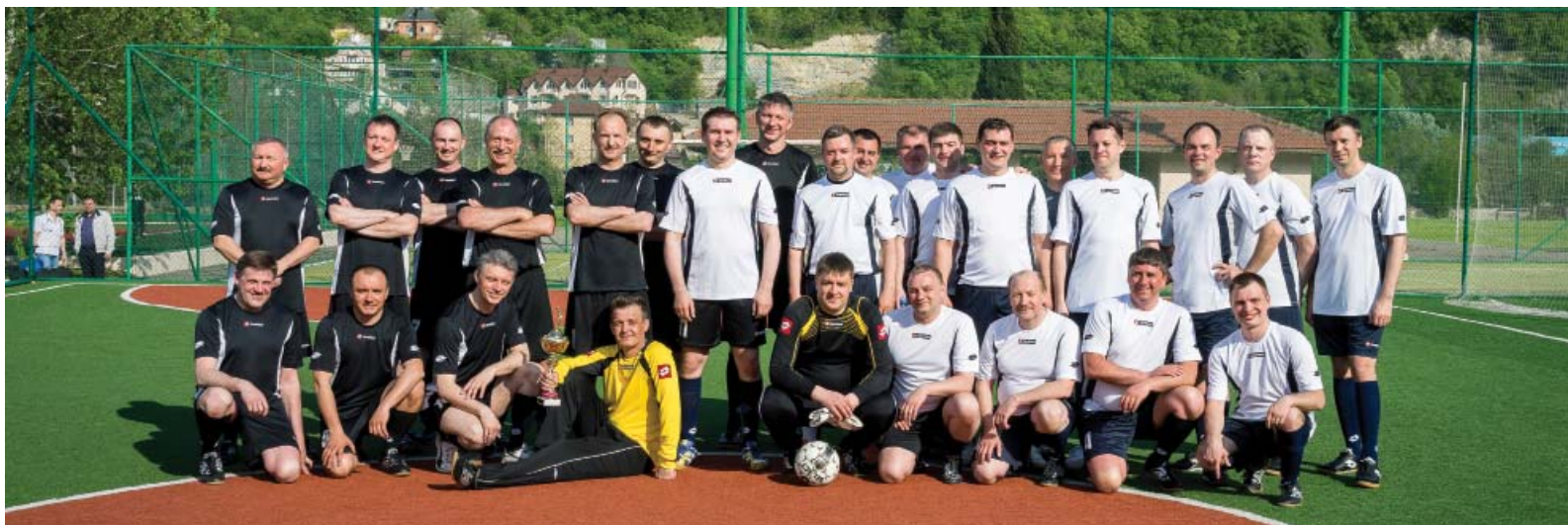
После финальных соревнований спартакиады руководителей