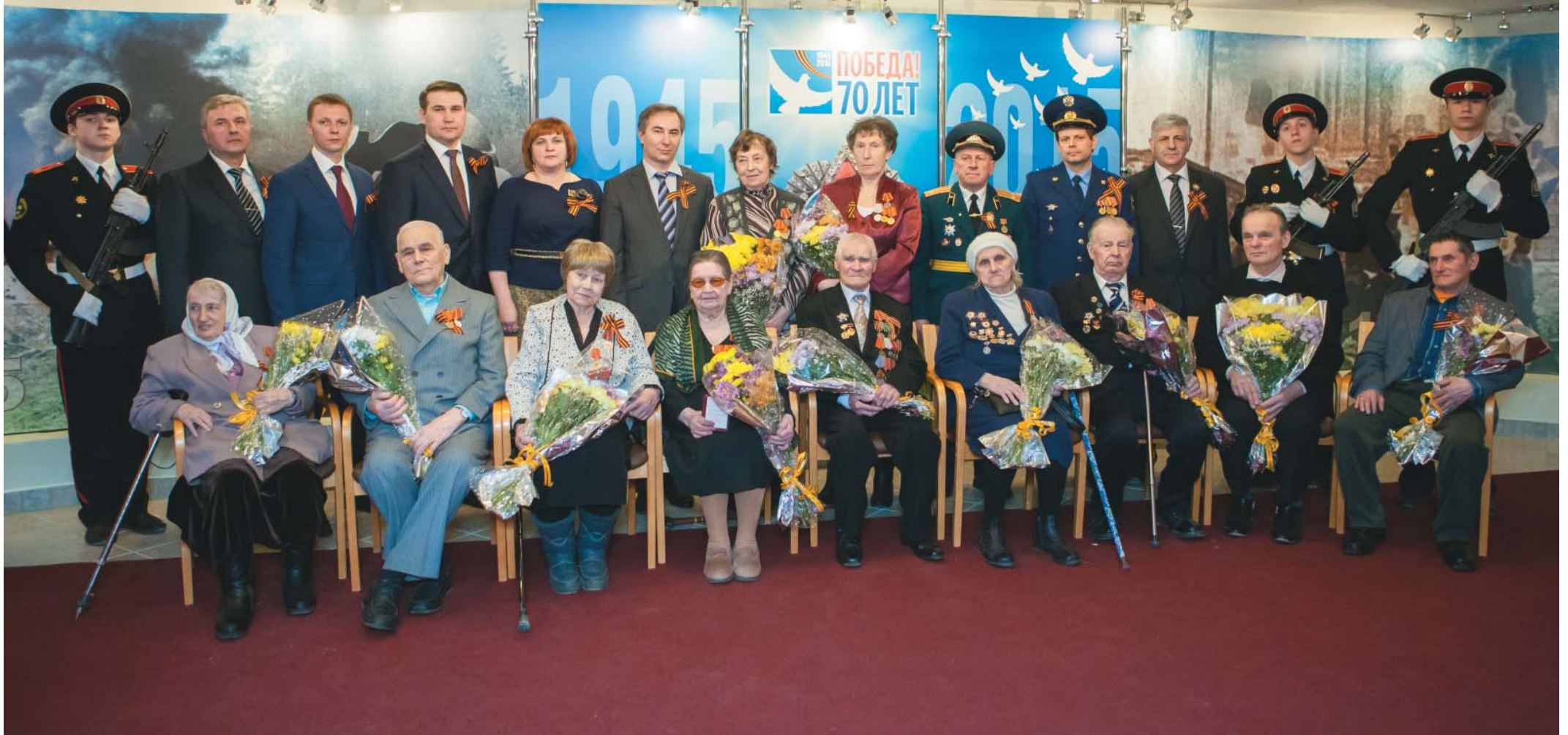
Участники торжественной церемонии вручения юбилейных медалей «70 лет Победы в Великой Отечественной войне».