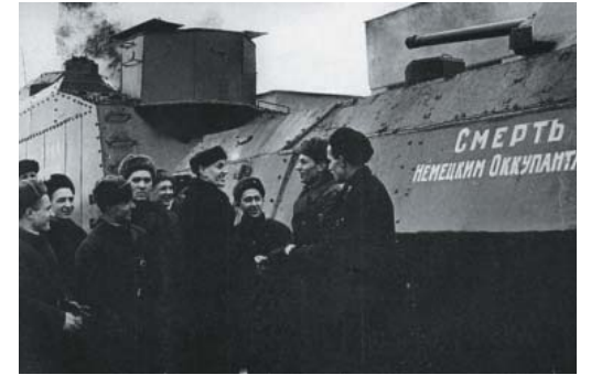
Бронепоезд — подарок фронту