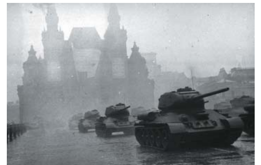
Танки на Параде Победы 24 июня 1945 г.