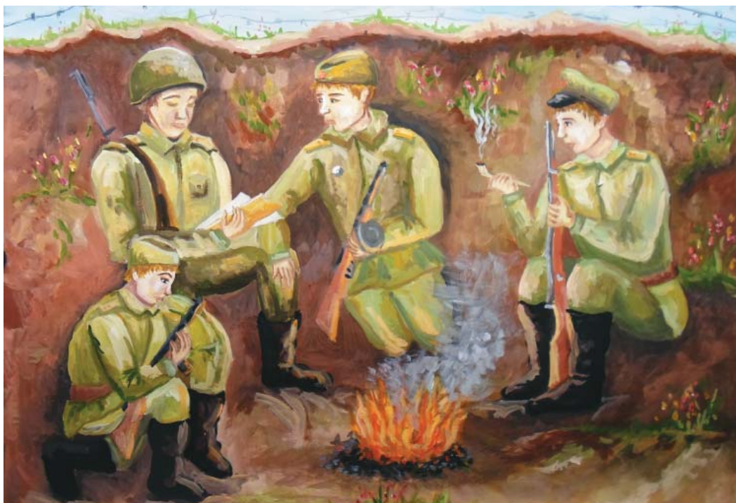
Нечаева Юлия, 14 лет, «Письмо из дома»