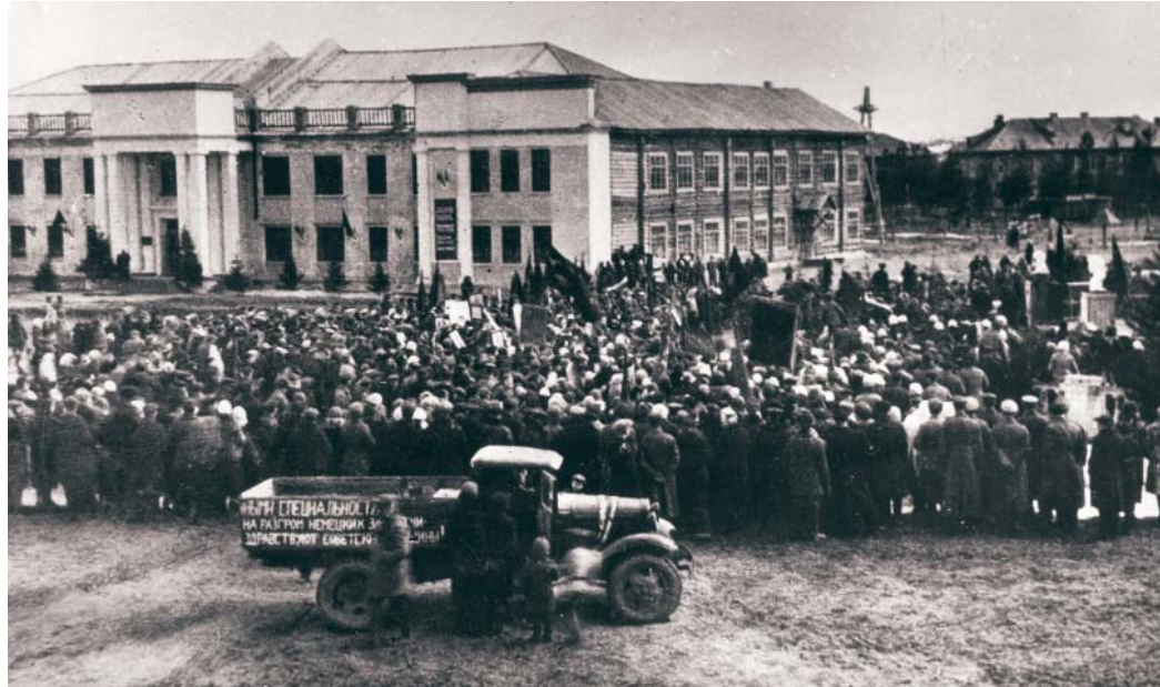
День Победы 1945 г. в Ухте

Радость, охватившая меня, не могла вместиться в переполненном переживаниями сердце. Во мне зародилось непреодолимое желание поделиться ею с другими. Начались непрерывные телефонные перезвоны. Но и это не удовлетворяло. Хотелось непосредственного общения с людьми.