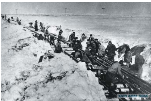
На строительстве железной дороги. Абезь, Коми АССР