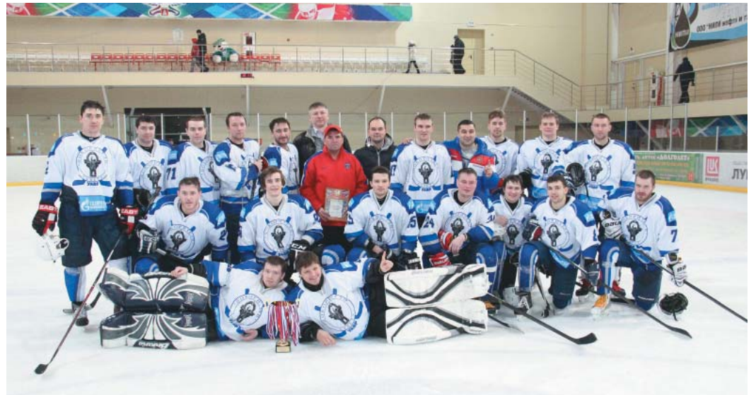
1-е место у команды «Газпром трансгаз Ухта»