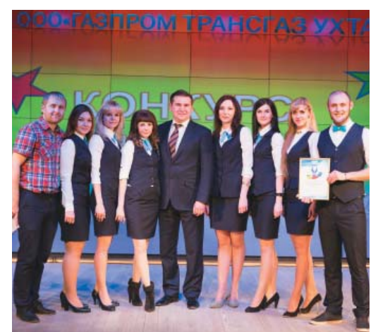
«Станция узловая» (Грязовецкое ЛПУМГ)