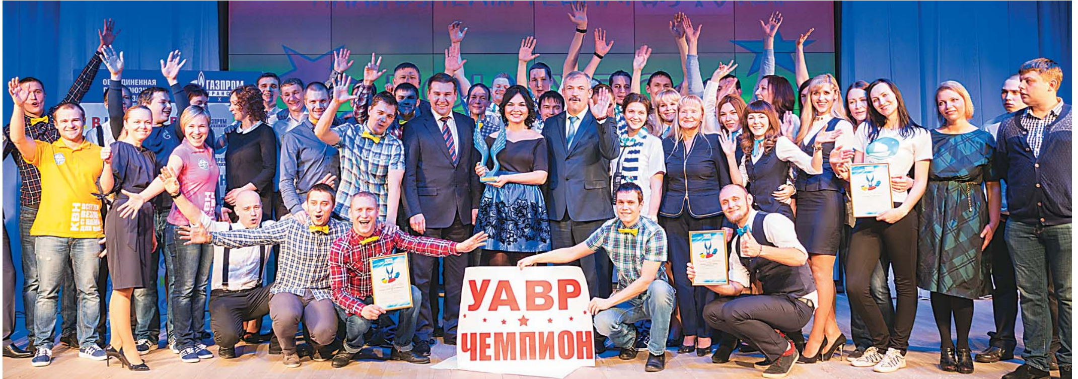
Общее фото в финале