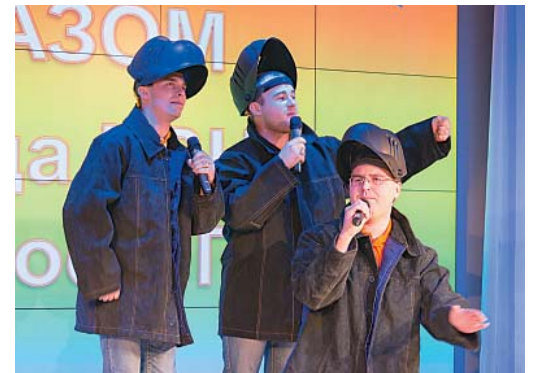
«Под газом» из Шексны