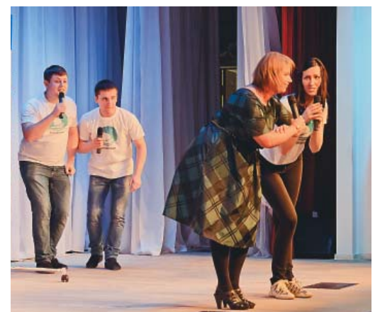
«Гольфстрим» (Микуньское ЛПУМГ)