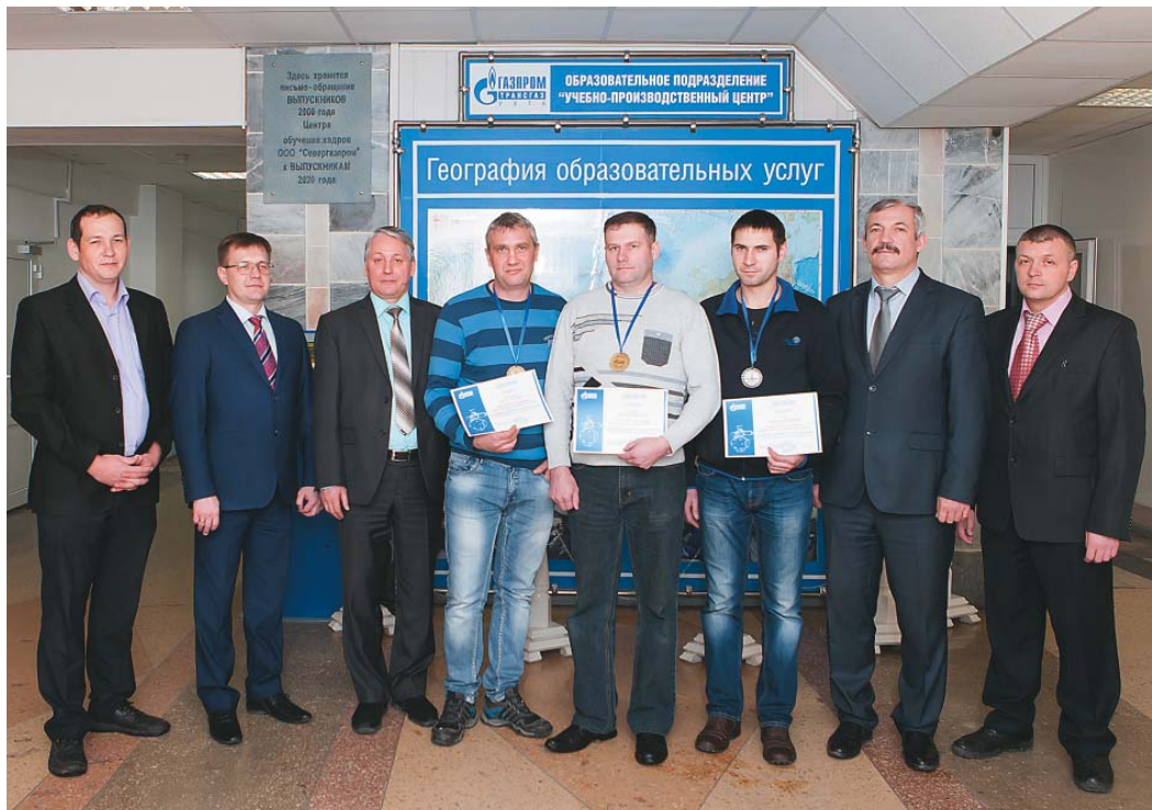
Лучшие трубопроводчики линейные

Отметим, что на конкурсных площадках линейных трубопроводчиков царилась обстановка дружелюбия, здоровой конкуренции и