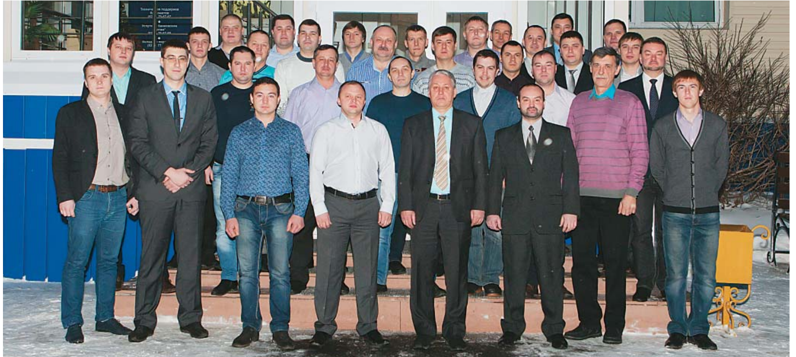
Участники семинара.

Успешному решению проблем, возникающих в ходе пусконаладочных работ и эксплуатации трубопроводной арматуры, была посвящена тематика докладов участников семинара. Выступающие содержательно и