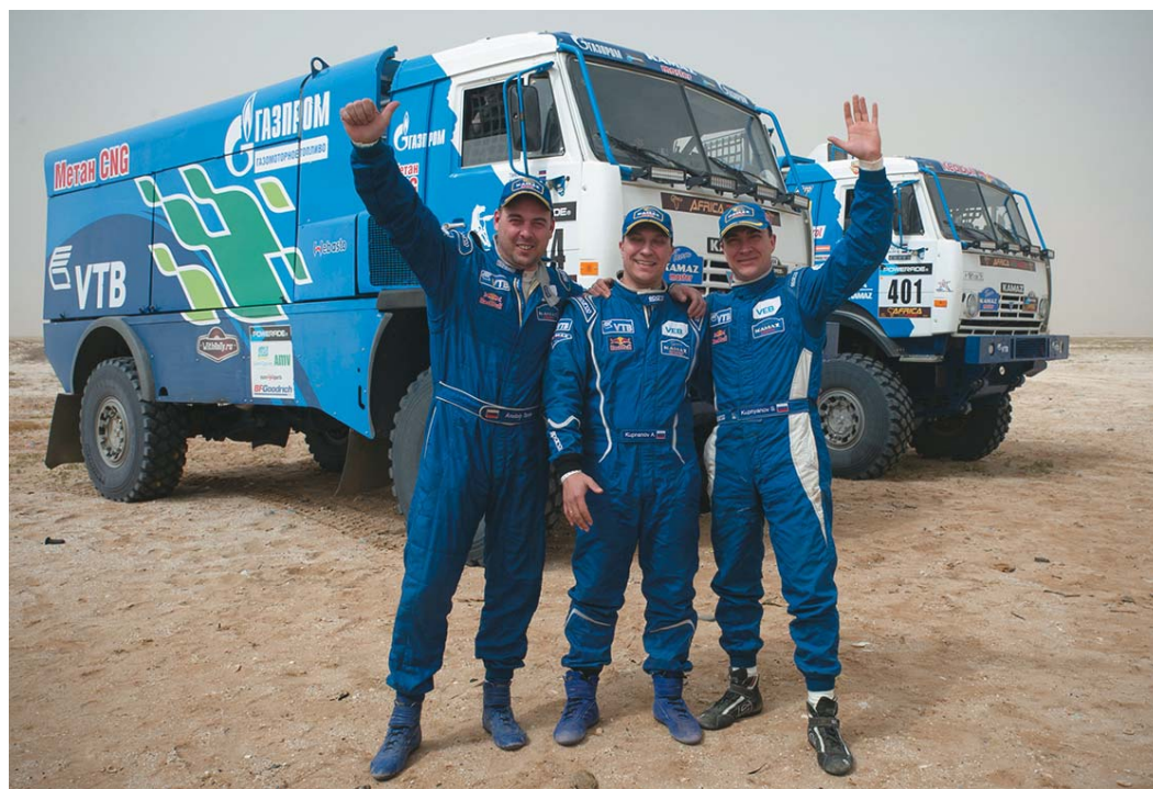
«Экипаж машины боевой»

В. Суфьянова, Н. Куприянова (ООО «Газпром газомоторное топливо»), М. Ласточкин (журнал «Полный привод 4x4»), редакция сайта ОАО «Газпром» www.gazprom.ru