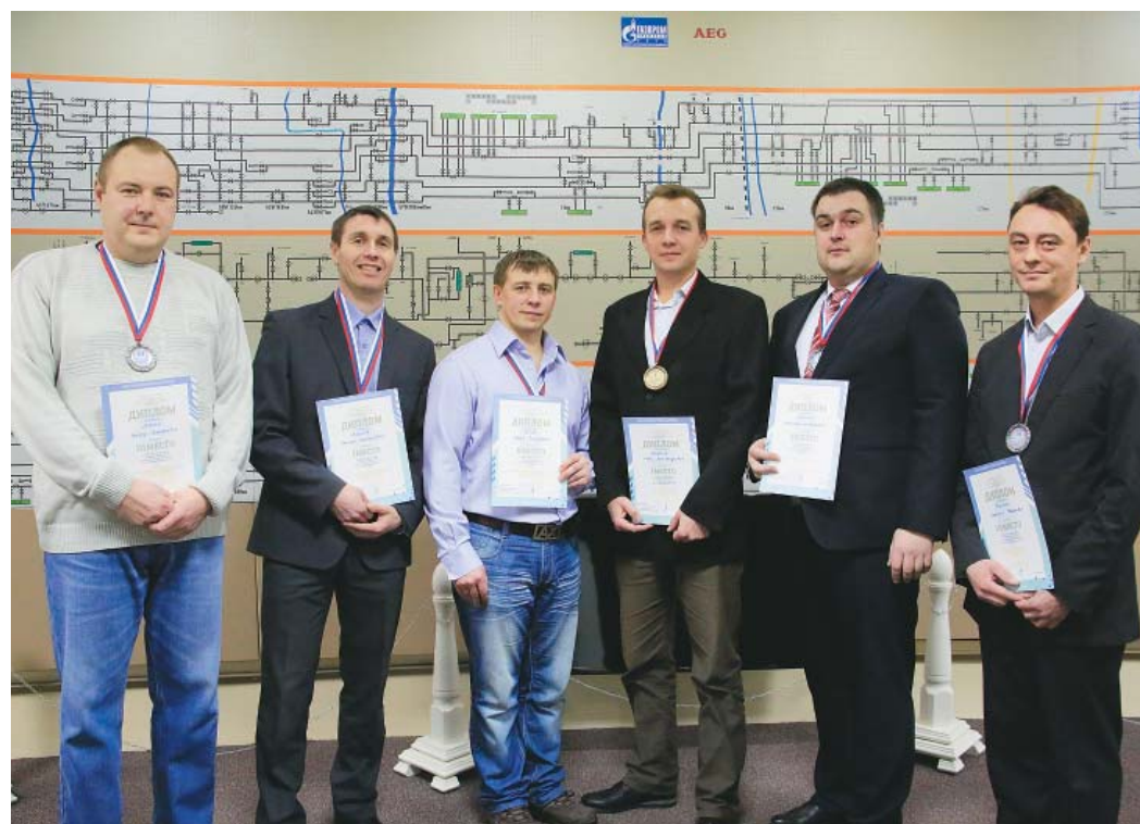
Лучшие специалисты неразрушающего контроля

азарта. Ведь те, кто участвовал в соревнованиях — опытные мастера и знают, что в производственной ситуации без взаимопомощи и взаимовыручки не выполнить поставленной задачи. А для победы нужны были знания, верные руки и немного везения.