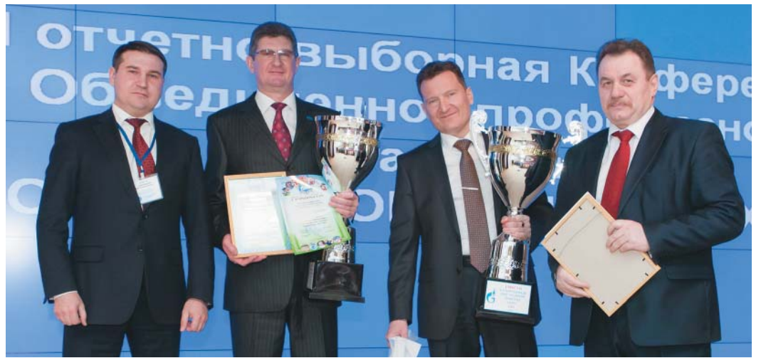
1 место заняла сборная команда Службы корпоративной защиты и Медико-санитарной части.

Страницу подготовили Е. Васильева, А. Ямщиков, фото из архива редакции