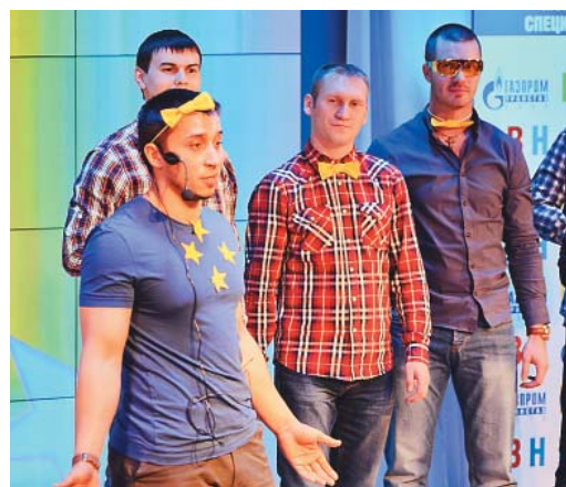
«Паровозик из Ромашково» (УАВР)