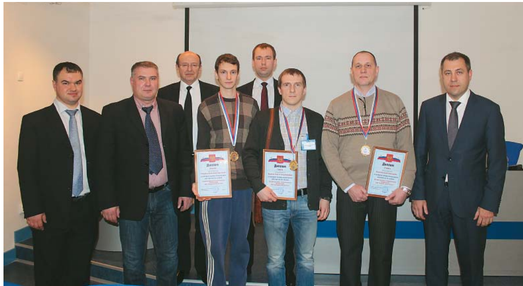
Лучшие машинисты технологических компрессоров

На исходе 2014 года в Ухте прошли конкурсы профессионального мастерства машинистов технологических компрессоров, линейных трубопроводчиков и специалистов неразрушающего контроля.