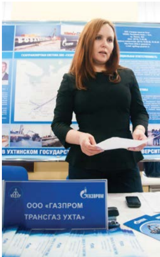
Наибольшее количество резюме поступило в ООО «Газпром трансгаз Ухта»

Стоит отметить, что в ПАО «Газпром» большое внимание уделяется развитию эффективной кадровой политики. Реализуется система бизнес-процессов, которые направлены на привлечение и удержание высококвалифицированных специалистов. Особый интерес здесь представляет взаимодействие