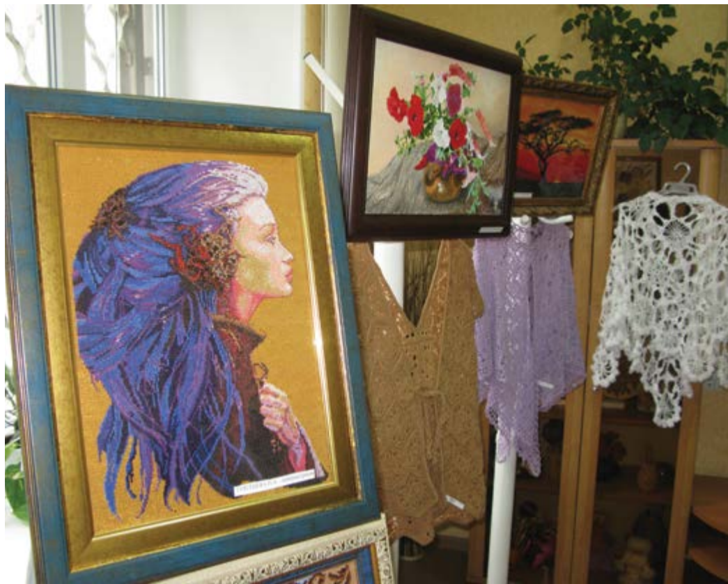
Рукоделие – лучший способ сохранить творческий настрой и бодрость духа