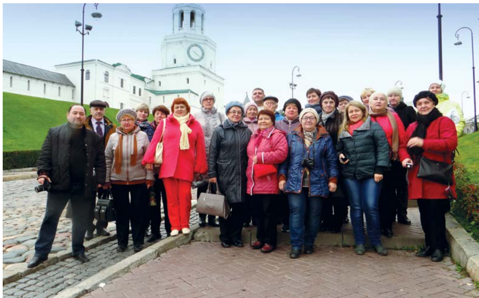
Пенсионеры нашего Общества назвали поездку в Казань «царским подарком»