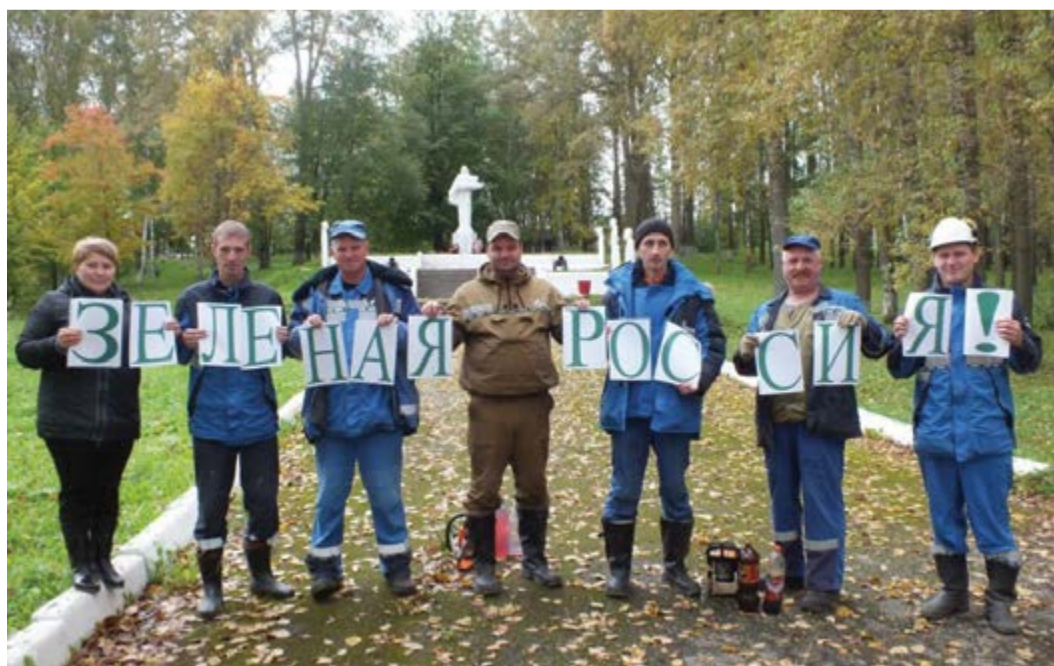
Сотрудники Шекснинского ЛПУМГ