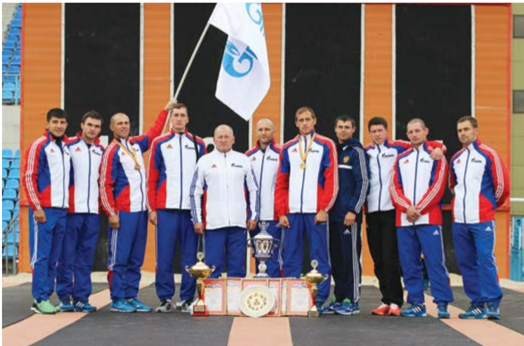
Команда ПАО «Газпром»