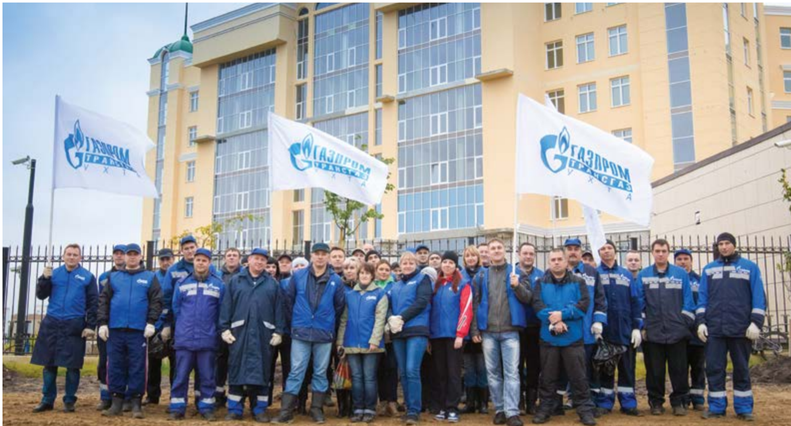
Сотрудники ухтинских подразделений на озеленении территории у нового здания администрации Общества

Было собрано почти 1000 кубометров мусора и очищен район общей площадью в 229 гектаров. Сотрудники убрались на территориях школ, стадионов, автодорог, на прибрежных участках местных рек и озер, на пляжах, на местах, прилегающих к компрессорным станциям.