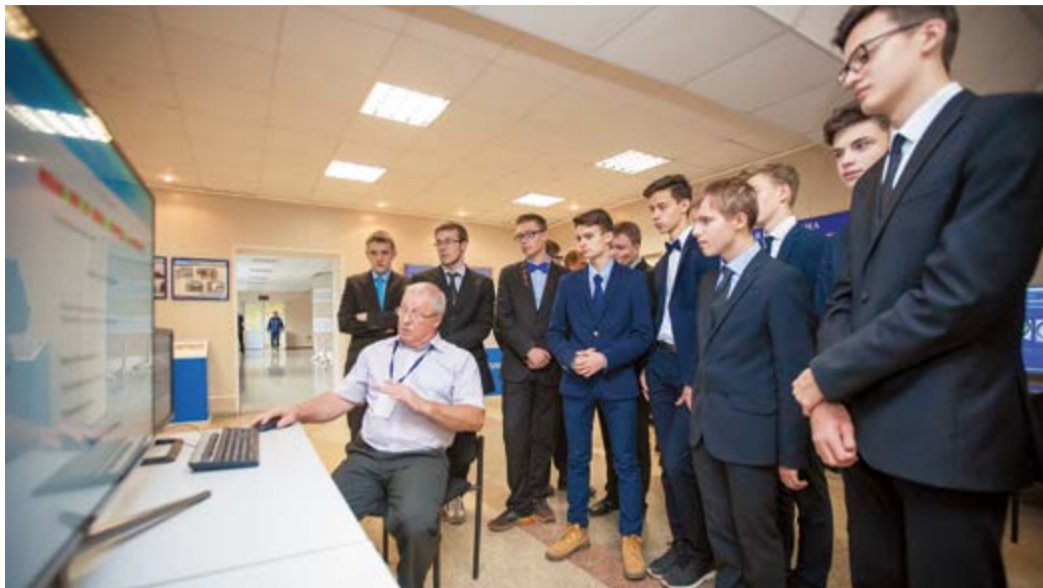
Студенты проявляли неподдельный интерес к демонстрации компьютерных обучающих систем

Сейчас на конкурсе представляют электронные учебники, тренажеры-имитаторы, автоматизированные обучающие системы,