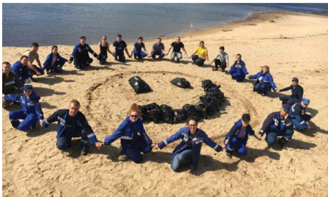
Сотрудники Микуньского ЛПУМГ

Е. Дементьева, Д. Майорова, фото из архива