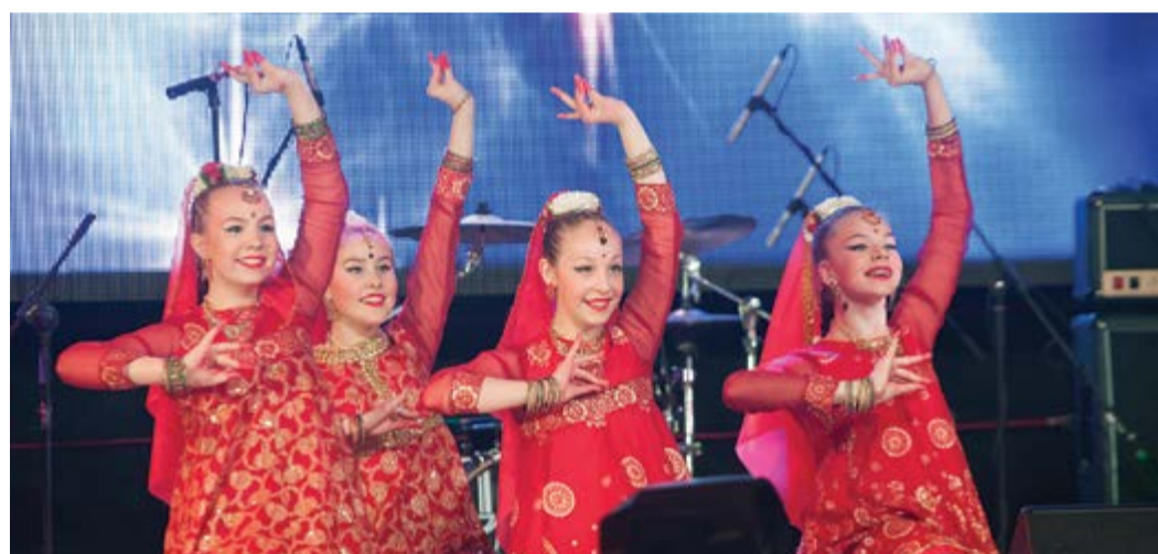
Коллектив индийского танца «Лакшми» – обладатели Гран-при фестиваля «Серебряные кружева»