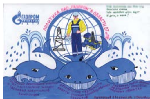
2 место – Наумышев Евгений, 17 лет