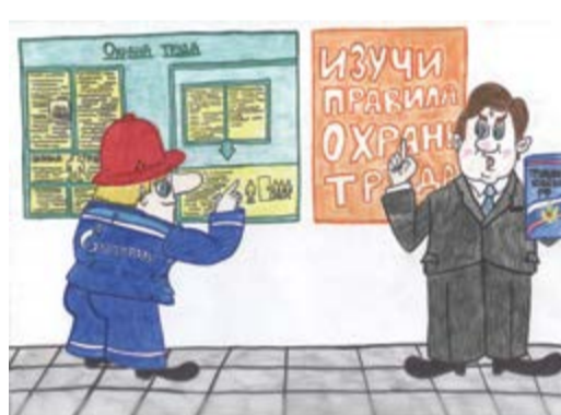
3 место – Егорова Маргарита, 14 лет