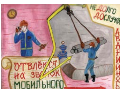
3 место – Двойченко Даниил, 15 лет