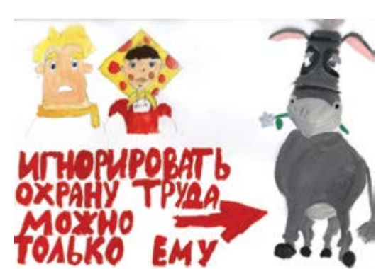
Юмор в охране труда – Черняева Дарья, 13 лет