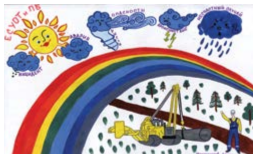
2 место – Наумышев Денис, 10 лет