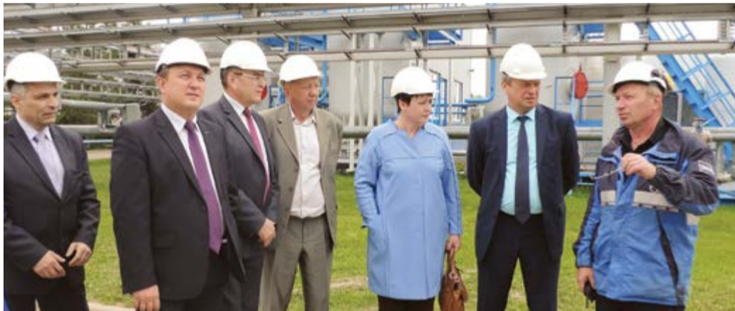
Посещение участниками конференции объектов Грязовецкого ЛПУМГ

Участникам конференции была представлена презентация: «Информация о выполнении в Грязовецком ЛПУМГ мероприятий в рамках Года охраны труда в ПАО «Газпром» и о результатах работы в области охраны труда, промышленной и пожарной безопасности в 2015 году». Делегация посетила диспетчерский пункт управления, побывала на