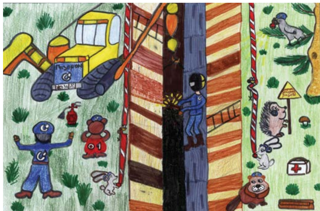
1 место – Орлова Валерия, 10 лет