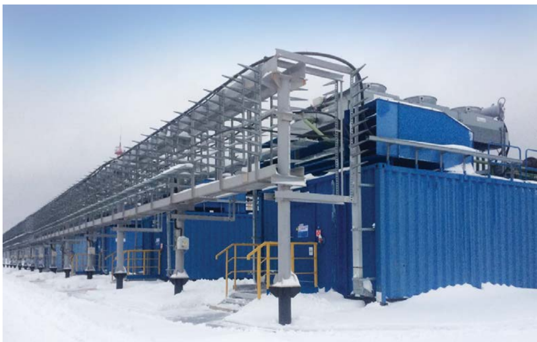
Электростанция собственных нужд в Микуньском ЛПУМГ