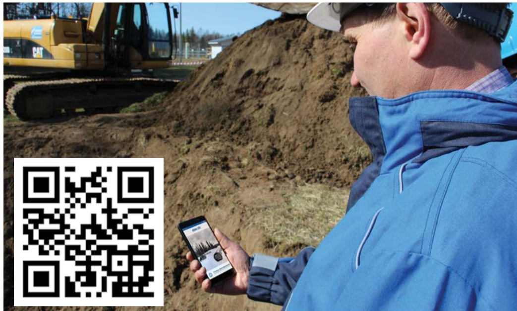
Мобильное приложение поможет обезопасить вас и сэкономить ваше время