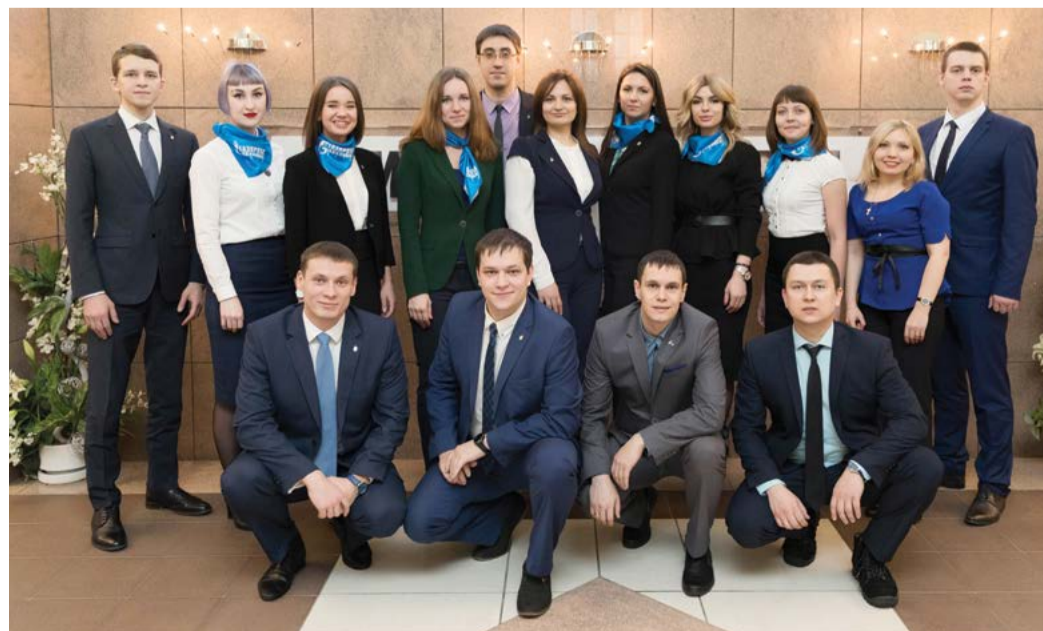
Совет молодых специалистов ООО «Газпром трансгаз Ухта», декабрь 2016 года

Беседовала Д. Майорова