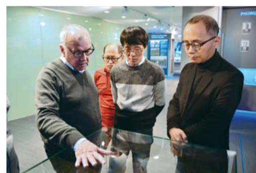
В музее предприятия

Вопросы о своевременном и качественном проведении диагностики магистральных газопроводов, которые были подняты во время рабочей встречи, отличались высокой степенью актуальности для всех сторон – участников.