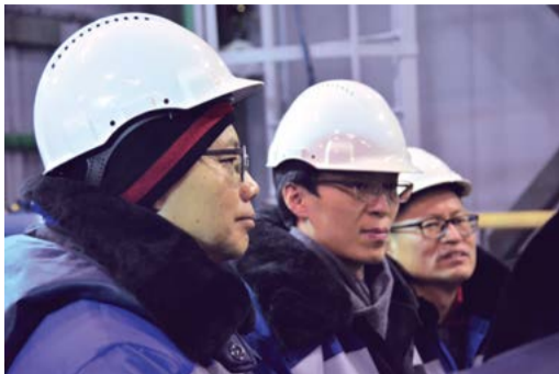
На территории КС-10

С 13 по 15 декабря в ООО «Газпром трансгаз Ухта» прошла рабочая встреча группы по научно-техническому сотрудничеству ПАО «Газпром» с компанией из Южной Кореи «КОГАЗ».