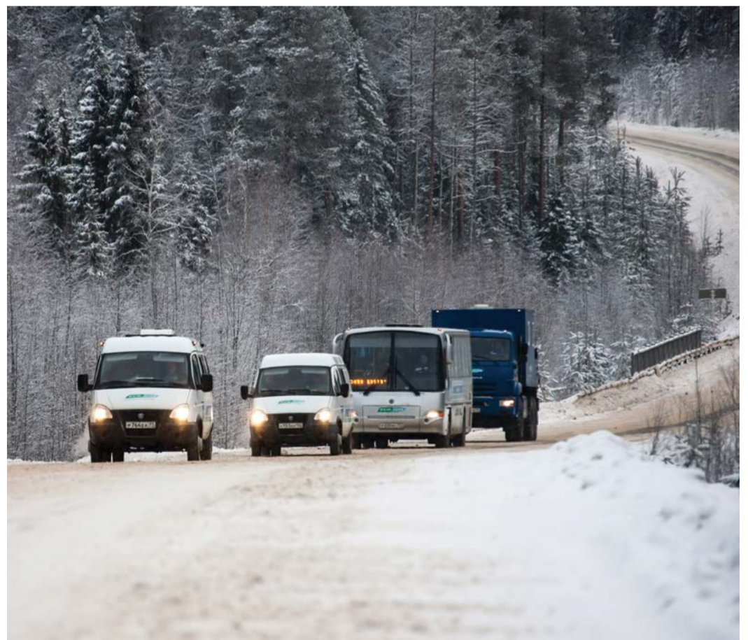
Автоколонна проехала по регионам производственной деятельности предприятия