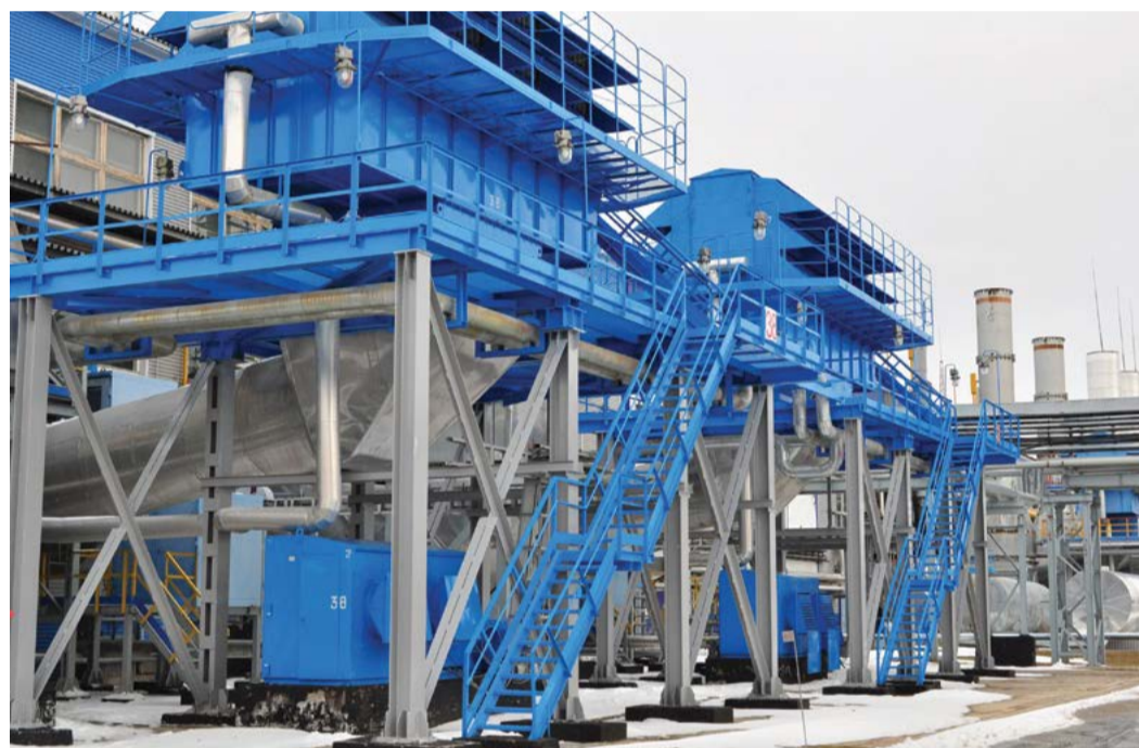
Цех №3 Урдомского ЛПУМГ

– Сегодня филиал продолжает работу, начатую в 2000-х, когда в ЛПУМГ были осуществлены масштабные по значимости проекты: строительство газопроводной системы «СРТО-Торжок», реконструкция 3-го