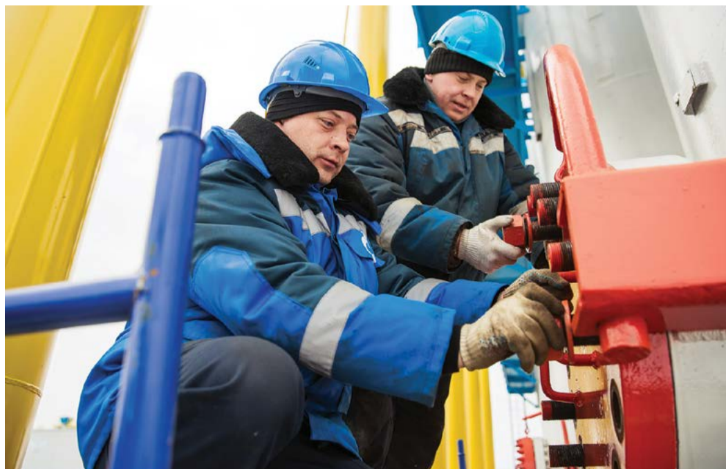
Наладка и контроль