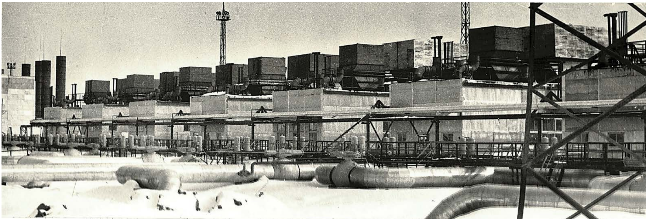
КС-13, цех № 4, 1982 год

В начале декабря свое 45-летие отметило Урдомское линейно-производственное управление магистральных газопроводов.