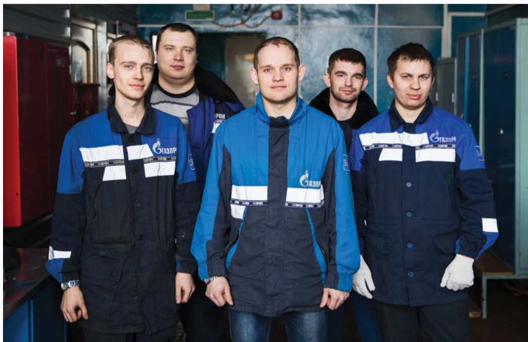
Филиал славится дружным коллективом