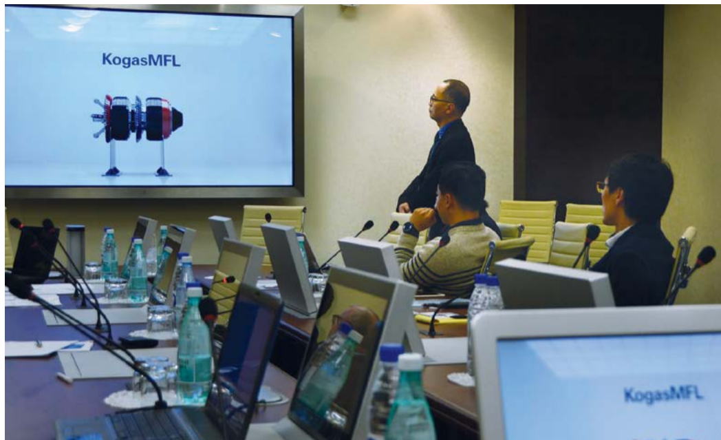
С коллегами из Южной Кореи наши работники обсудили важные вопросы

– За небольшой срок встречи мы обсудили много вопросов связанных с организацией работ по эксплуатации объектов в арктических условиях, проблемы внутритрубной диагностики, а так же новые методы и подходы к стресс-коррозионным дефектам. Не сомневаюсь, что встреча была интересна и полезна не только нам, но и нашим корейским коллегам, – резю-