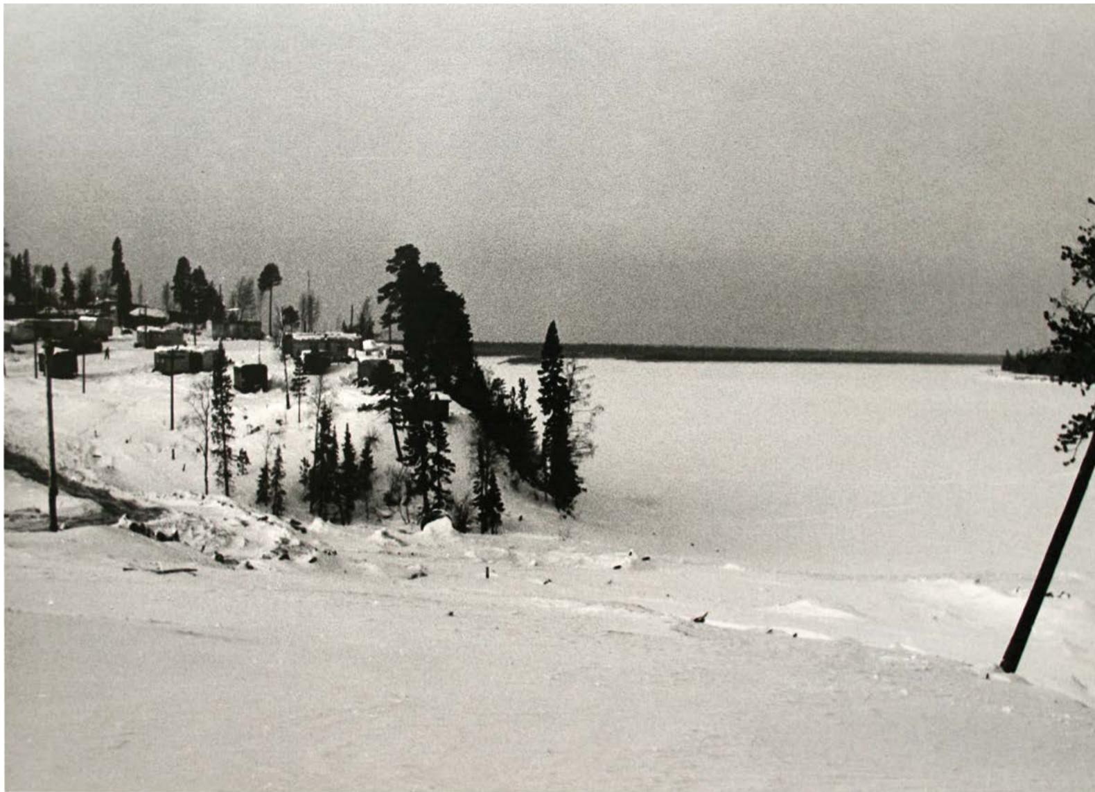
Первый поселок строителей Вуктыльского газопромысла, 1967 год

Газопромысловое управление «Комигазпром» имеет в своем составе промышленный вид деятельности и капитальное строительство, который выполняет функции заказчика в виде Дирекции по обустройству промыслов в Коми АССР.