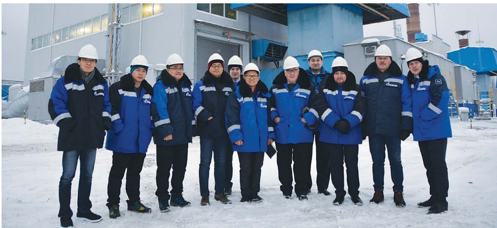
Участники рабочей встречи на территории цеха № 6 КС-10