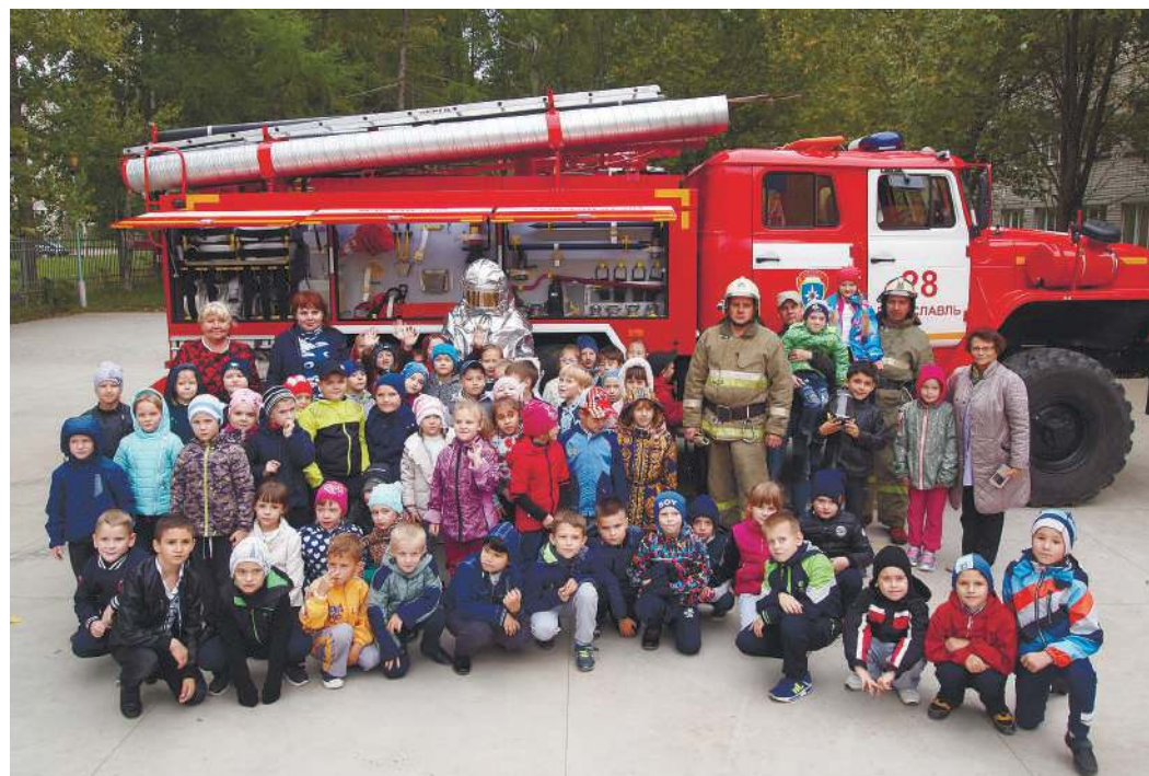
Первоклашки школы № 6 города Переславль-Залесский