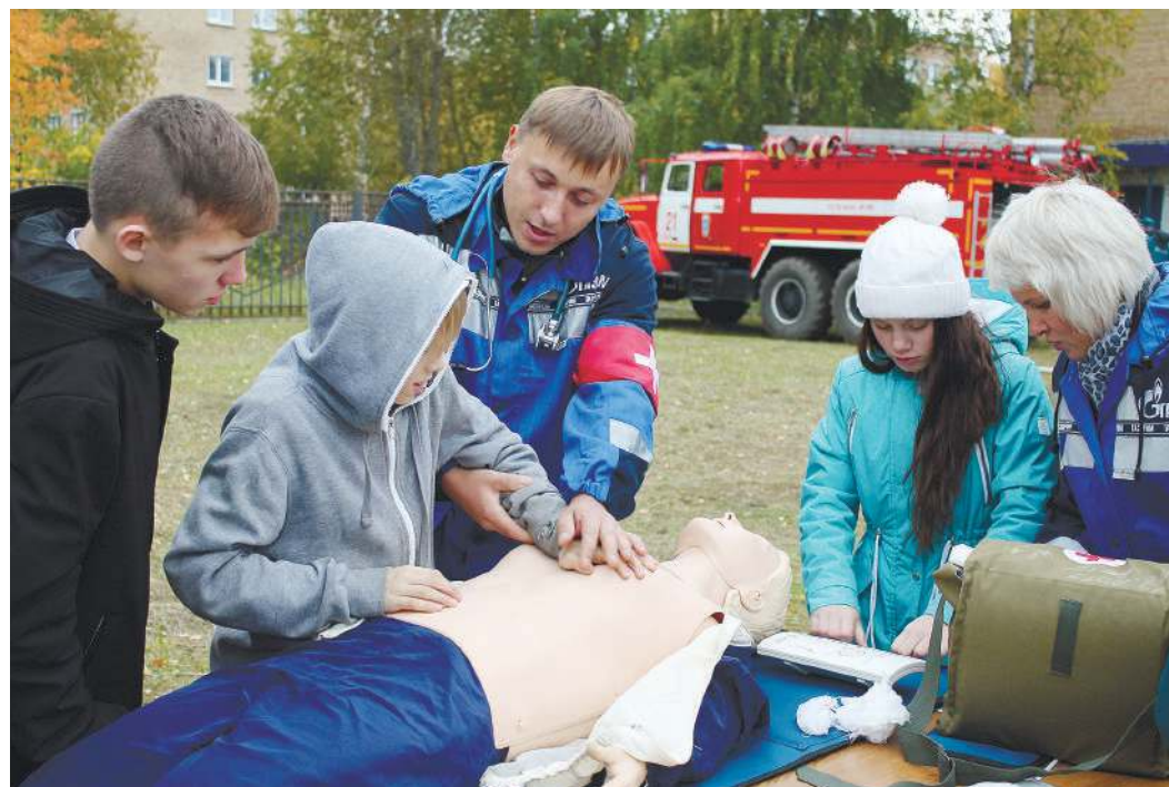
Демонстрация оказания первой медицинской помощи в школе-интернате № 2