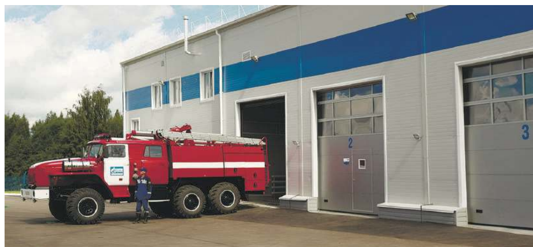
Строительство новых пожарных постов длилось год

Кроме того, согласно инструкции взаимодействия между МЧС Ярославской области и нашим предприятием, при необходимости пожарные расчеты оказывают помощь в тушении пожаров и городским пожарным