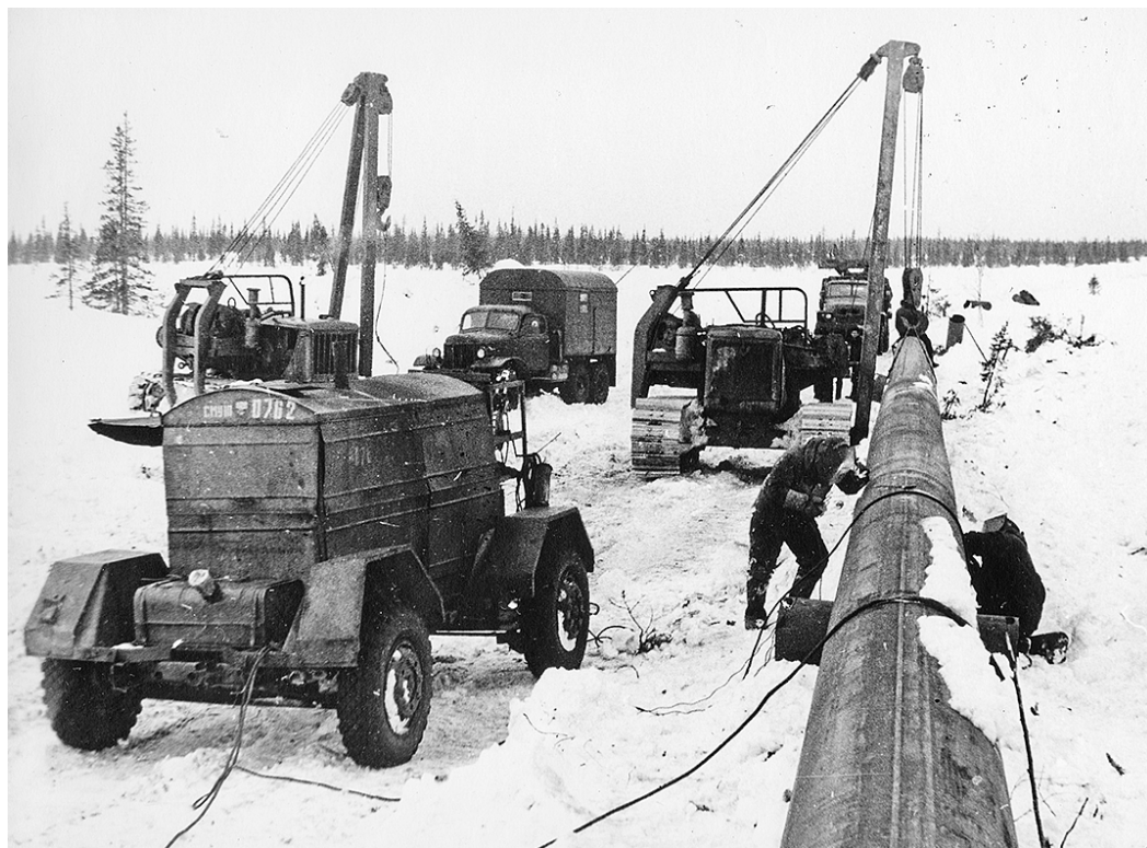
Строительство газопровода, 1967-1969 года