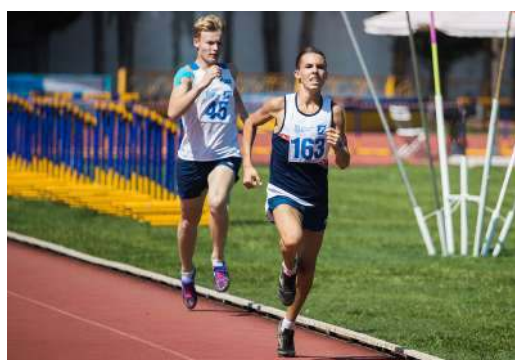
Команда легкоатлетов показала волю к победе