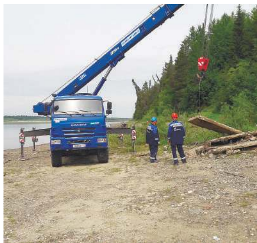
Для очистки рек была привлечена техника