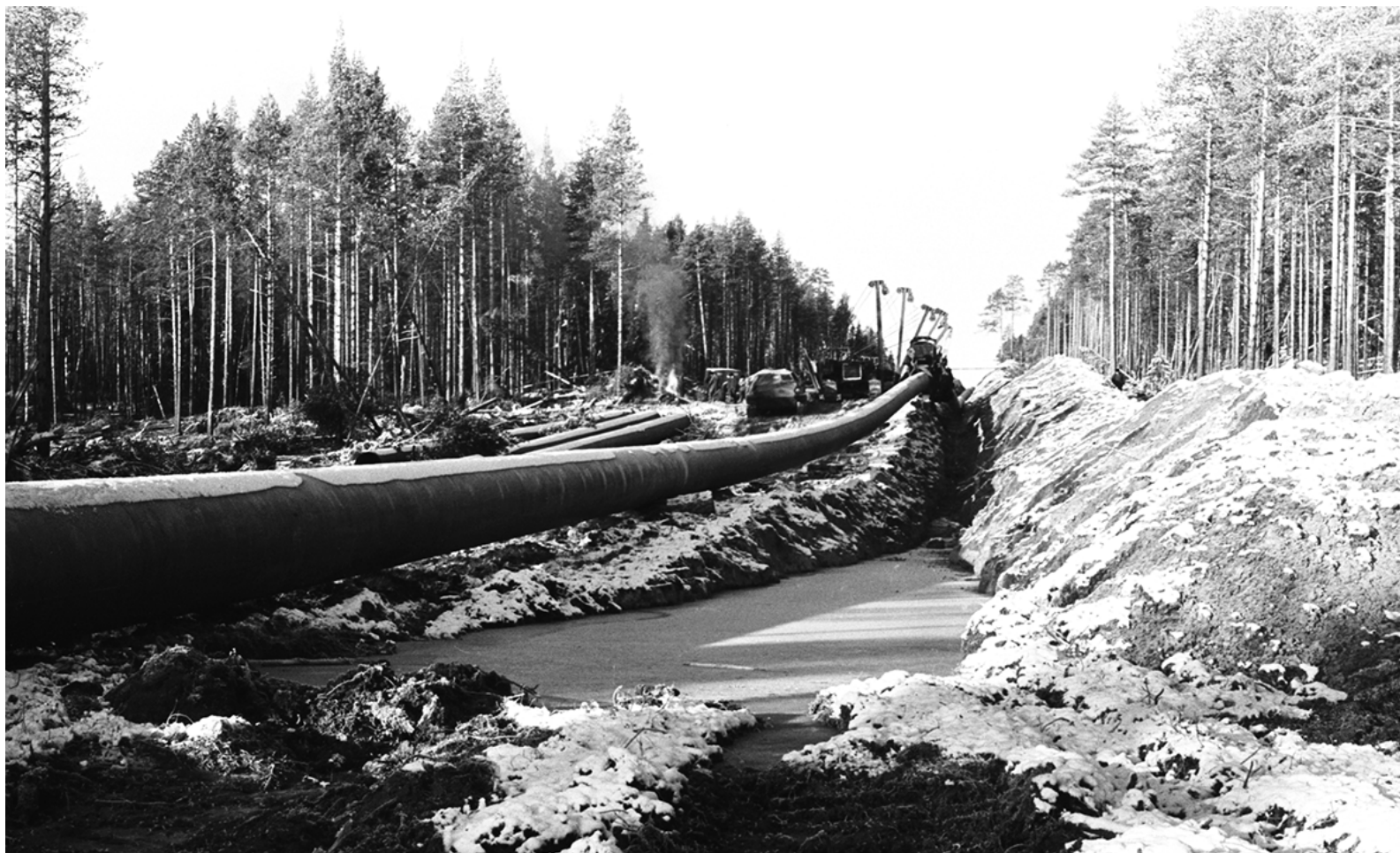
Изоляция труб газопровода «Сияние Севера» и укладка их в траншею на участке Нижний Одес–Сосновка, 1968 год