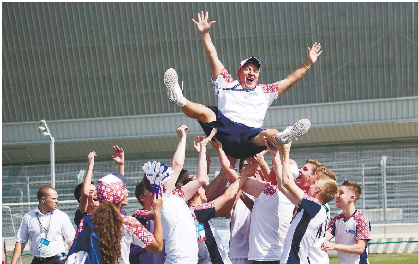
Юные футболисты празднуют выход в полуфинал

Больше фотографий: ukhta-tr.gazprom.ru vk.com/gazprom_gtukhta facebook.com/gazpromgtukhta