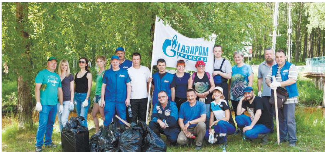
Акция сплотила коллектив и принесла реальную пользу природе