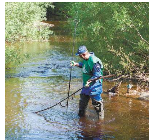
Процесс очистки дна от мусора