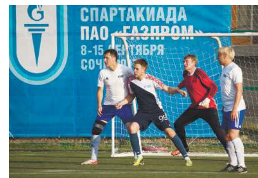
На футбольном поле во всех смыслах было жарко