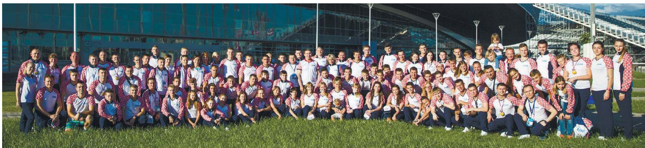
Делегация ООО «Газпром трансгаз Ухта»: спортивная, дружная, наша.