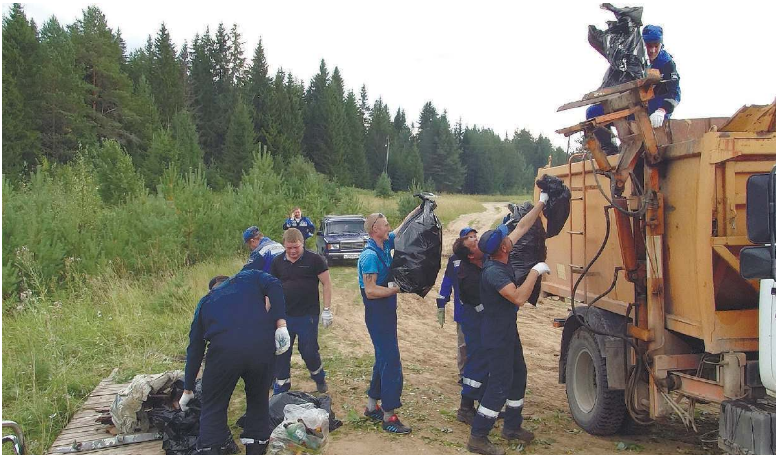
Сотрудники Урдомского ЛПУМГ собрали и вывезли с берегов Вычегды рекордное количество мусора – 60 кубических метров

В филиалах по Республике Коми в акции приняли участие 377 человек, которые очистили от мусора территорию площадью в 19,8 га. Администрация и ухтинские структурные подразделения привели в порядок берега небольшой реки Чибью, сотрудники Воркутинского ЛПУМГ очистили прибрежную территорию крупнейшего притока Печоры – реку Уса, прибрежный участок самой Печоры очистили сотрудники Печорского ЛПУМГ, берег ручья Безымянного очистили наши коллеги из Вуктыльского филиала, водный памятник природы Параськины озера привели в порядок сотрудники Сосногорского ЛПУМГ, работники Микуньского ЛПУМГ в деревне Тьдор очистили берег крупнейшей реки региона – Вычегды.