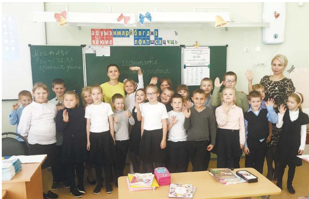
Открытый урок во втором классе Урдомской средней школы

Используя яркие слайды, простые примеры и цифры сотрудники рассказали детям о