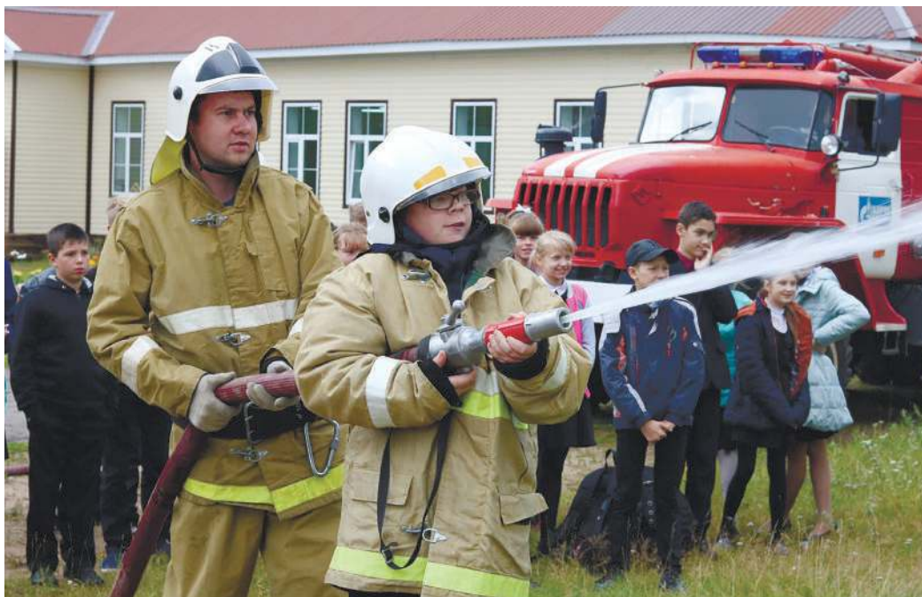
Пятиклассникам Бабаевской школы посчастливилось «пострелять» по мишеням из пожарного рукава

20 сентября в Ухте акция была проведена в школе-интернате № 2 для детей сирот и детей, оставшихся без попечения родителей – подшефном учреждении УТТиСТ. Дети ранее уже проходили викторины, слушали лекции по безопасности, но практическое занятие там проводилось впервые и вызвало у ребят неподдельный интерес. Представители добровольных пожарных формирований УТТиСТ показали детям, как подается вода из пожарной машины, научили пользоваться огнетушителем. Детям предоставили возможность примерить на себя одежду пожарного, а