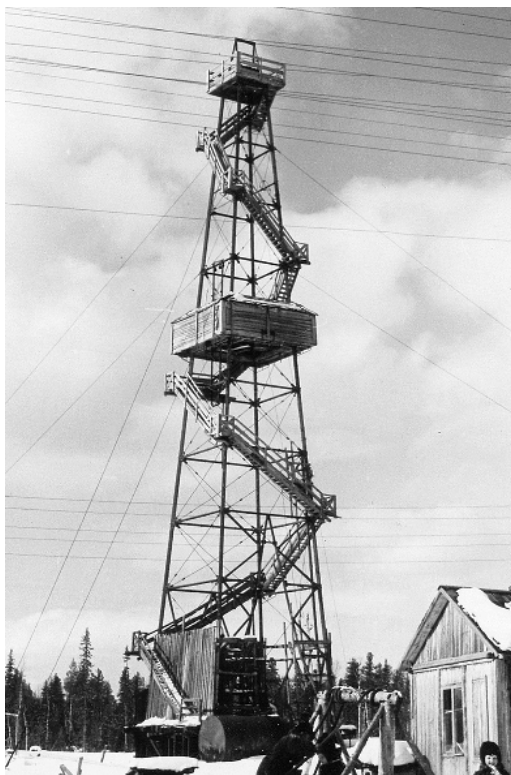
Буровая на Вуктыле