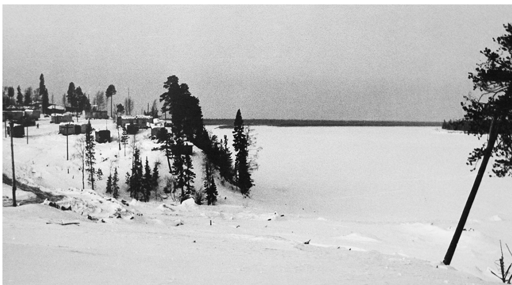
Поселок первых строителей на берегу Печоры, 1967 г.

ила козни строителям газопровода. Обилие осадков превратило даже маленькие болотца в непроходимые озера, торфяники расплзлись в непролазные топи.