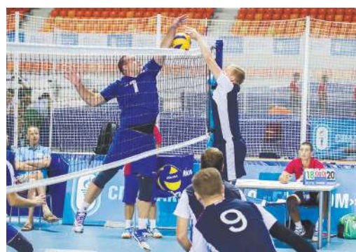
Нашим волейболистам достались сильные соперники