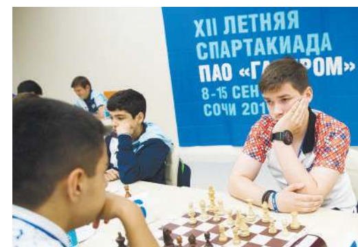
Десять туров, чтобы выявить сильнейших