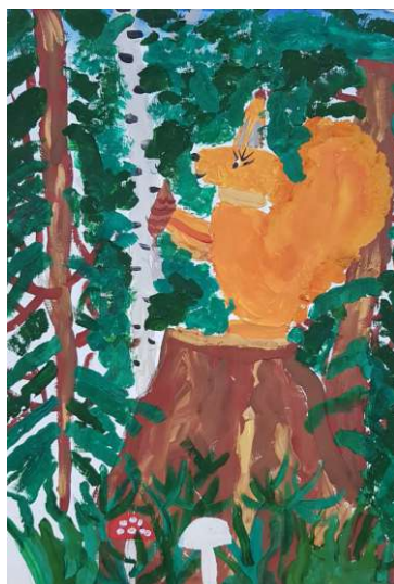
Кисенко Дарья, Вуктыльское ЛПУМГ