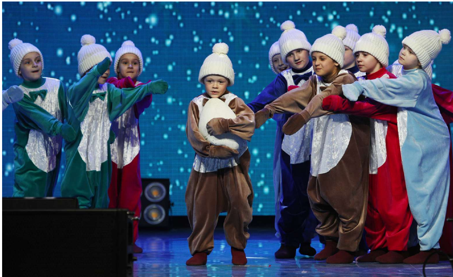
Детская образцовая хореографическая студия при Народном коллективе Ансамбль танца «Елочка», администрация