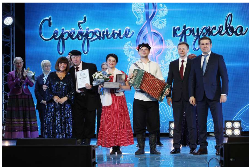
Народный коллектив, ансамбль народного танца «Русская душа», Грязовецкое ЛПУМГ:

На втором открытом межрегиональном фестивале «Серебряные кружева» лучшими были признаны: