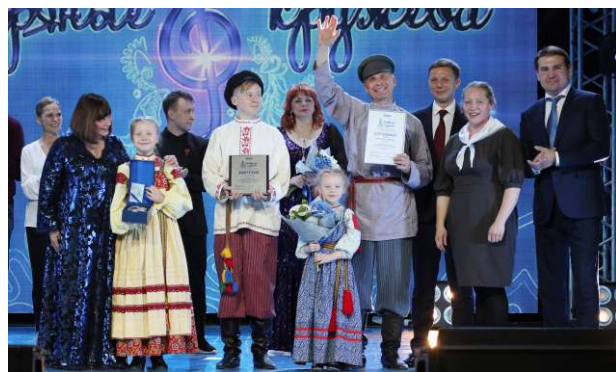
Образцовый фольклорный ансамбль «Боркуницы», Нюксенское ЛПУМГ