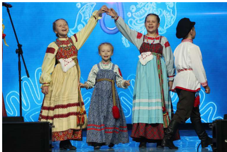
Образцовый фольклорный ансамбль «Боркунцы», Нюксенское ЛПУМГ