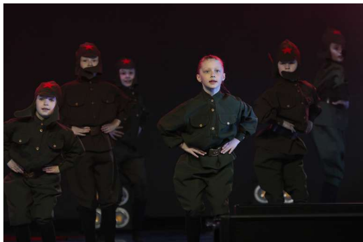
Хореографический ансамбль «Каприз», Мышкинское ЛПУМГ