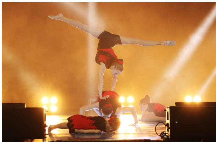
Хореографическая студия «Кристалл», г. Сосногорск