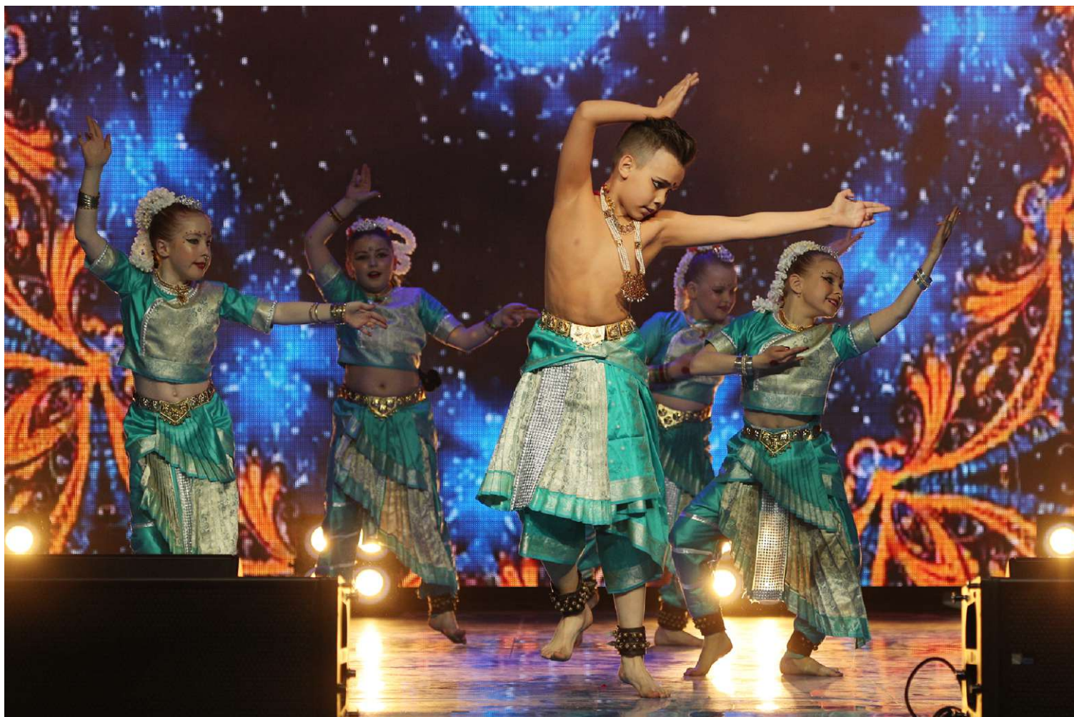
Коллектив индийского танца «Лакими», Приводинское ЛПУМГ