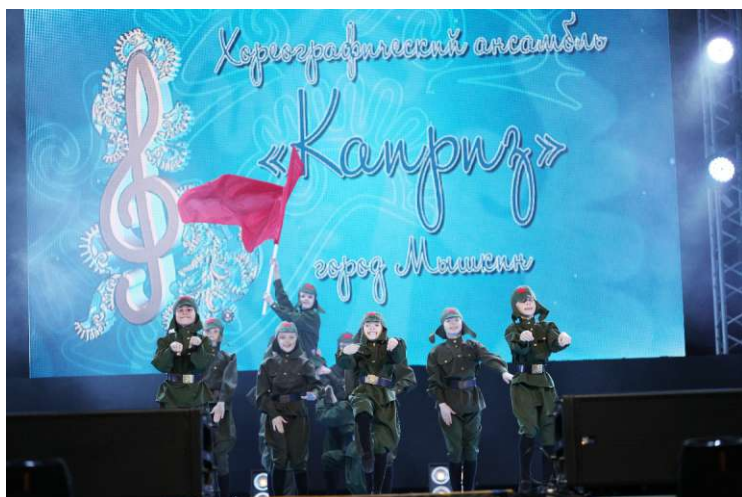
Хореографический ансамбль «Каприз», Мышкинское ЛПУМГ