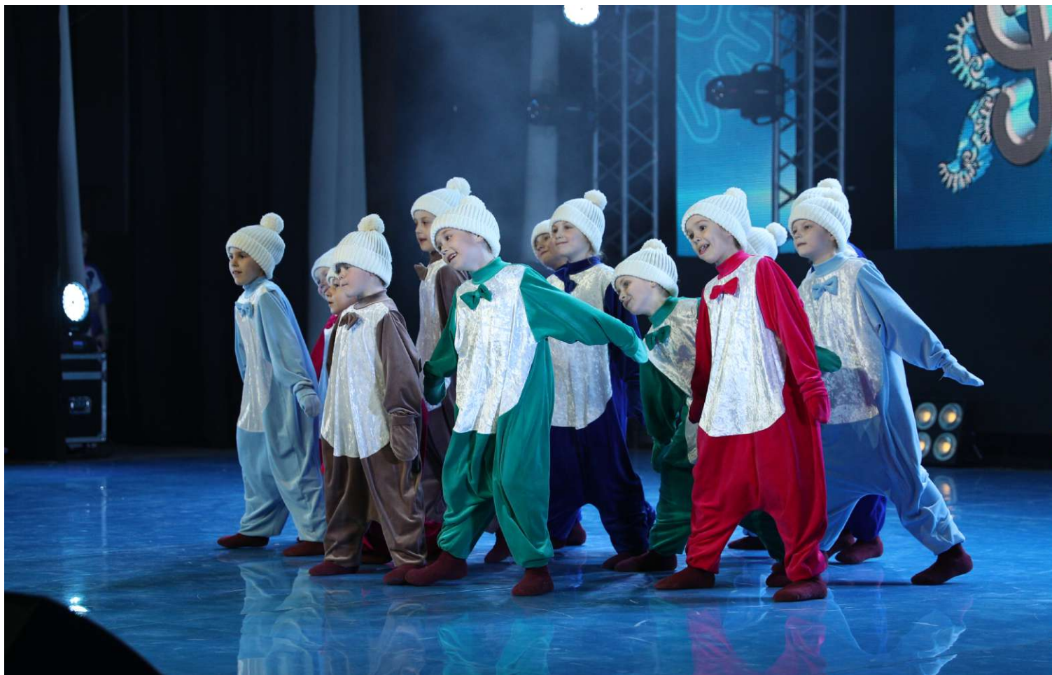
Детская образцовая хореографическая студия при Народном коллективе, ансамбле танца «Елочка», г. Ухта