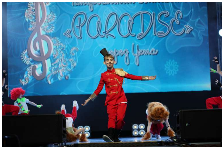
Танцевальный коллектив «PARADISE», УТТусТ