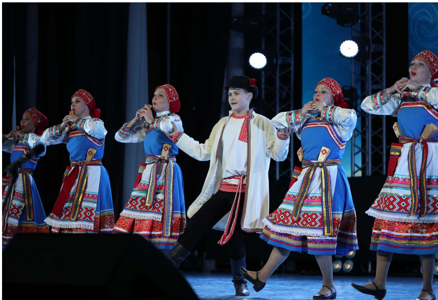
Народный коллектив, ансамбль танца «Елочка», администрация