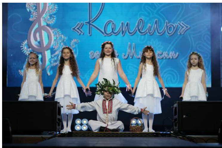
Вокальный ансамбль «Капель», Мышкинское ЛПУМГ