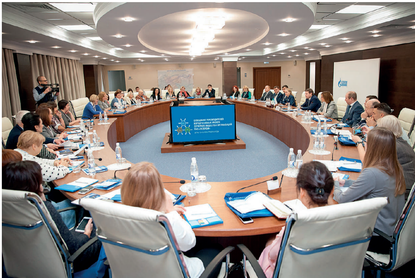
Первый блок совещания: выступления экспертов и дискуссионные обсуждения

Большой отклик участников вызвали обсуждения о создании и сохранении индивиду-