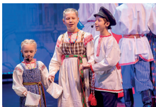
Образцовый ансамбль «Боркунцы»