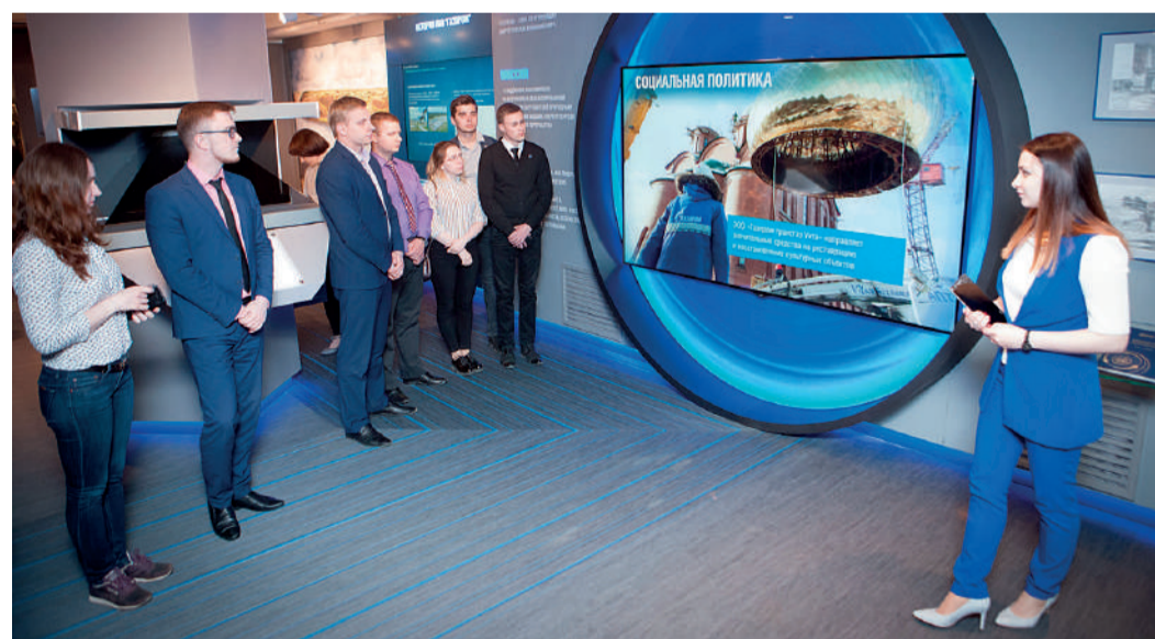
Презентационная экспозиция «История создания и развития ООО «Газпром трансгаз Ухта»

Благодаря коллегам и ветеранам предприятия сформирована база из 31 209 единиц хранения: фотографий, документальных фильмов, наглядных действующих макетов, диорам, инсталляций, исторических артефактов.