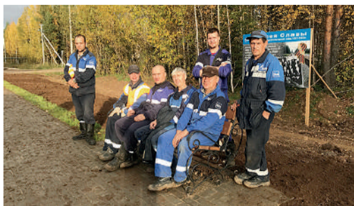
«Аллея Славы», Урдомское ЛПУМГ