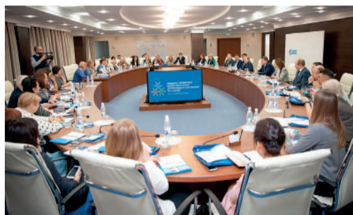
МУЗЕЙ ГАЗА Хранители истории