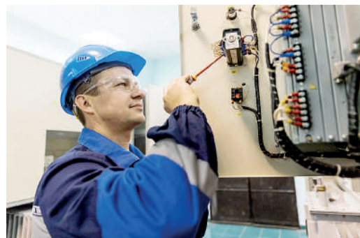
Техническое обслуживание ключа управления ячейкой