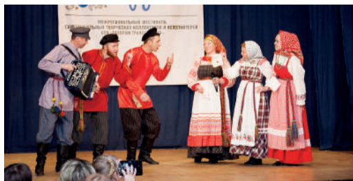
«Этностиль», Нюксенское ЛПУМГ