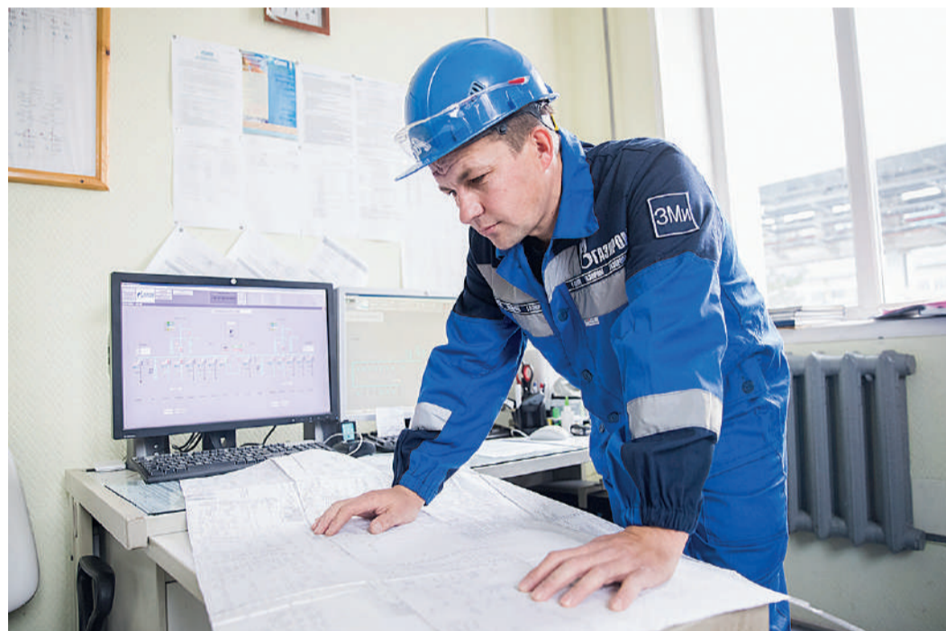
Ознакомление с монтажной схемой