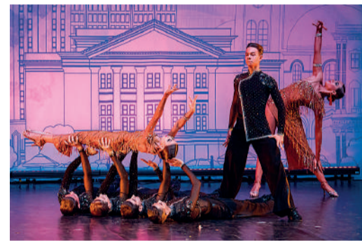
Романтичный танец «Фейерверка»