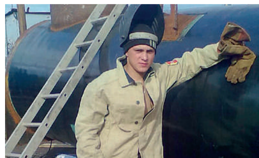
СИЛА В РАЗВИТИИ Профессиональное мастерство