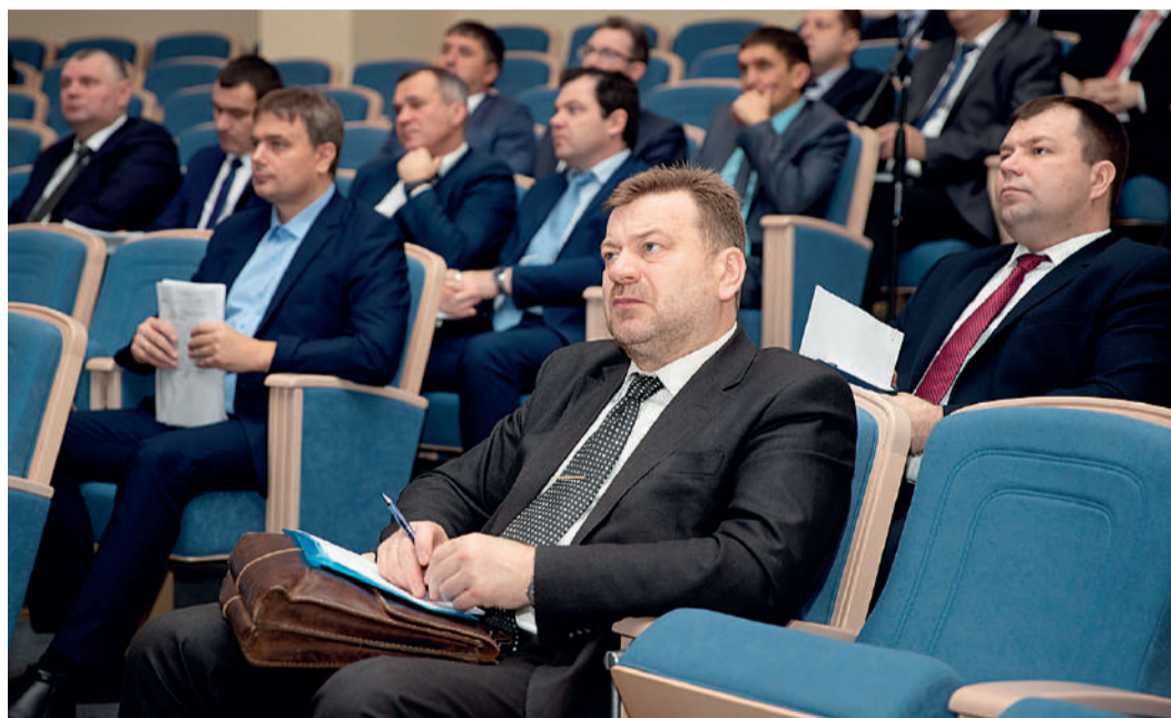
Совещание позволило определить полезные практические наработки и выявить сильные стороны диагностического обеспечения объектов Общества

Система диагностического обслуживания представляет собой комплекс мероприятий по диагностическому обслуживанию, подлежащих проведению на определенных стадиях жизненного цикла объектов газотранспортной системы. В систему также входят взаимосвязанные организационно-технические требования к средствам, исполнителям и объектам технического диагностирования, установлен-