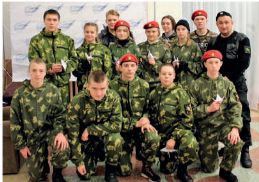
«Дети – наше будущее» от Виталия Ковалева, СКЗ