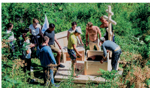
Строительство колодца в с. Ыб волонтерами УАВРА