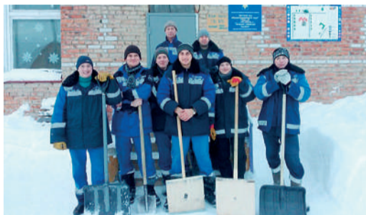
Сосногорское ЛПУМГ ведет активную шефскую деятельность