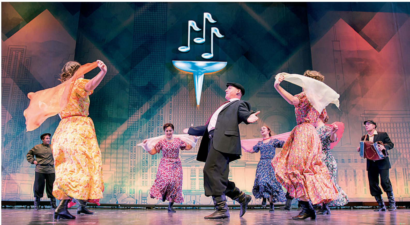
Выступление ансамбля «Русская душа»

Кроме выступлений в конкурсе фестиваля «Факел» прошел концерт «Дети – детям». Это традиционное благотворительное мероприятие, которое организуется для ребят