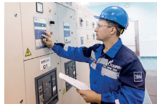
Выполнение ежедневного обхода и осмотра основного и вспомогательного оборудования