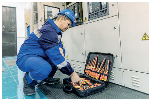
Технический осмотр ячеек ЗРУ 10 кВ