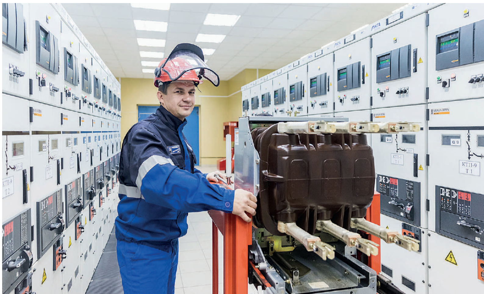
Техническое обслуживание высоковольтного элегазового выключателя

ние со следующей формулировкой: «Техническое обслуживание ячеек закрытого распределительного устройства».