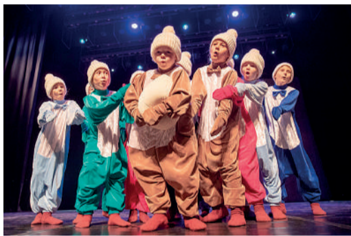
Ансамбль «Елочка» и их зажигательные пингвины