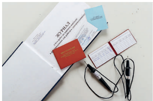
Документы, без которых электромонтер не допускается к работам

ЗАКРЫТЫХ РАСПРЕДЕЛИТЕЛЬНЫХ УСТРОЙСТВ НАПРЯЖЕНИЕМ 10(6) КВ В ОБЩЕСТВЕ