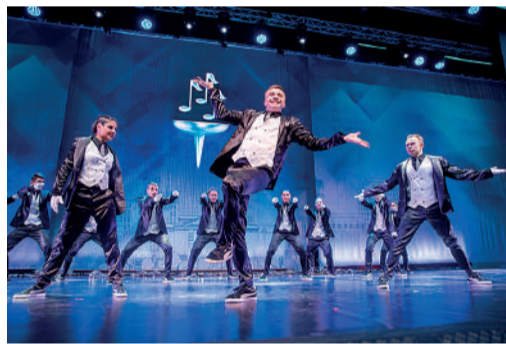
Выступление United Bit закрыло конкурсные дни