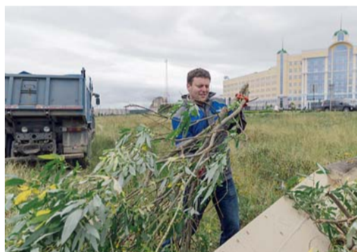
Уборка берегов реки Чибью работниками администрации, г. Ухта