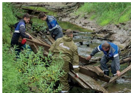
Работники Вуктыльского ЛПУМГ на уборке ручья Подчерем-ель