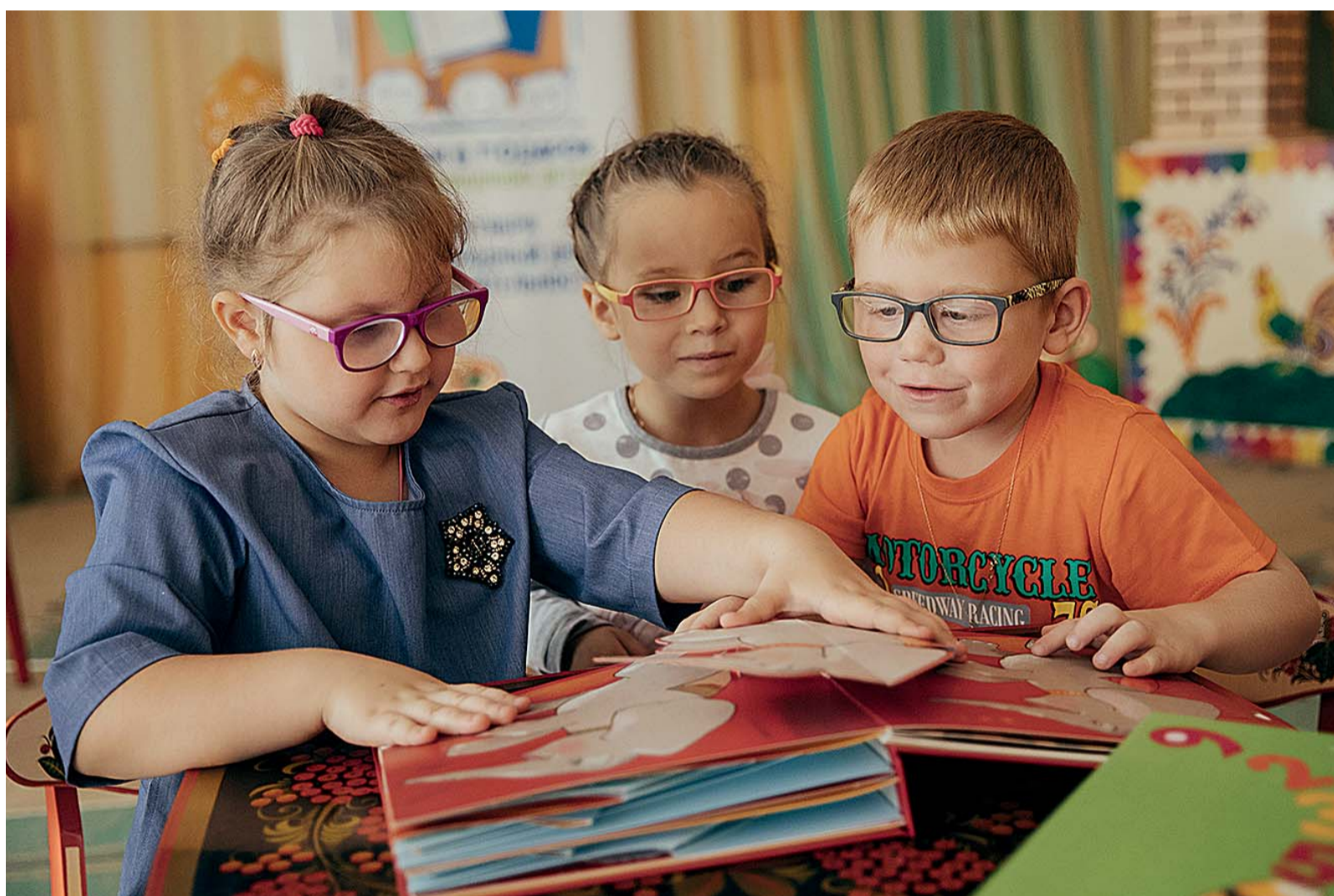
Благотворительная акция в детском саду №60, г. Ухта