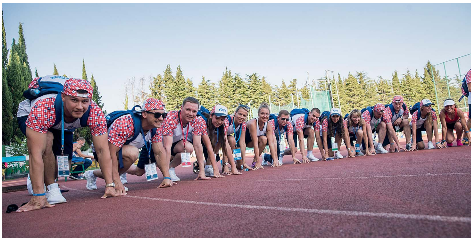
Делегация ООО «Газпром трансгаз Ухта» на летней Спартакиаде ПАО «Газпром»

Второе большое направление – подготовка к участию в Спартакиадах ПАО «Газпром». Акцент на 12 видах спорта: среди летних – это волейбол, гиревой спорт, шахматы, плавание, футбол, легкая атлетика, зимних – лыжные гонки, стрельба, бильярд, мини-футбол, настоль-