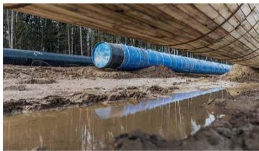
Ширина русловой части реки Шексна в месте подводного перехода — 650 м