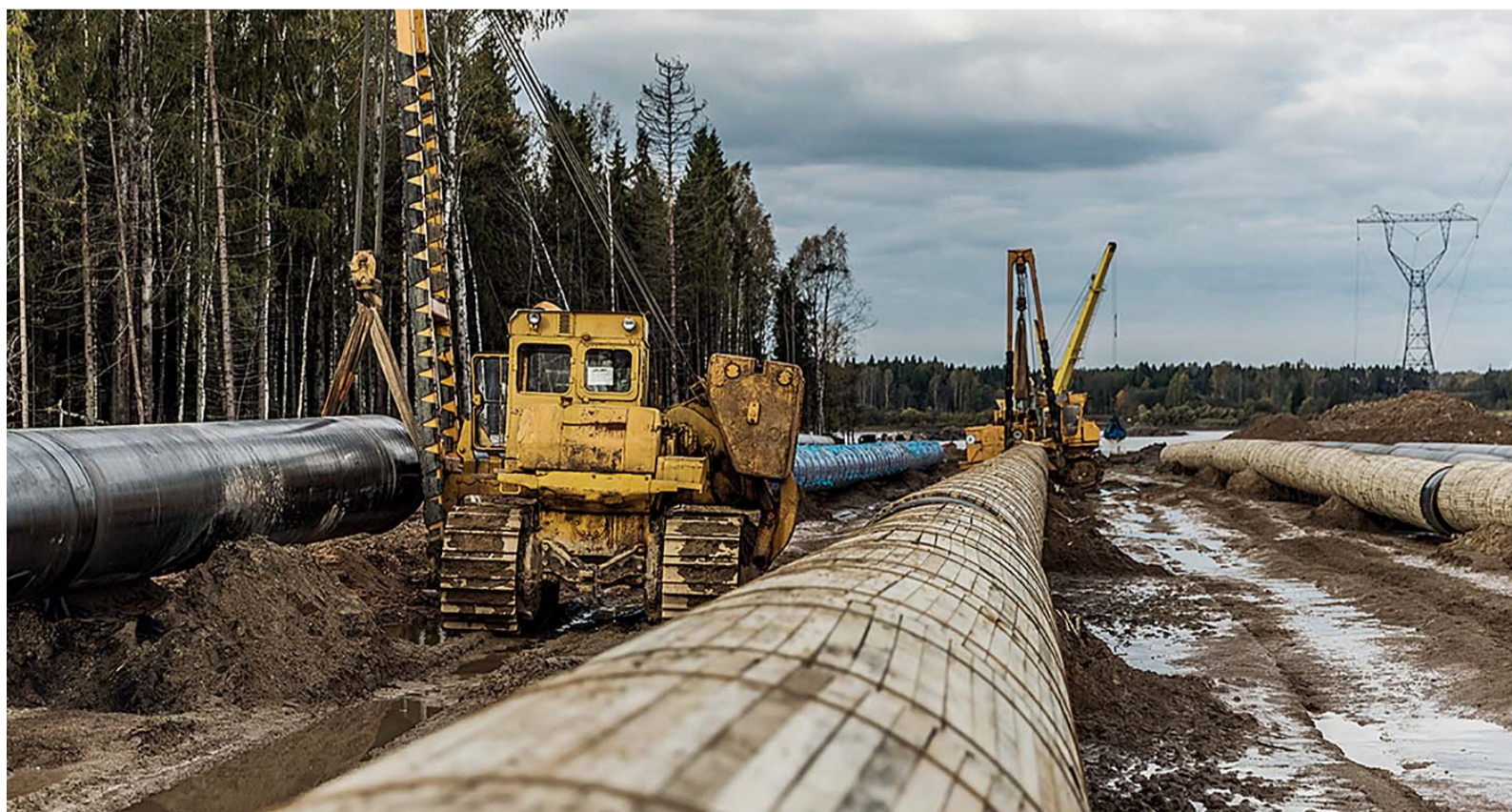
Футеровка (обеспечение защиты поверхностей от возможных механических, термических, физических и химических повреждений) трубопроводов перед установкой утяжелителей