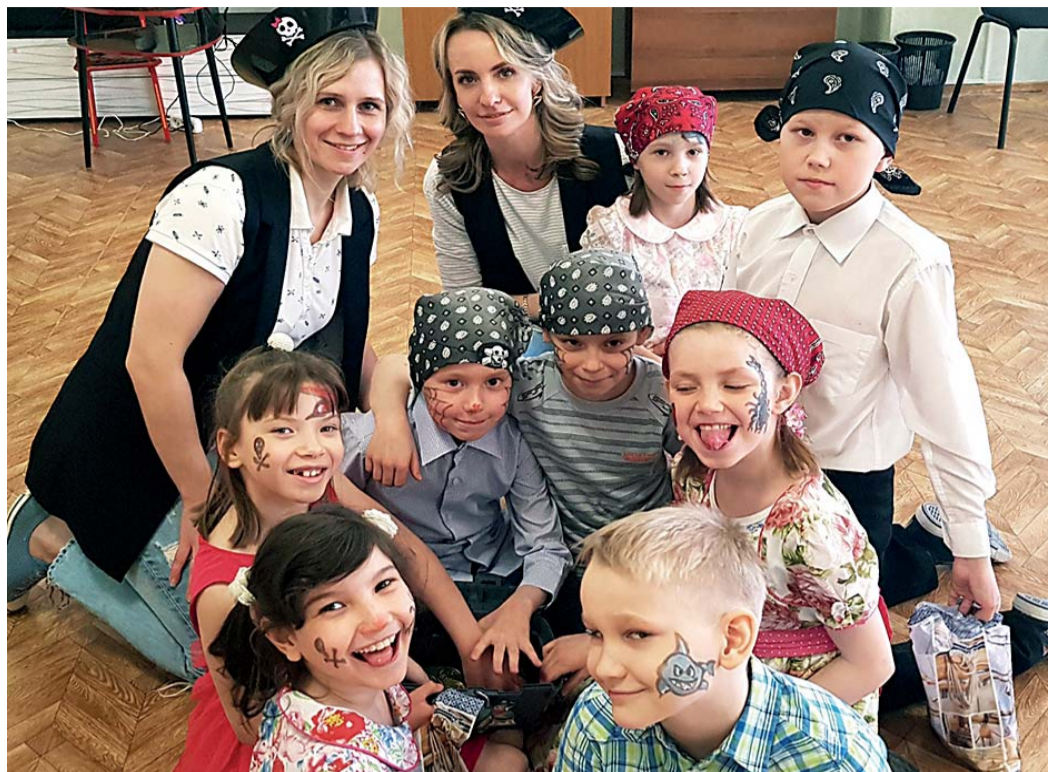
■ День защиты детей в Социально-реабилитационном центре для несовершеннолетних, г. Ухта