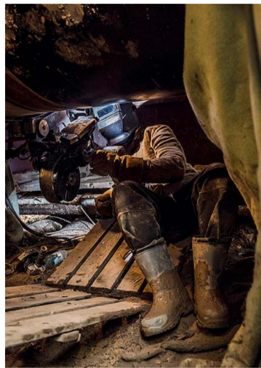
На сварочной установке трудятся два оператора, сварочный комплекс состоит из пяти установок