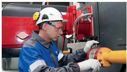
Протяжка запорной арматуры технологического оборудования