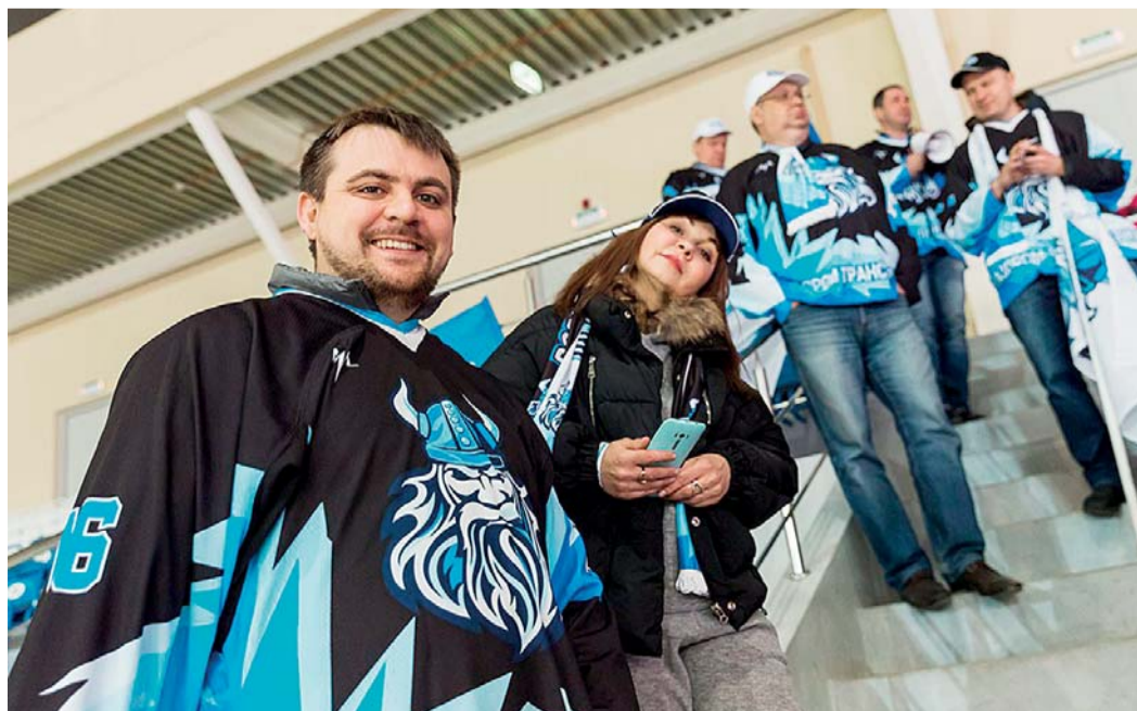
Активность болельщиков с каждым годом растет. Хоккейные болельщики Воркутинского ЛПУМГ