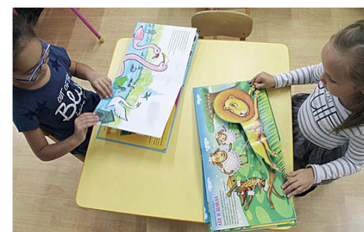
«Начальная школа – детский сад №1», г. Воркута