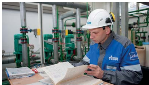
Ознакомление с записями в оперативном журнале

292 ЧИСЛО СЛЕСАРЕЙ-РЕМОНТНИКОВ НА ПРЕДПРИЯТИИ ЧЕЛОВЕКА