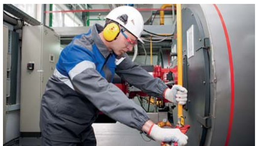
Замена запорной арматуры на технологическом трубопроводе