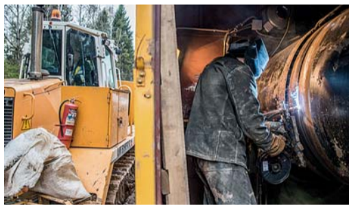
За смену сварочный комплекс способен сварить 35 стыков трубы условным диаметром 1400 мм