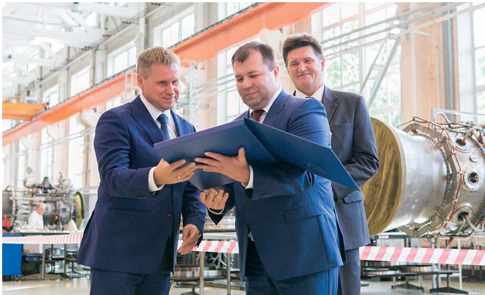
Торжественная церемония вручения сертификата на юбилейную газотурбинную установку

– Для меня большая честь быть сегодня здесь. У нас в эксплуатации находятся 85 пермских двигателей – 1750 МВт установленной