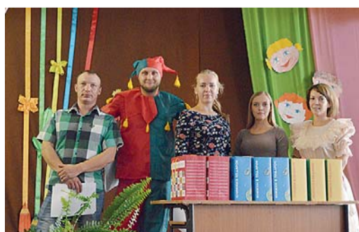
В Грязовецкой школе-интернате для обучающихся с ограниченными возможностями здоровья по зрению