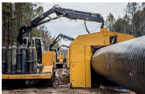
Сварка в нитку газопровода комплексом CRC, 129 км строящегося газопровода