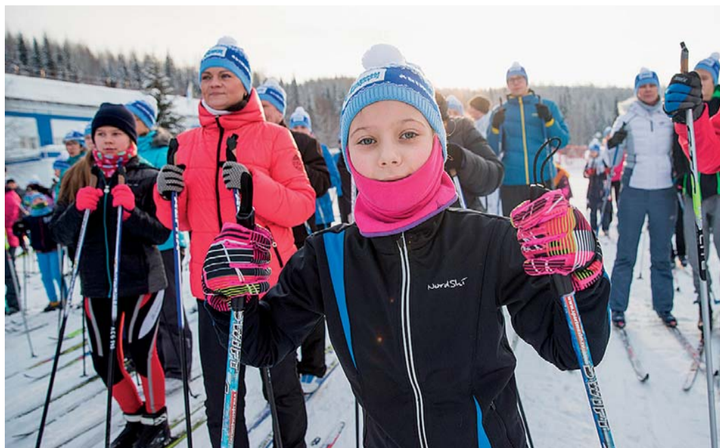
На «Лыжню России» наши работники ежегодно выходят с семьями