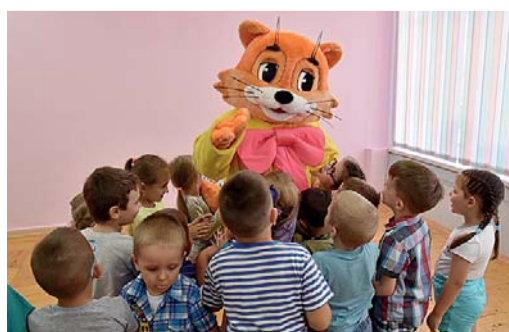
Детский сад №19 компенсирующего вида, г. Инта