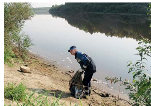
Уборка берегов реки Сухоны работниками Юбилейного ЛПУМГ