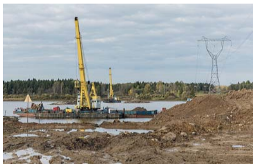
Разработка траншеи подводного перехода через реку Шексна открытым способом. Общая длина перехода — 1132 м