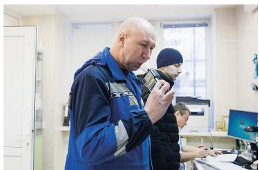
Прохождение теста на алкоголь