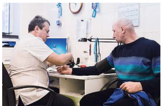
Обязательное медицинское освидетельствование