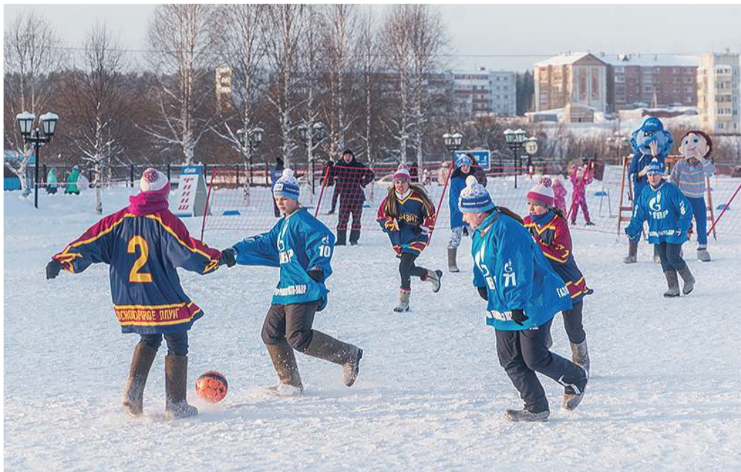
Финальная встреча по валенкоболу между командами УАВР и Сосногорского ЛПУМГ