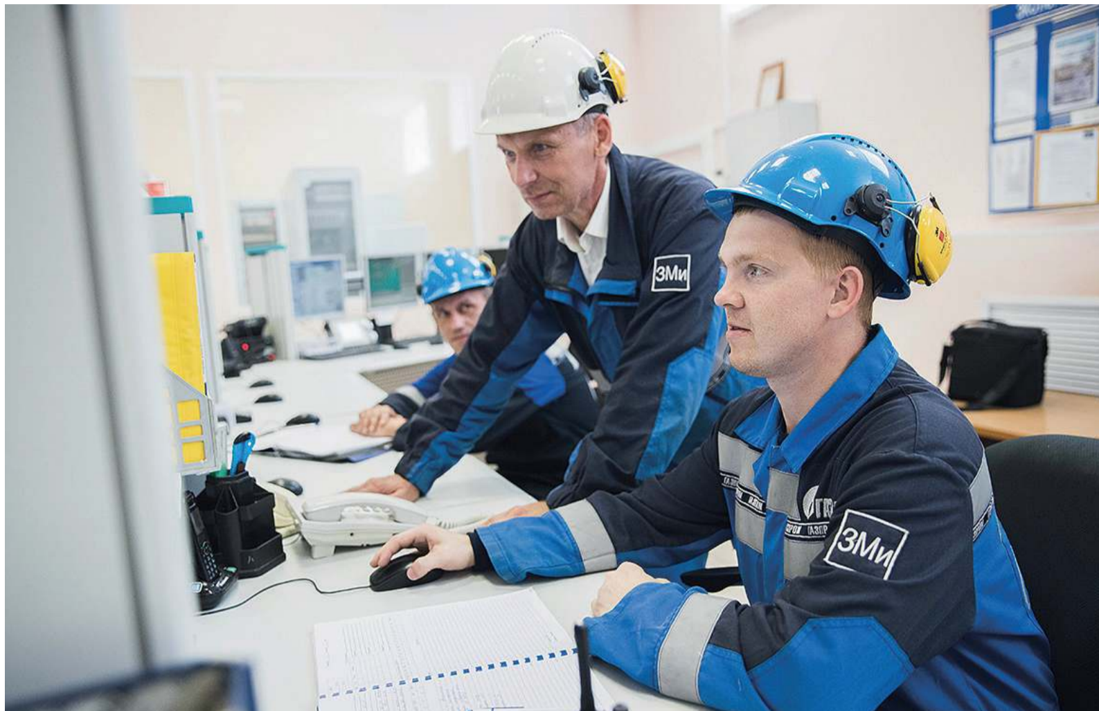
В операторной Грязовецкого ЛПУМГ

Сегодня филиал продолжает работу, начатую в начале 2000 годов, когда в ЛПУМГ были осуществлены масштабные по значимости проекты: строительство газопроводной системы «СРТО-Торжок», в 2008 году ввод в эксплуатацию КЦ№5 КС «Новогрязовецкая», газопровода-отвода на город Галич, в 2010-2011 годах были выполнены реконструкции КЦ № 3бис, 4 с установкой более мощных и энергоэффективных газоперекачивающих