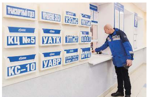
Получение путевого листа

168 ЕДИНИЦ ТРАНСПОРТА И СПЕЦИАЛЬНОЙ ТЕХНИКИ НА КПГ