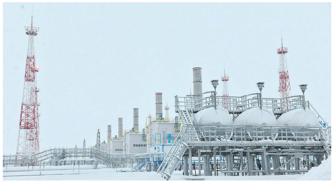
Бованенковское газоконденсатное месторождение

В истории экспорта российского трубопроводного газа мы с вами открываем новую страницу. 20 декабря 2019 года впервые начнем поставки в Китай — на самый перспективный