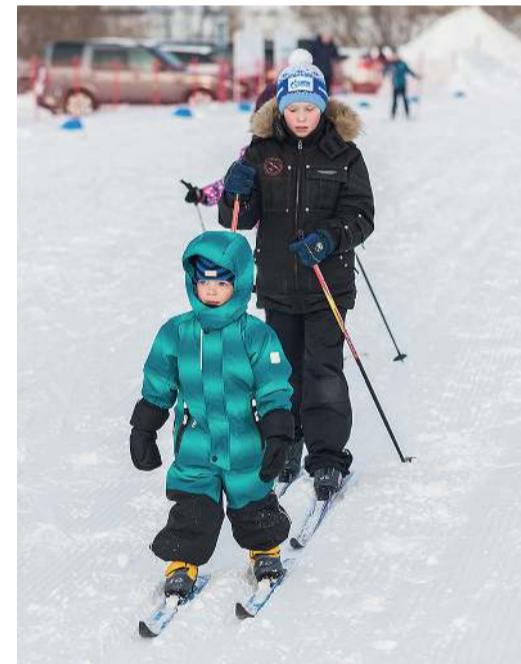
Юные лыжники тоже поддержали мероприятие