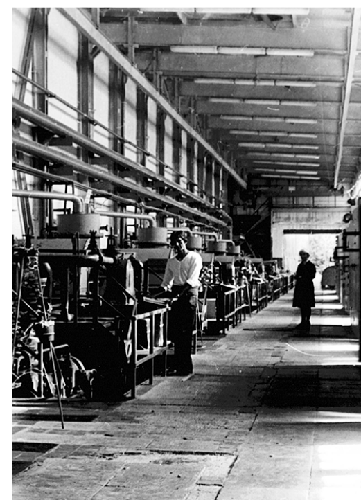
Компрессорный цех № 1, машинный зал, 1982