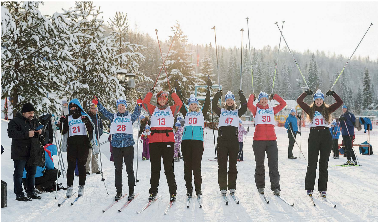
На старте трехкилометровой дистанции