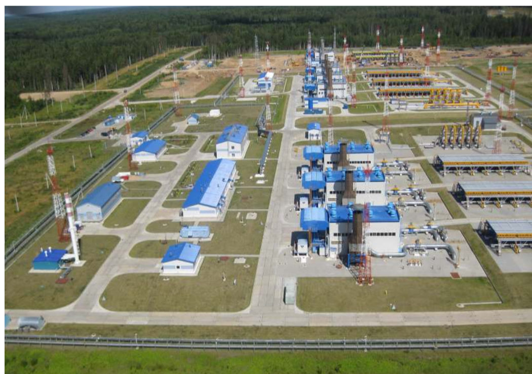
5, 6 и 7 цеха Грязовецкого ЛПУМГ

А. Григорьева, Д. Майорова