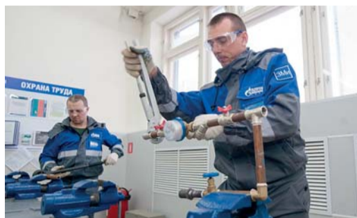
ЗНАЙ НАШИХ! Лучшие в своём деле