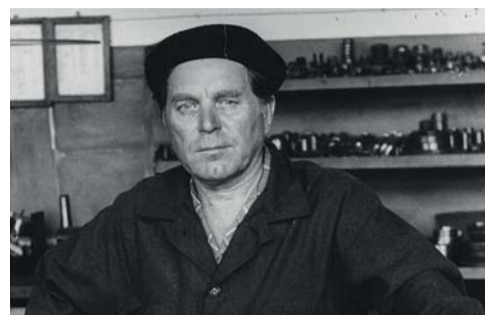
ОТКРЫТЫЙ АРХИВ «Вспомогательная» работа