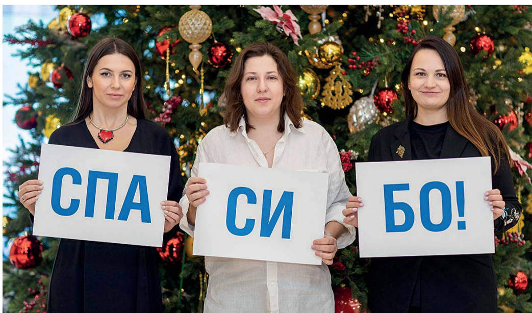
С благодарностью, ваша редакция

Когда нам непросто отыскать информацию, сформулировать сложный производственный