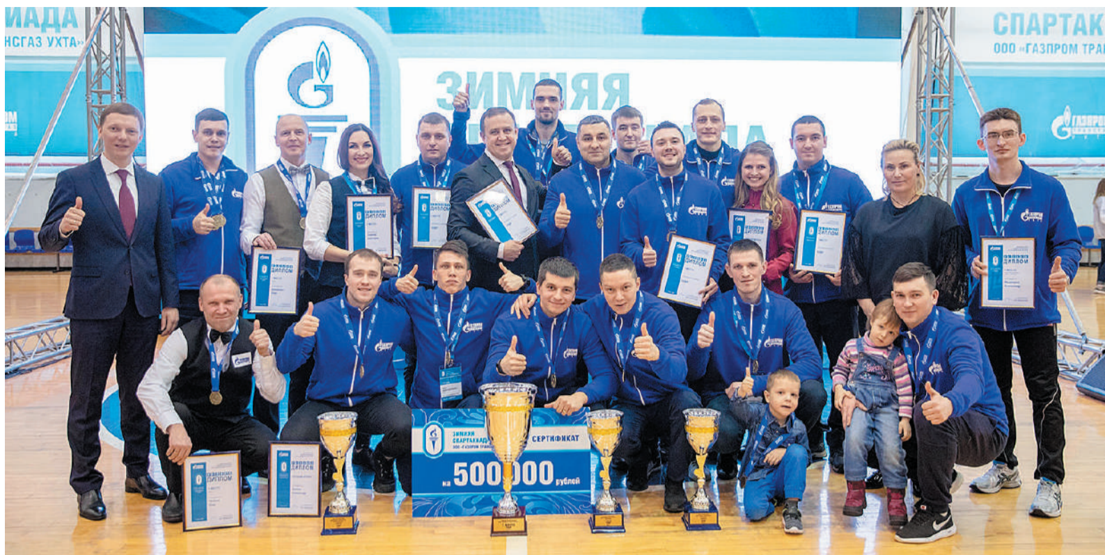
Победители зимней Спартакиады

Д. Майорова, фото М. Сиваковой, Е. Жданова