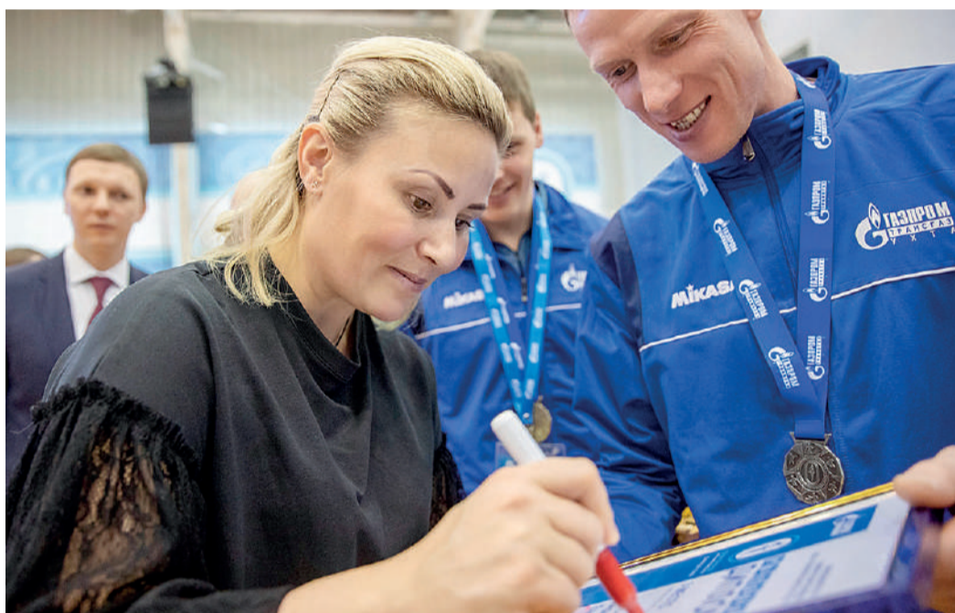
Визит трёхкратной олимпийской чемпионки, двукратной чемпионки мира Юлии Чепаловой стал настоящим подарком для спортсменов