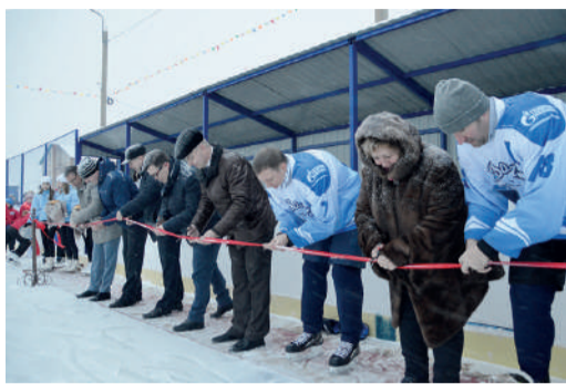
Торжественная церемония открытия

Три раза в неделю тренируется местная команда «Волгарь», которая является регулярным участником турнира по хоккею с шайбой на Кубок генерального директора нашего предприятия. За последние годы хоккеисты добились больших успехов, это доказывают призовые места в турнирах, организованных муниципальными образованиями Ярославской области. В 2020 году, в год 75-летия Великой Победы, на базе спортивного объекта пройдет турнир на кубок Мышкинского ЛПУМГ среди любительских хоккейных команд всего региона.