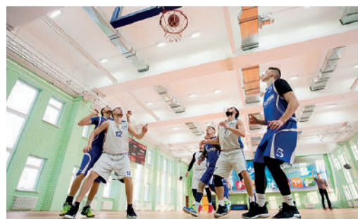
Шекснинское ЛПУМГ против Синдорского ЛПУМГ