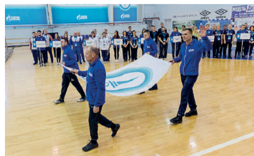
ВОКРУГ СПОРТА Чемпионы зимней Спартакиады