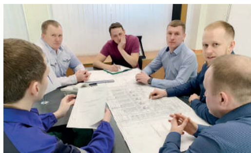
СЛОВО ИНЖЕНЕРУ Успехи технического творчества