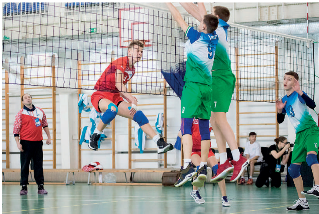
Финальные игры по волейболу среди юношеских команд