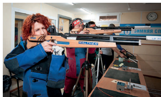
Участники на огневом рубеже