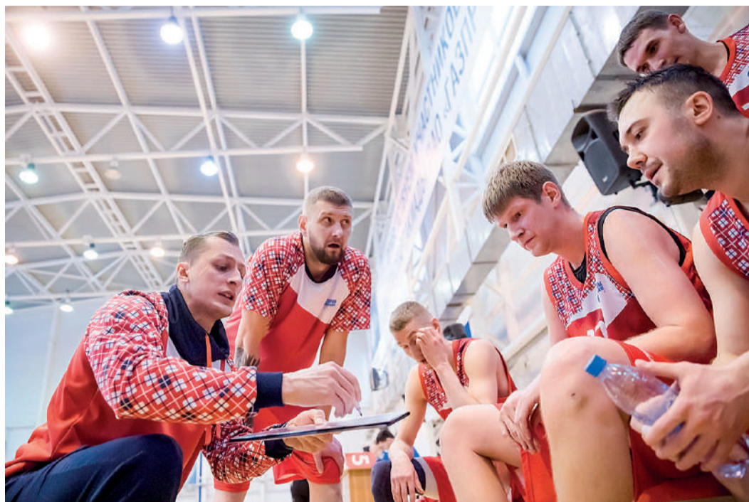
Команда баскетболистов во время тайм-аута