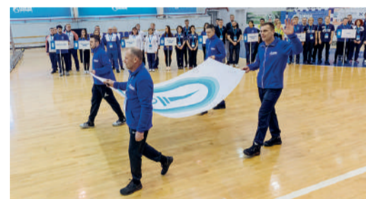
Флаг Спартакиады традиционно поднимают лучшие спортсмены