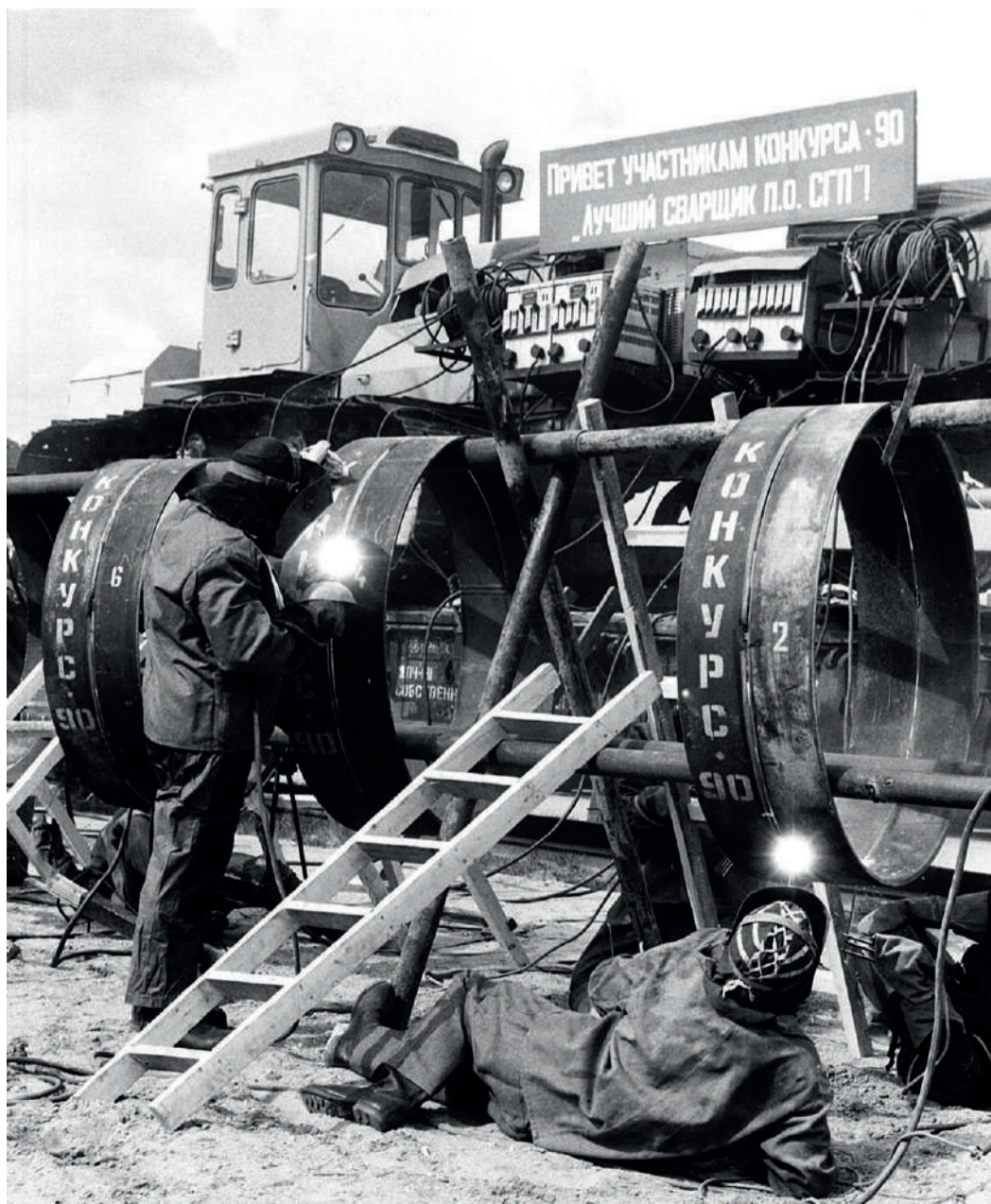
Конкурс сварщиков, 1990 г