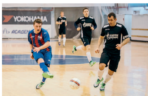
Футбольный матч между командами Воркутинского ЛПУМГ и Микуньского ЛПУМГ