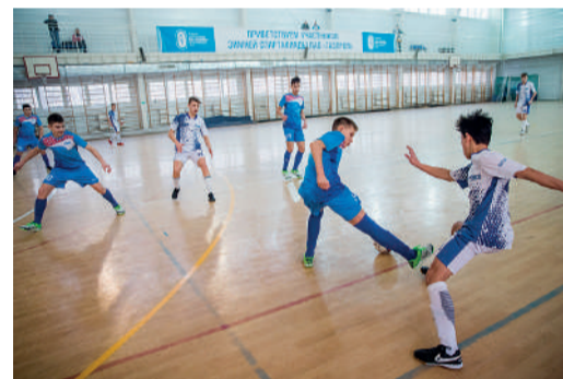
Юные футболисты делегации нашего предприятия