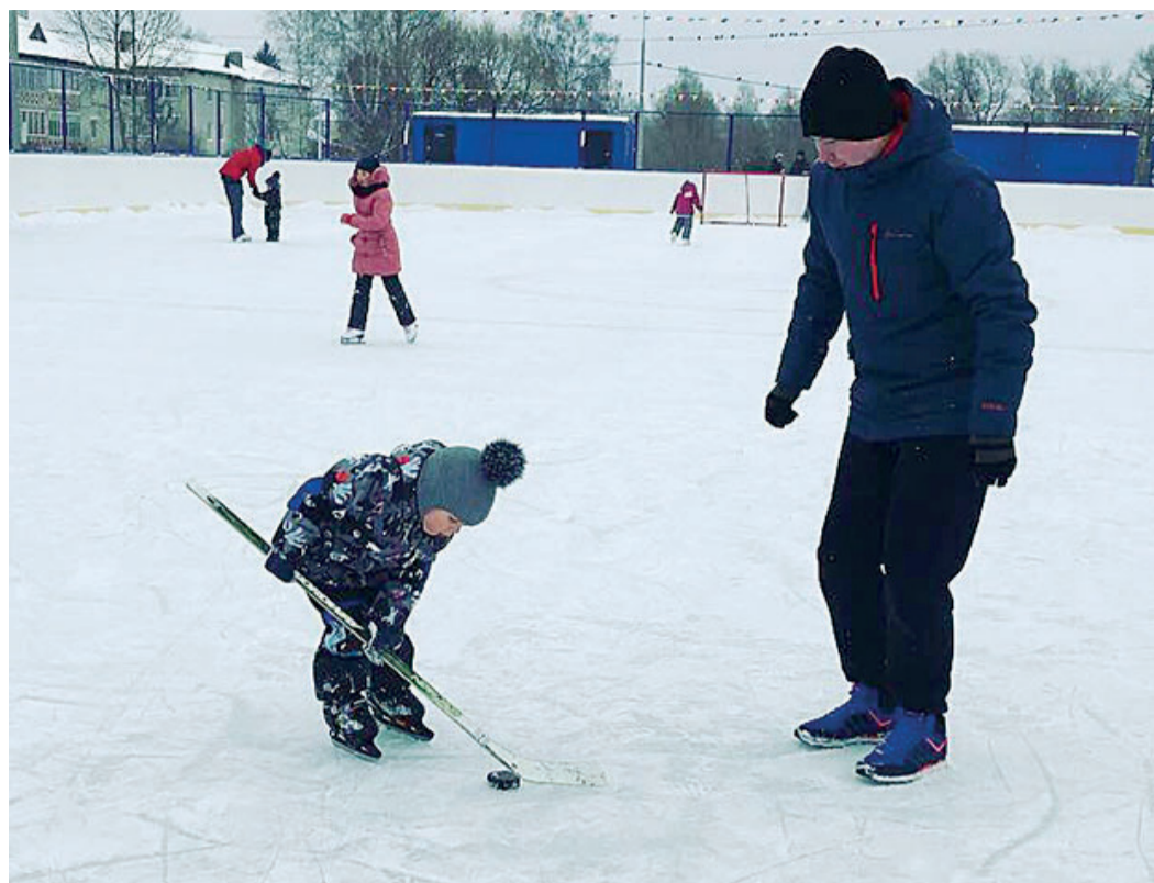
Тренировки на новом катке уже начались