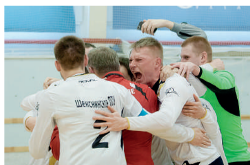
Радость победы футболистов Шекснинского ЛПУМГ