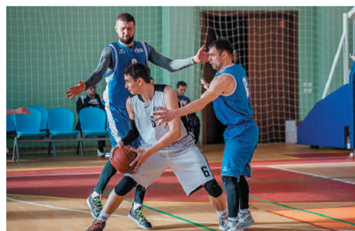
Баскетбольный матч между командами Приводинского ЛПУМГ и Воркутинского ЛПУМГ