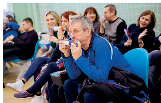
Одни из самых громких болельщиков Спартакиады – работники УМТСиК