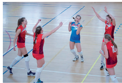
Момент триумфа на волейбольной площадке