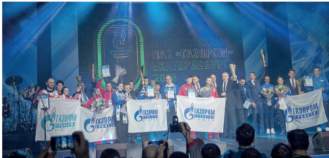
Делегация нашего предприятия получила спецприз «За активную поддержку корпоративного спорта на зимней Спартакиаде ПАО «Газпром»