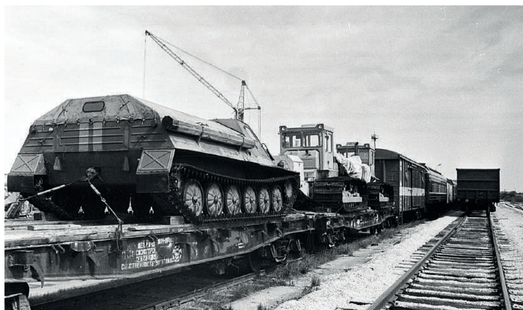
Железнодорожный состав аварийно-восстановительного поезда (многоцелевой тягач лёгкий бронированный)

– Для выполнения работ по устранению аварий и их последствий, а так же для проведения комплексов ремонтных работ, филиал оснащен всем необходимым оборудованием и специальной техникой. Ежегодное увеличение объемов работ на объектах газотранспортной системы Общества, а также запланированное строительство и ввод новых мощностей, дают нам право с уверенностью смотреть в будущее и говорить о дальнейшем развитии Управления. Опираясь на опыт и профессионализм коллектива, могу с уверенностью сказать, что мы всегда готовы к выполнению поставленных перед филиалом задач!