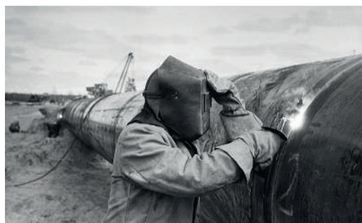
ЮБИЛЕЙ УАВР отмечает юбилей