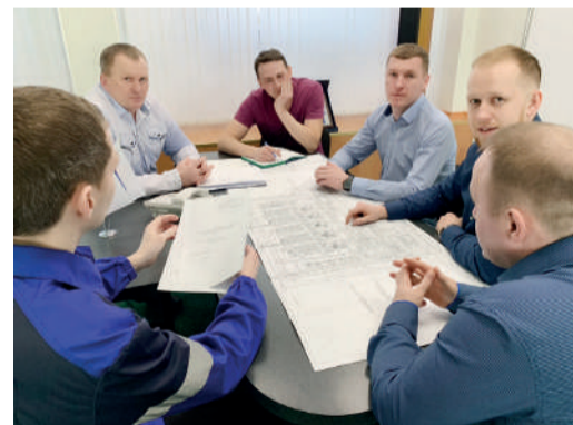
Команда рационализаторов Урдомского ЛПУМГ

Всего в 2018 году Обществом подано 25 заявлений на выдачу патентов РФ на изобретения и полезные модели. По итогам рас-