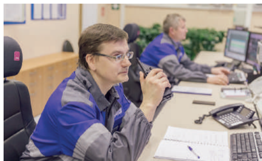
КОМАНДА ПРОФЕССИОНАЛОВ Когда каждую минуту рука на пульсе