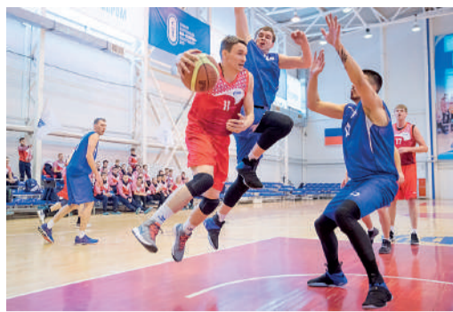
Победа над гравитацией