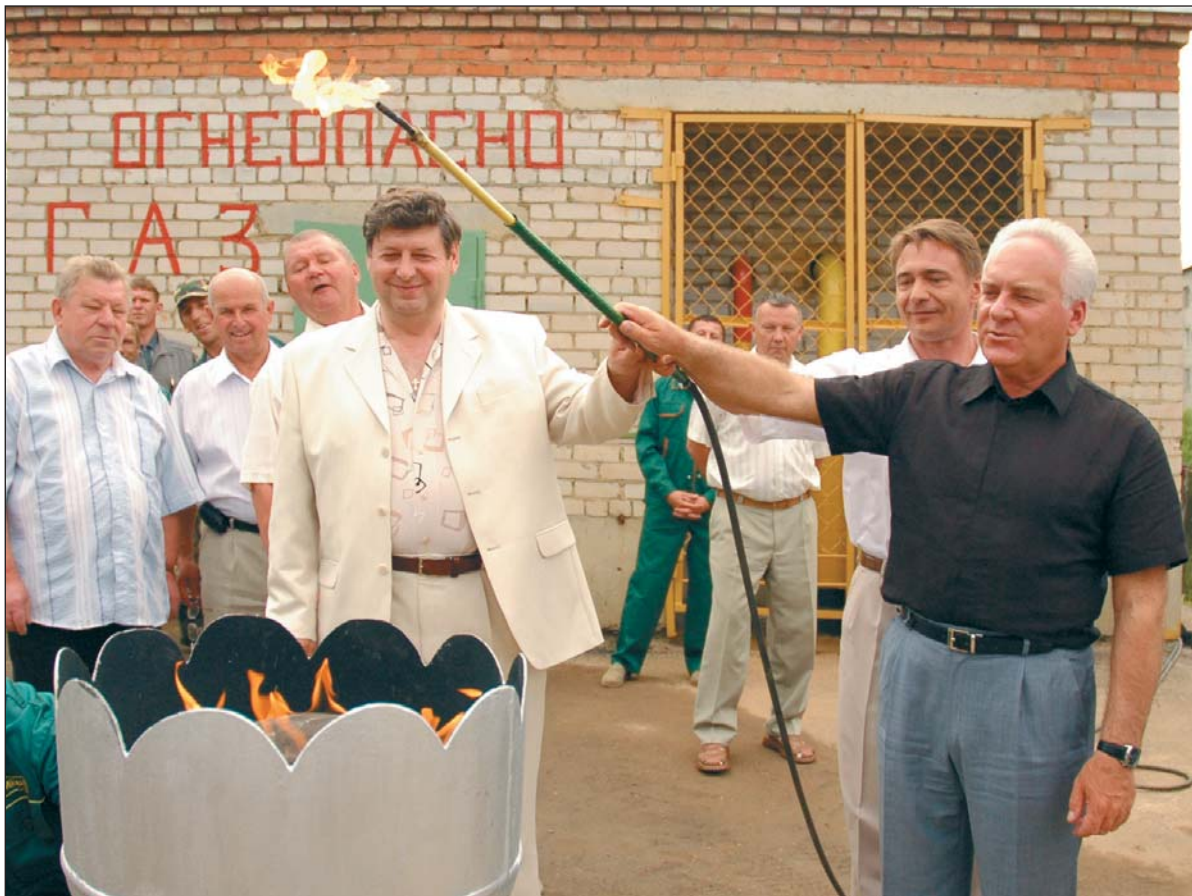
Пока голубому огоньку в своих кухнях радуются хозяйки лишь двух многоквартирных домов Большого Села. Но уже построены новые котельные. Дело — за разводящими сетями. Теперь у старинного райцентра появились новые перспективы. Голубое топливо избавит район от необходимости закупки дорогого мазута.