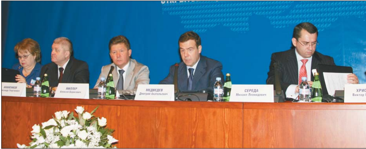
ПРОДОЛЖЕНИЕ, НАЧАЛО НА 1 стр.