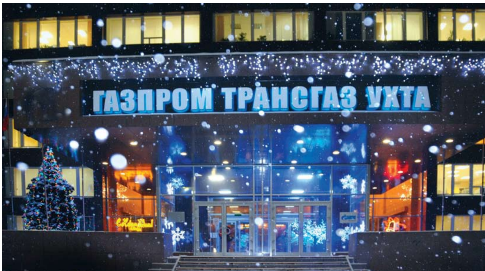
«Газпром трансгаз Ухта» в праздничном убранстве.