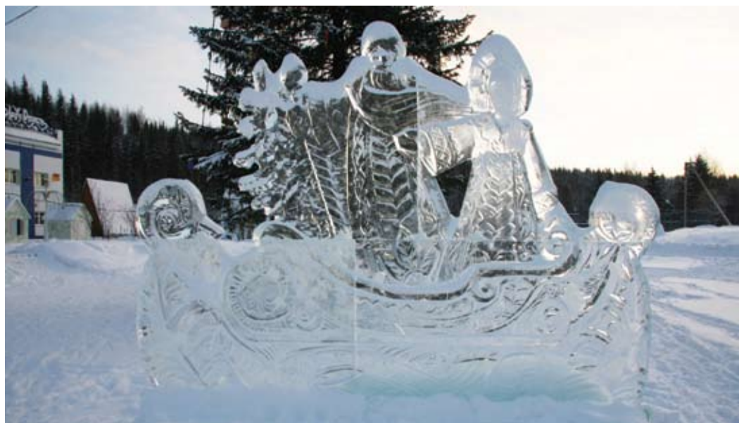
На лыжной базе в Ухте.