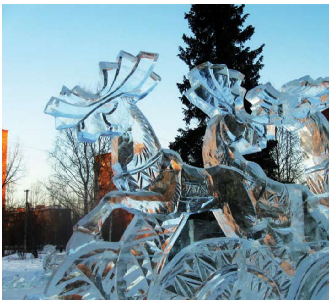
Ухта новогодняя.

Мы поздравляем всех коллег «Газпром трансгаз Ухта» И в Новый год желаем всем, Здоровья, счастья и добра!