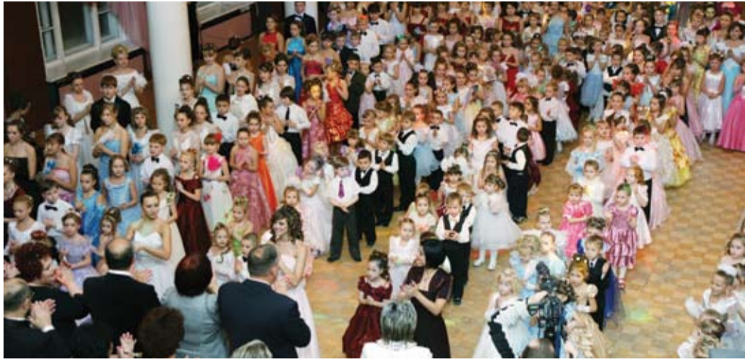
«Бал Снежной королевы» в Доме творчества юных г. Воркуты.

Не за горами Новый 2010 год. Уже зажглись первые огоньки на елках... И, как обычно, в преддверии Нового года принято, оглядываясь назад, подводить итоги и строить планы, заглядывая в будущее.