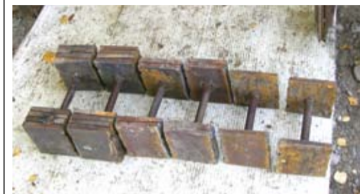
Вот такие гантели!

Когда такой вопрос возник перед инженерами по технадзору Печорского ЛПУ на участке Кожим - СМГ «Бованенково-Ухта», они подошли к решению основательно – сделали ставку на спорт. Взяли и сымпровизировали себе спортзал. Немного странно видеть его