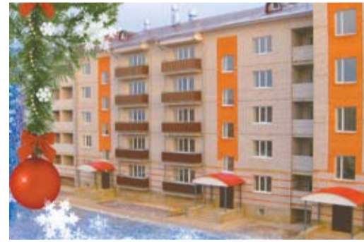
Дом с нетерпением ждет, К встрече жильцов готов! Улица дальше растет — Улица Газовиков!

В городе Мышкине, на улице Газовиков, для работников Мышкинского ЛПУ МГ построено общежитие квартирного типа, состоящее из двух пятиэтажных корпусов. Уже внешний вид самого здания говорит о том, что это самый красивый дом в городе.