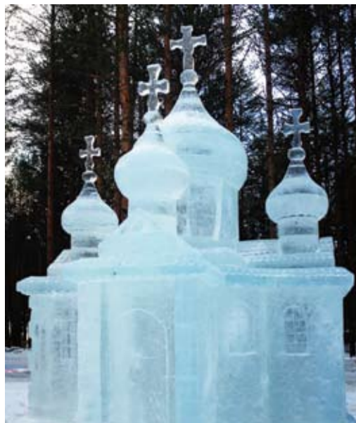
Ледяной храм в вотчине Деда Мороза