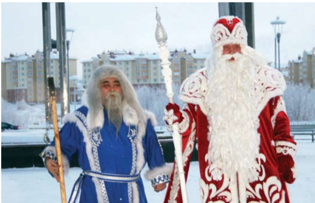
Ямал Ири - коллега Деда Мороза

В 2007 году на Ямале появился собственный Дед Мороз – Ямал Ири (в переводе с ненецкого языка – Дедушка Ямала), который с радостью встречает гостей в своей резиденции, дарит замечательные подарки, потчует сладкими угощениями, исполняет желания.