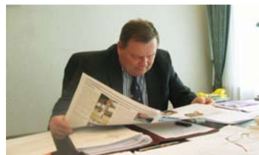
... и в Шексне