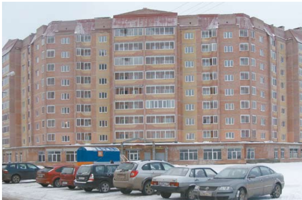
В ожидании новоселов

В планируемый до 2012 года период особое внимание уделяется строительству жилья для специалистов, которые будут работать на Бованенковском газопроводе. Жилые дома строятся или начаты проектированием во всех населенных пунктах, где находятся ЛПУ.