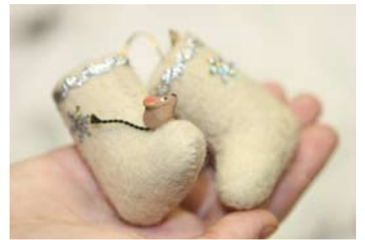
Валенки: мышкинские или мышкины?