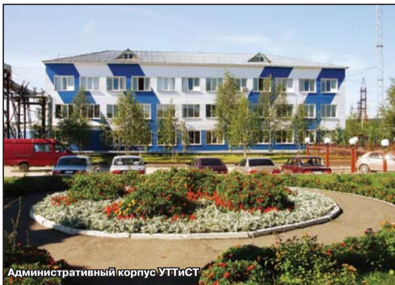
Административный корпус УТТиСТ

Все количественные показатели природоохранной деятельности должны были характеризовать объем произведенной работы на местах и достигнутый результат. Акцент сделан и на функционировании в филиалах Системы экологического менеджмента: организации этой работы, участия производственных цехов, служб, участков, руководства филиалов. При подведении итогов