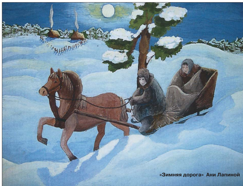
«Зимняя дорога» Ани Лапиной