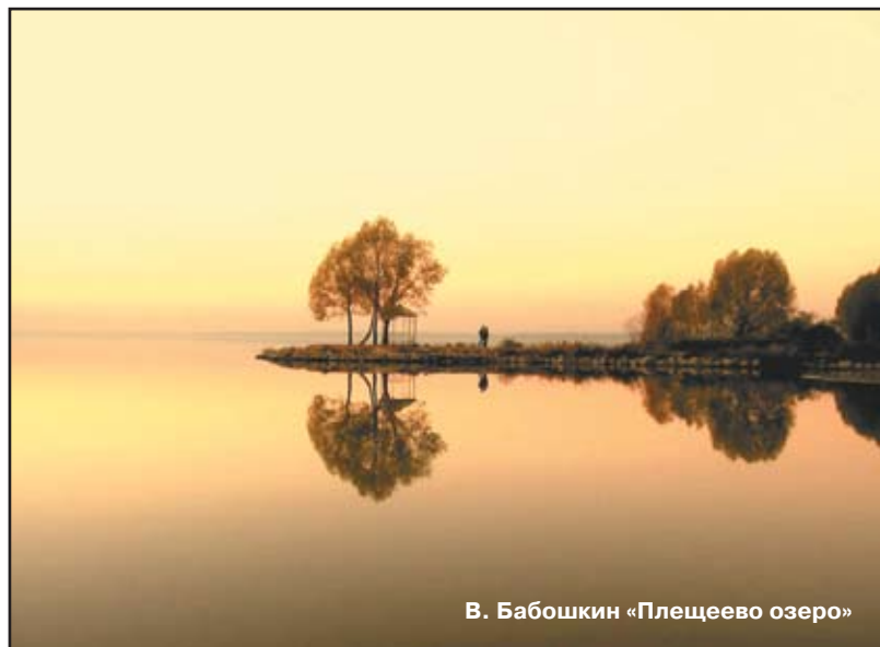
В. Бабошкин «Плещеево озеро»