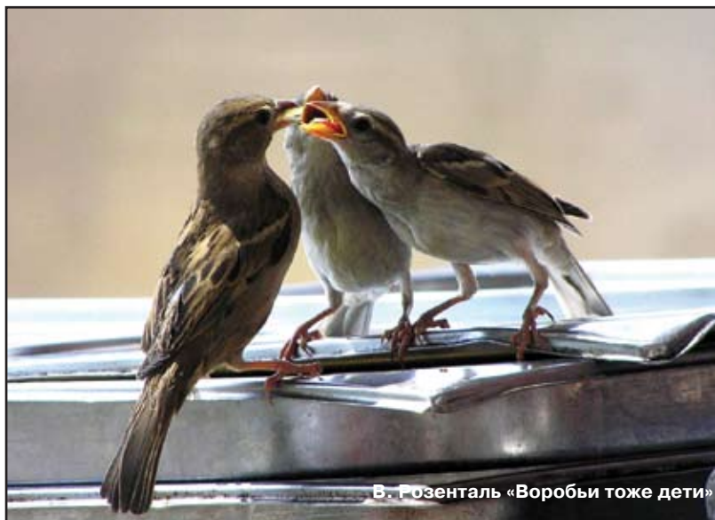
В. Розенталь «Воробы тоже дети»