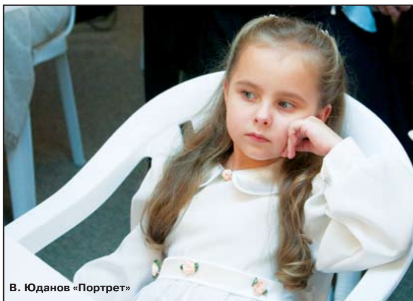
В. Юданов «Портрет»