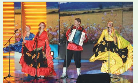
Народный коллектив вокальный ансамбль «Россиюшка»

Третий заключительный тур фестиваля пройдет в мае 2007 года в городе Геленджик. ООО «Севергазпром» будут представлять со-