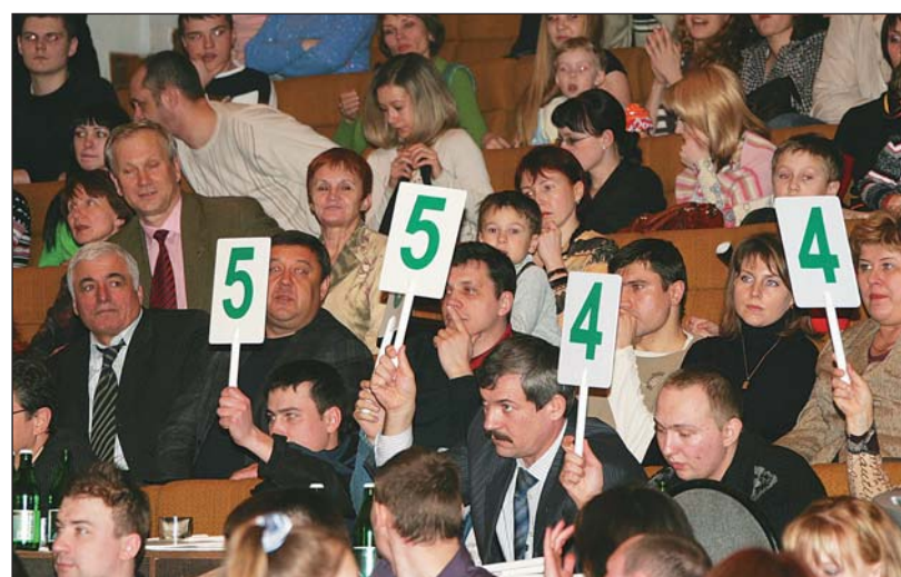
Напряженная работа жюри

В КВНе 70-80-х годов было много импровизации, а современный похож на постановочное шоу. Это объясняется просто: спрос диктует предложение. Команды постепенно