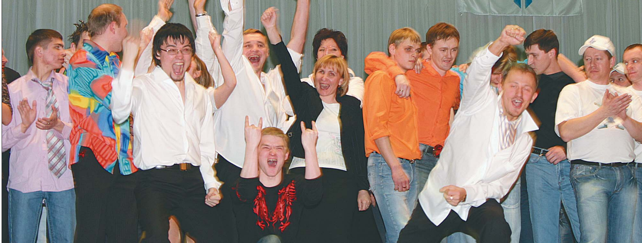
«Прямой номер» ПТУС «Севергазсвязь»