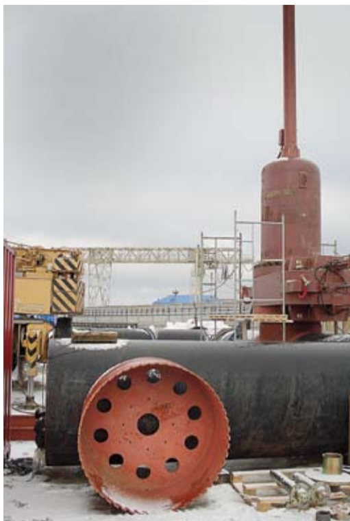
Фреза диам. 1400 мм