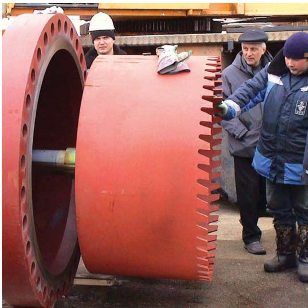
Режущий инструмент в сборе, готов к монтажу на место врезки