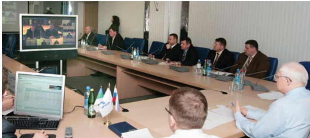
В режиме реального времени.

28 апреля в зале заседаний центрального офиса ООО «Газпром трансгаз Ухта» состоялось селекторное совещание по теме «Подготовка подразделений Общества к прохождению весеннего паводка». Совещание, в котором принимали участие все филиалы Общества, впервые проводилось в режиме видеоконференции. Отныне такая форма проведения совещаний станет традиционной. Подробности - в следующем номере нашей газеты. ■