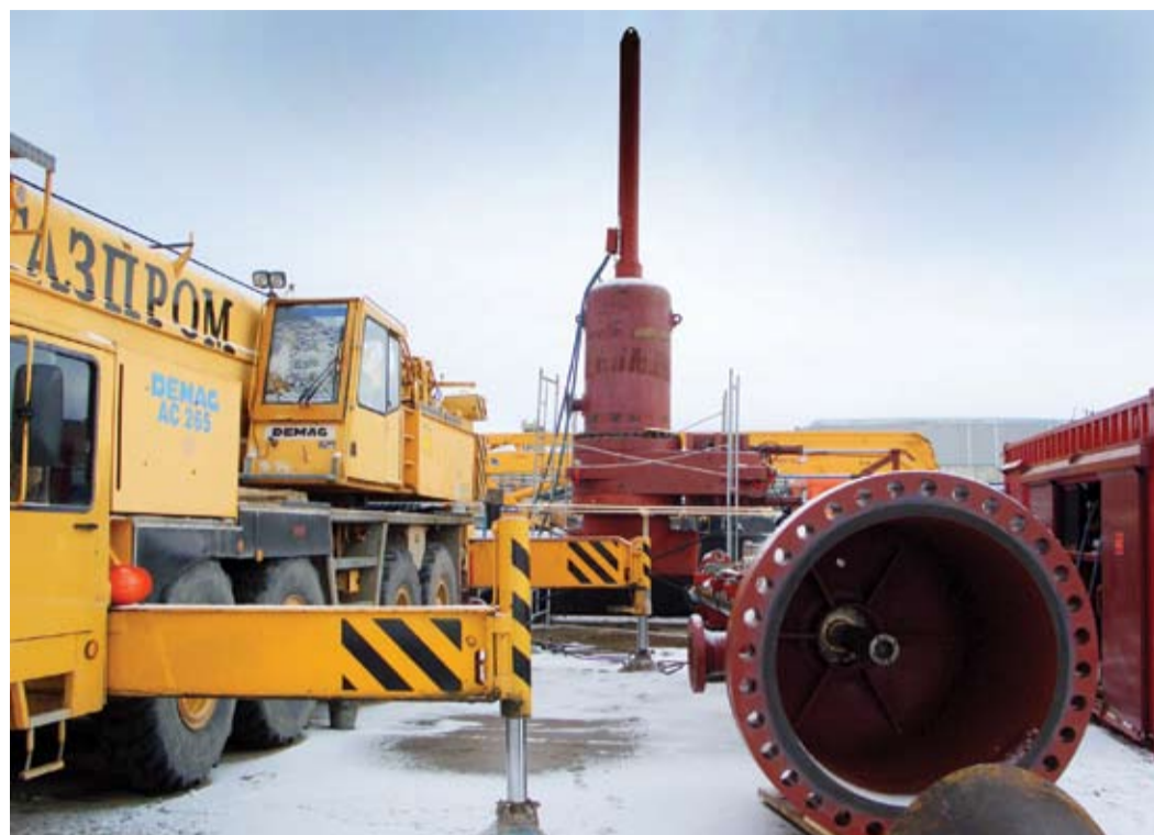
«Стопл» в установленном виде. На переднем плане - привод фрезы диам.1400 мм