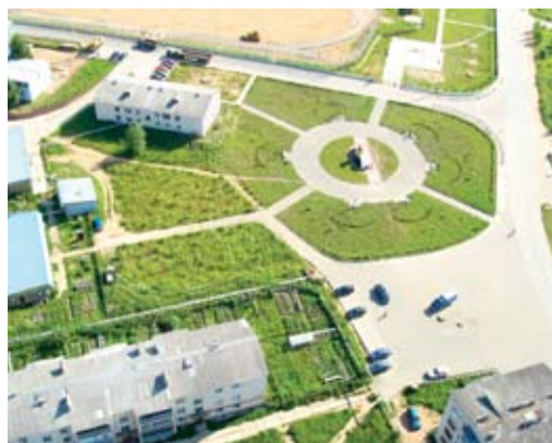
Сквер с высоты птичьего полета

Теперь маленький скверик наполняет простотой каким-то большим радостным чувством, безграничным оптимизмом, когда