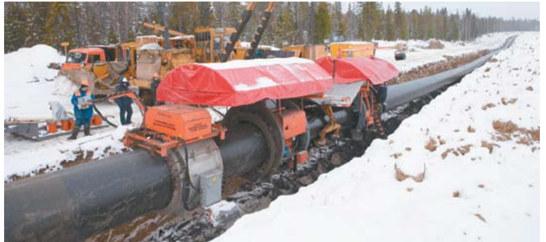
Работы по переизоляции, Вуктыльское ЛПУМГ

Для качественного нанесения изоляционного покрытия на магистральный газопровод необходим подогрев трубы. На подогретую трубу накладывают праймер, мастику, армирующую сетку и обертку.