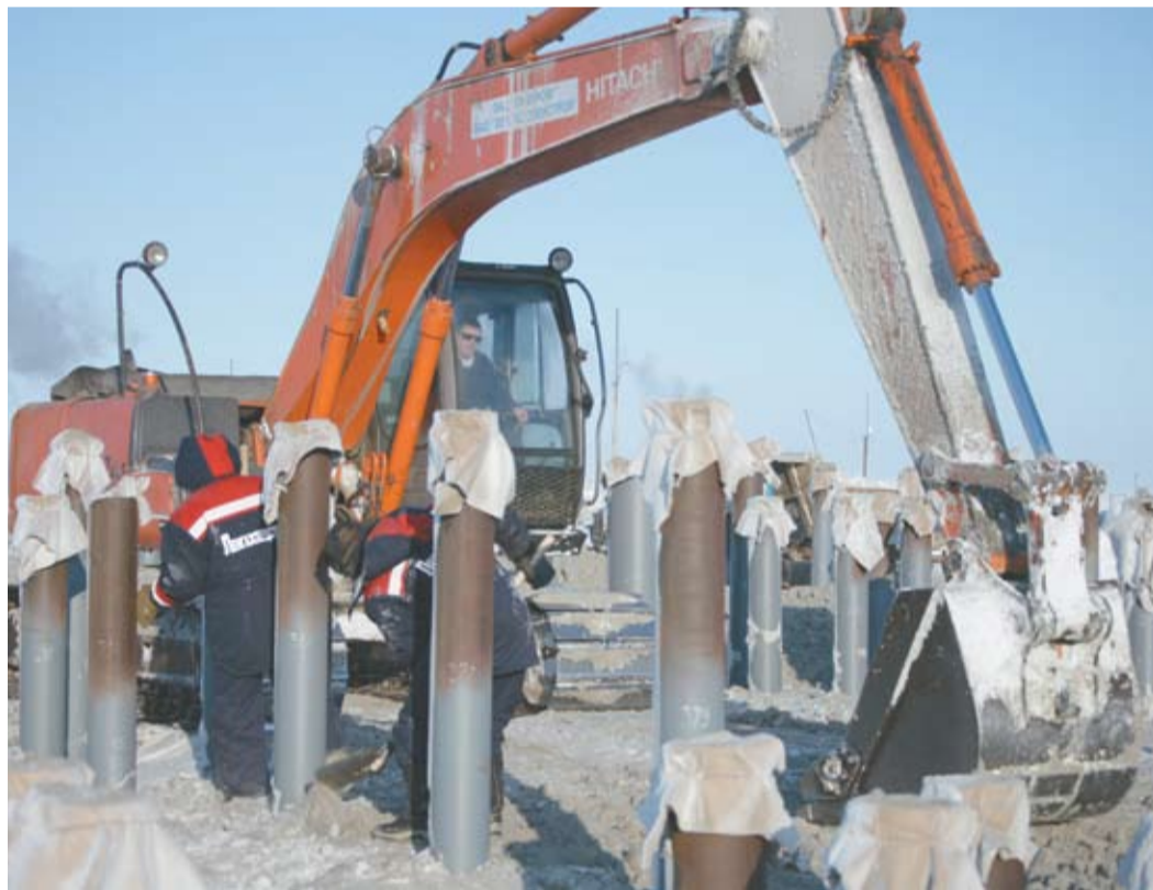
На стройплощадке КС «Байдарацкая»