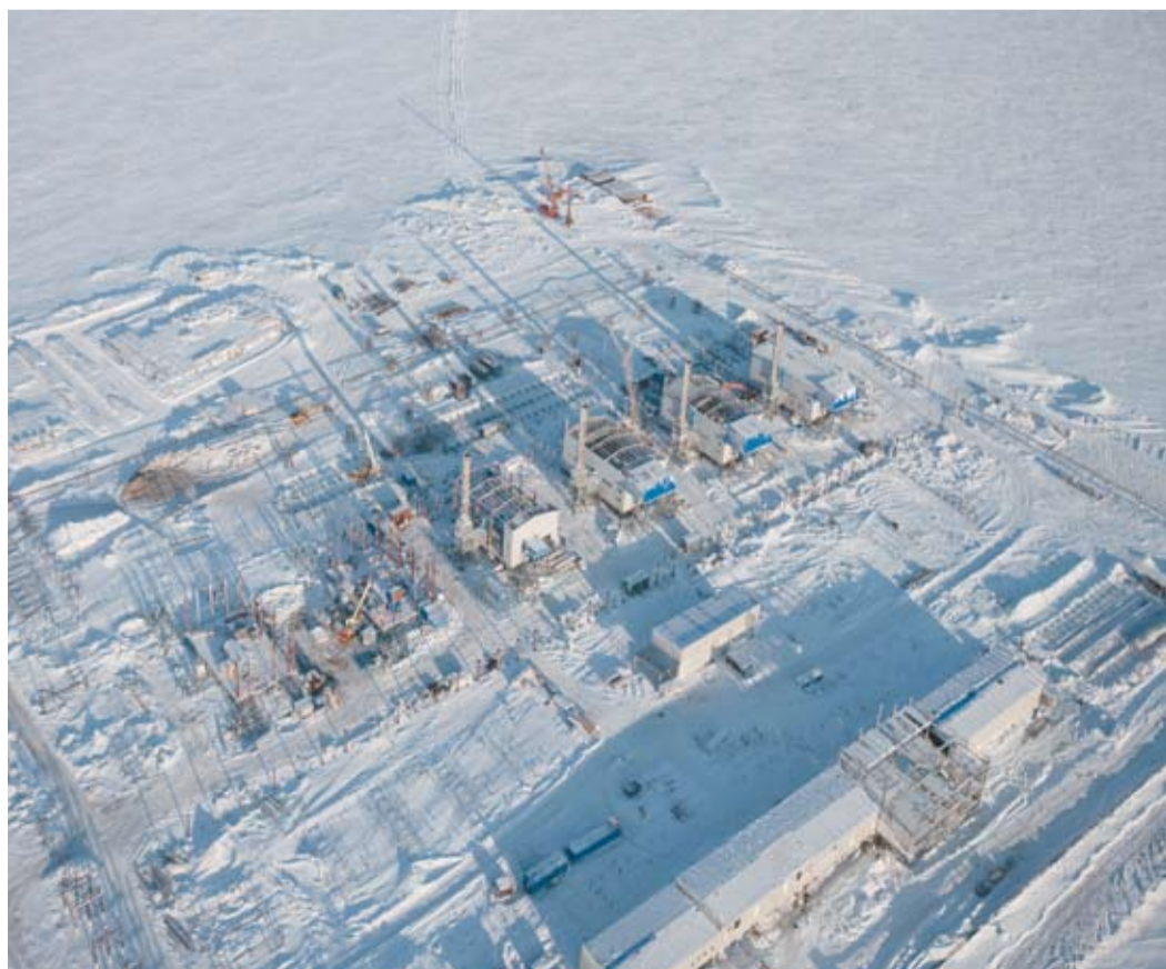
КС «Байдарацкая» с высоты птичьего полета