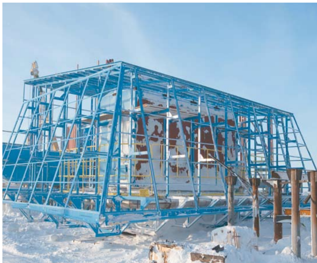
На стройплощадке КС «Байдарацкая»