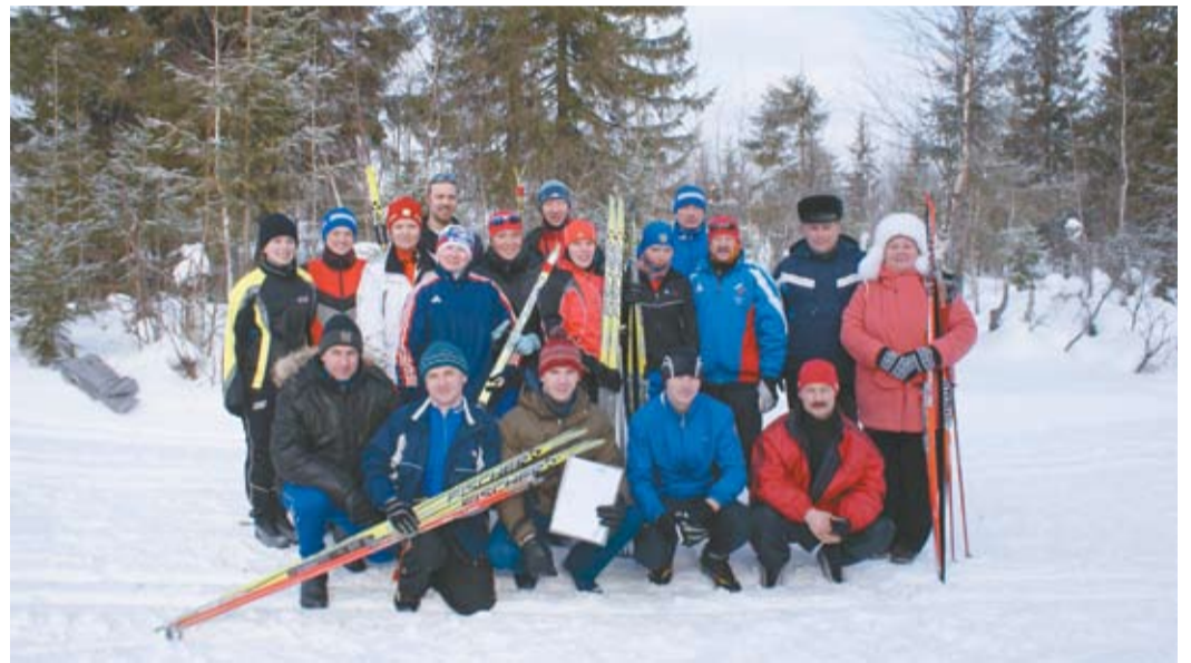
Завершая лыжный сезон