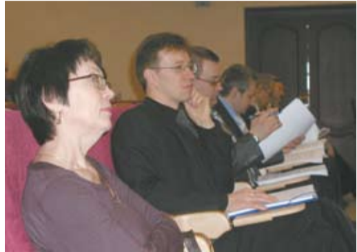
ИСМ - это важно!

В течение трех дней в актовом зале шел заинтересованный разговор о роли систем менеджмента в стратегическом развитии предприятия. Обсуждались различные аспекты построения интегрированных систем (ИСМ). Обучение вели ведущие преподаватели Академии стандартизации метрологии и сертификации. По окончании четырехдневной учебы была проведена аттестация участников семинара, по итогам которой все слушатели учебного курса получили сертификаты государственного образца,