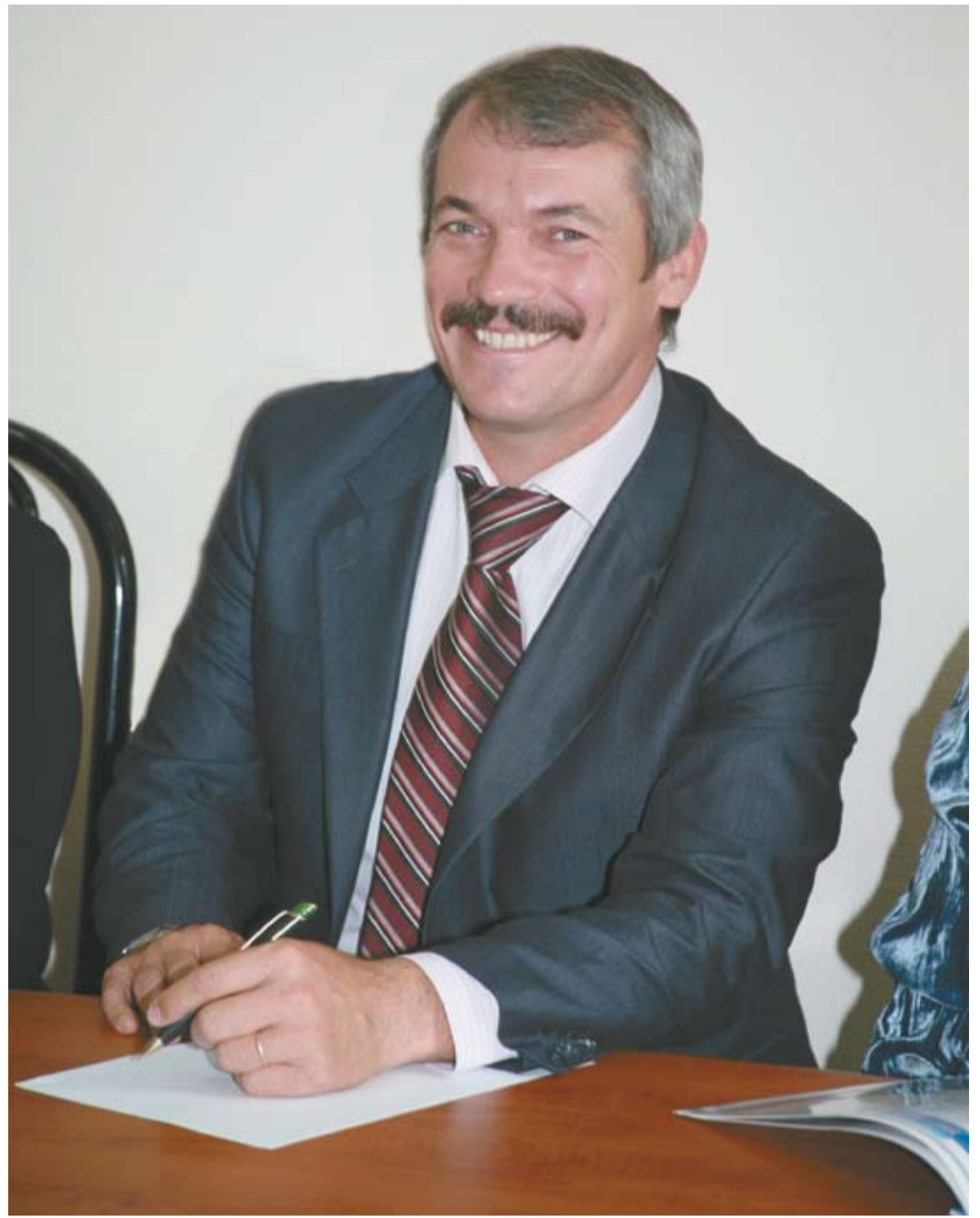
В новой ипостаси