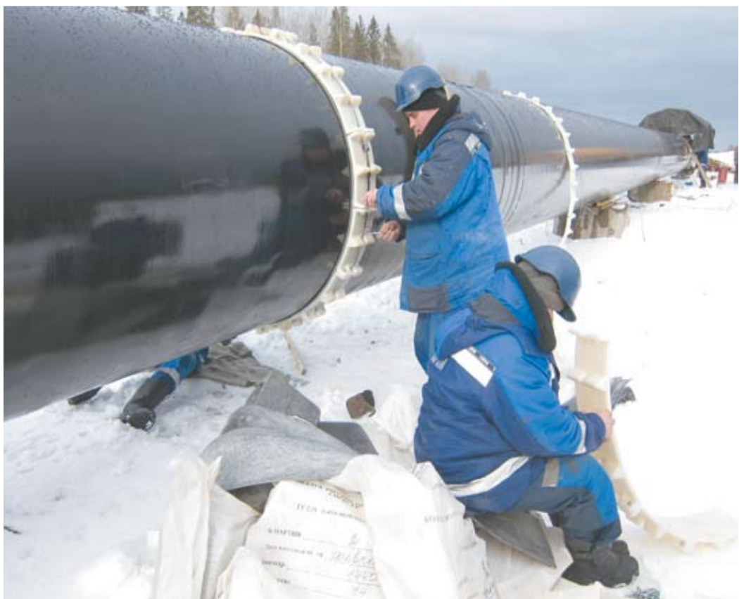
Сборка и наложение спейсеров