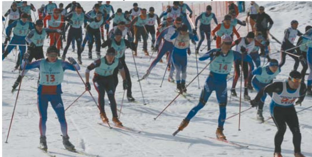
Кульминация соревнований - марафон