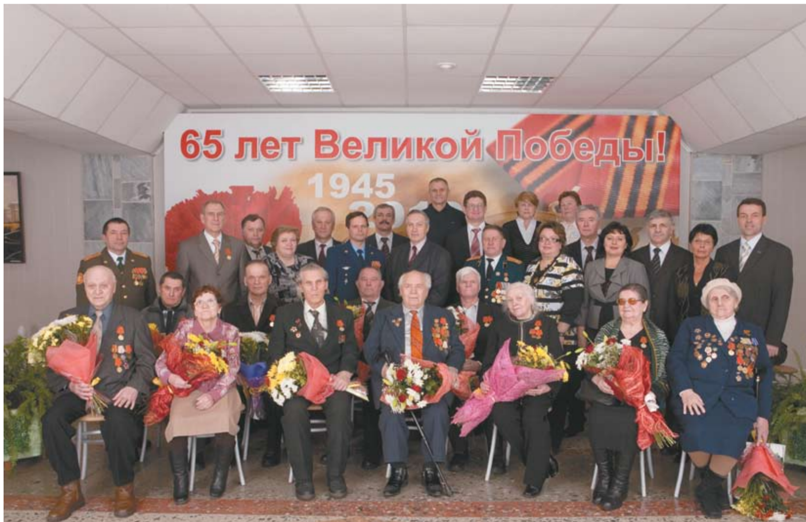
Встреча ветеранов в ЦОКе

Кроме того, обсуждались вопросы, связанные с реконструкцией дорожной инфраструктуры Коми в рамках строительства СМГ «Бованенково – Ухта», а также возможность ремонта газопровода «Войвож – Нижняя Омра», сообщает РИА Новости.