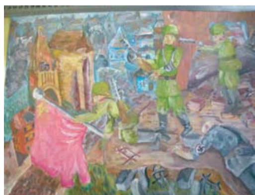
Гена Бутинов, 13 лет. «Знамя Победы»