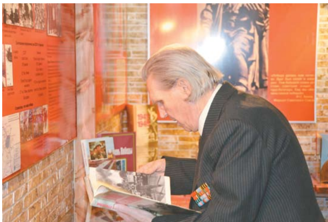
Бойцы вспоминают минувшие дни