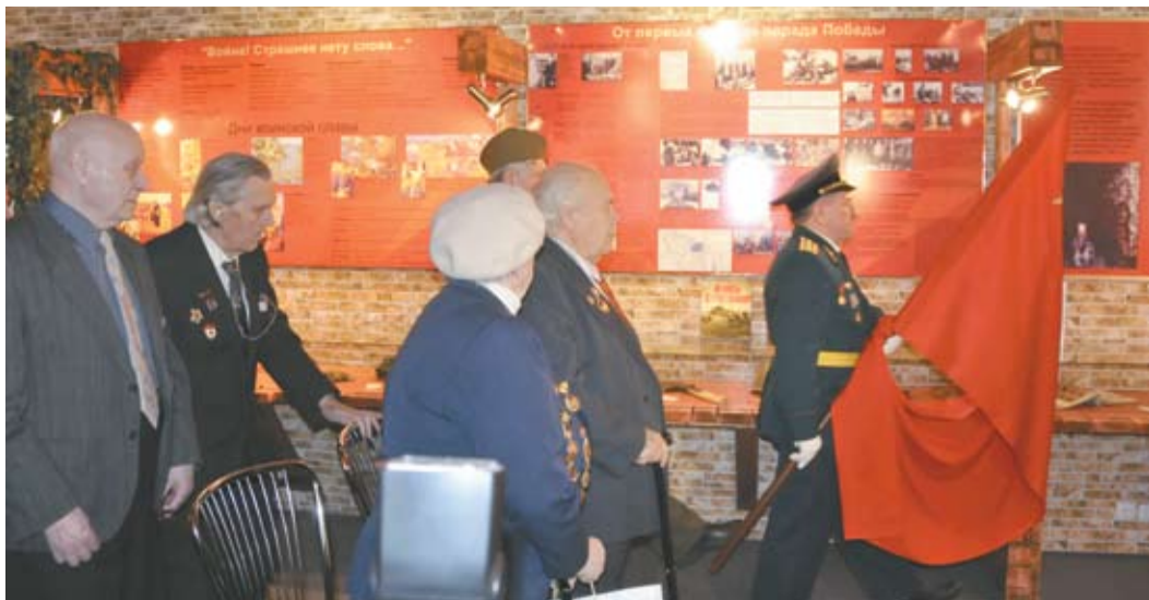
Равнение на знамя!