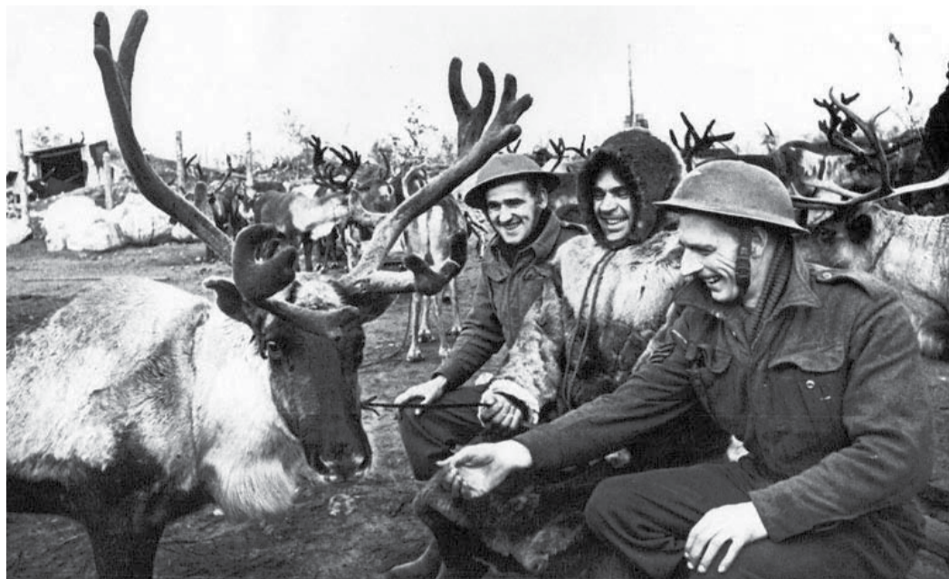
Английские летчики удивлены особым транспортом.

Если в 1942 году потребителям было отправлено 1753 тонны сажи, то в 1943 году - 3887,