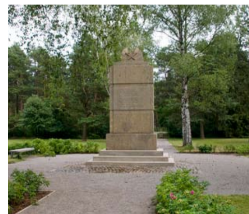
Памятник погибшим в Витцендорфе

Фактически каждый эсэсовец или охранник мог убить заключенного, не неся за это никакой ответственности. Пленных избивали кнутами, дубинками, подвешивали к «столбу» и травили свирепыми сторожевыми собаками. Нередко забивали до смерти, а в документах отмеча-