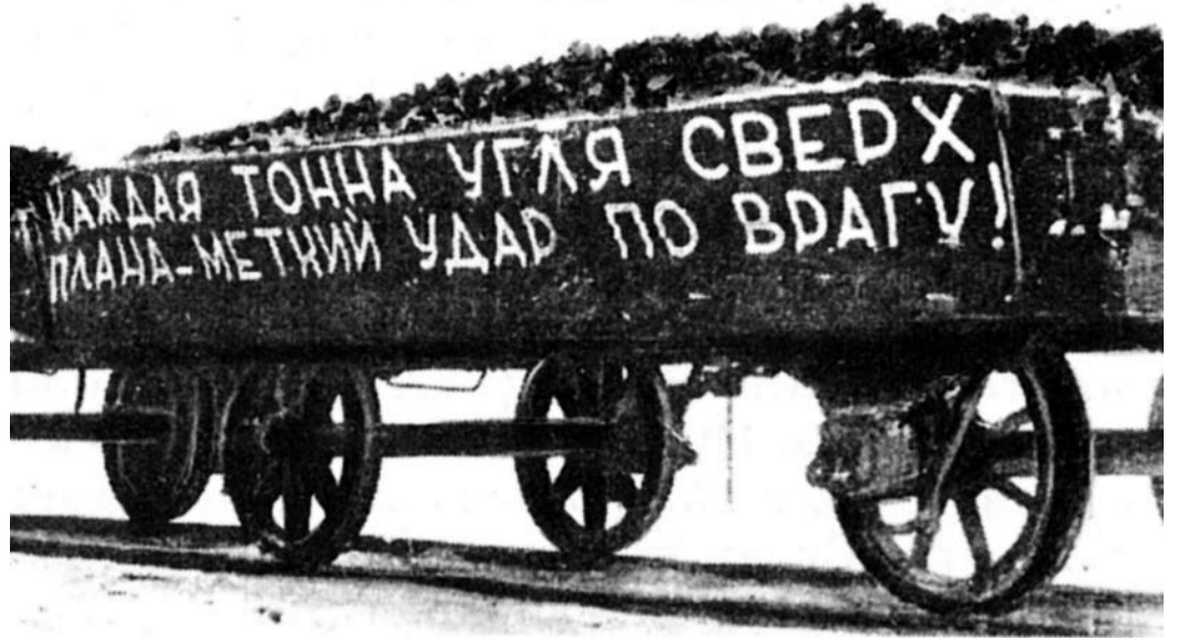
Уголь военных лет

28-я Невельская Краснознаменная стрелковая дивизия была сформирована в конце 1941 - начале 1942 гг. в Архангельской области. Большинство бойцов, командиров и политработников прибыло в дивизию из Архангельской, Вологодской, Кировской областей и Коми АССР. В итоге оказалось, что более одной трети воинов дивизии составляли коми по национальности. Медико-санитарный батальон дивизии почти полностью был укомплектован из врачей, фельдшеров и медсестер, работавших в Коми АССР.