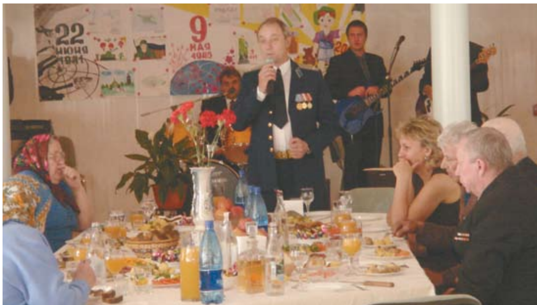
Встреча с ветеранами в Мышкинском ЛПУМГ