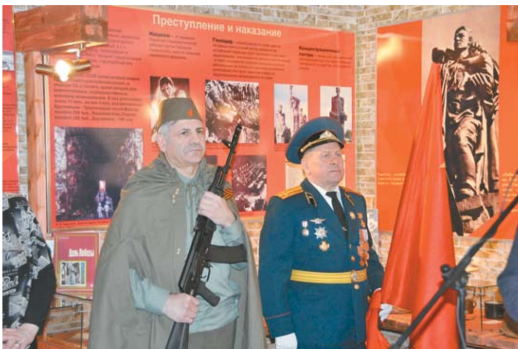
В почетном карауле