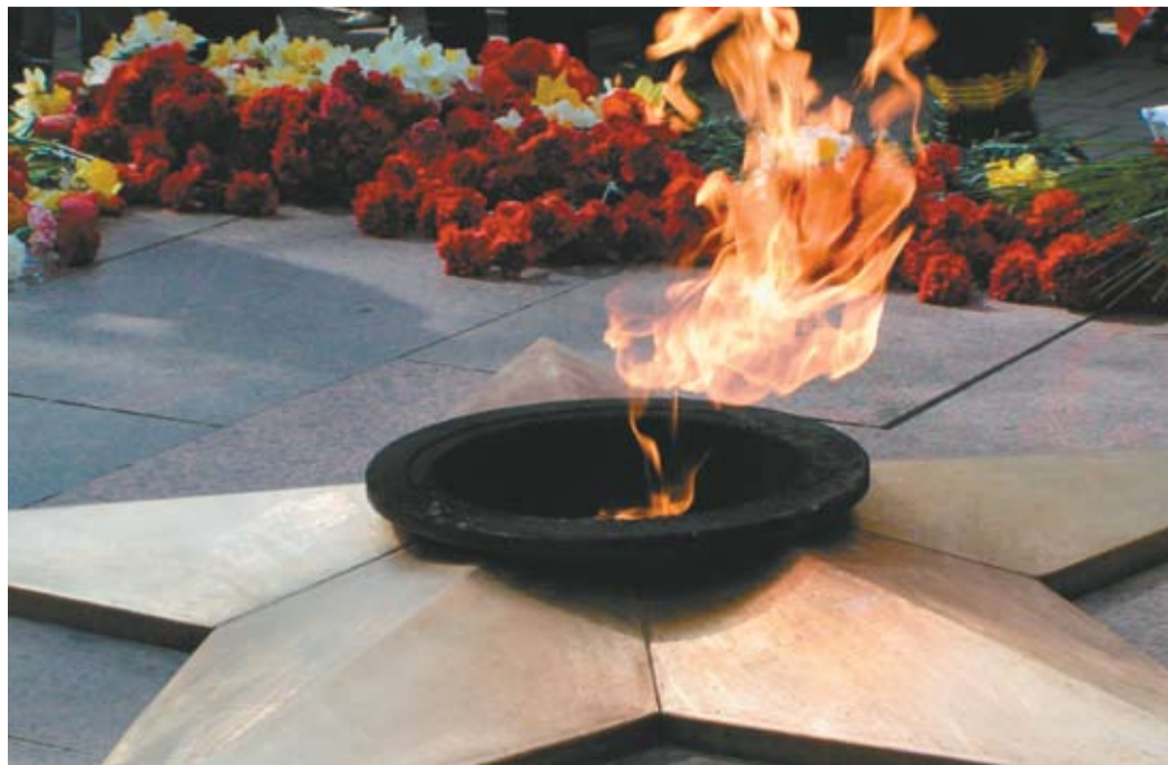
Вечный огонь Славы

Уникальная горелка Вечного огня изготовлена по проекту института Мосгазнииинститута на знаменитом ракетно-космическом предприятии Сергея Королева НПО «Энергия». Ученые даже создали специальный стенд, на котором горелка испытывалась при различных погодных «сюрпризах». Ее заливали водой, усиленно задували. В итоге удалось добиться такой надежности, что пламя выдерживало любой ветер, кроме ураганного. Расход газа составляет 6 кубометров в час, давление поддерживается обычное – как в бытовых газовых сетях. Позже была смонтирована авто-