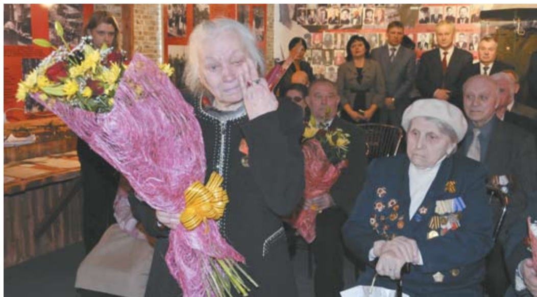
«Этот праздник со слезами на глазах...»