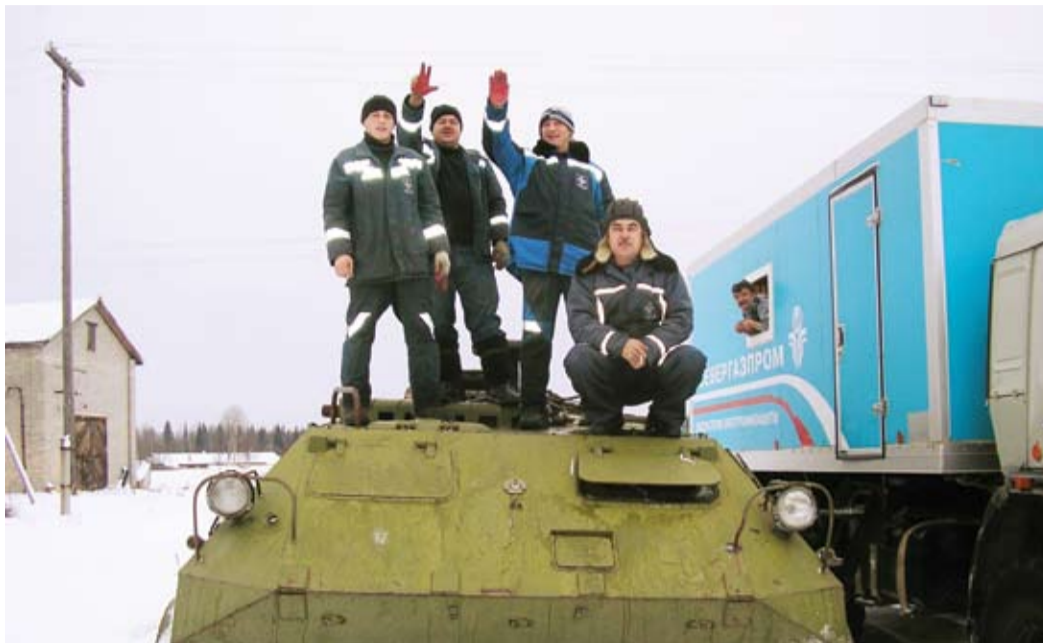
Служба ЭХЗ во время короткого перерыва.