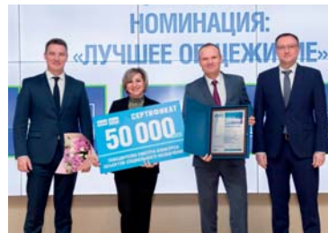
Победители смотра-конкурса объектов социального назначения в 2023 году (лучшее общежитие)