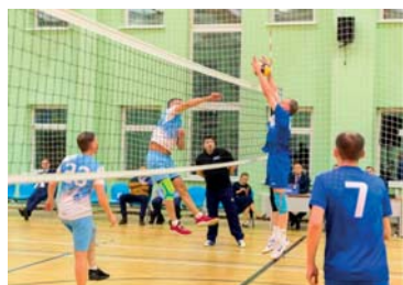
Матчевая встреча по волейболу: жаркая борьба...