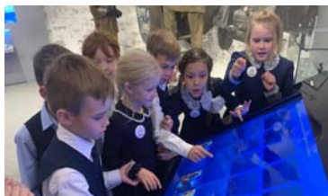
Музейные экспонаты внимательно рассматривают дети...