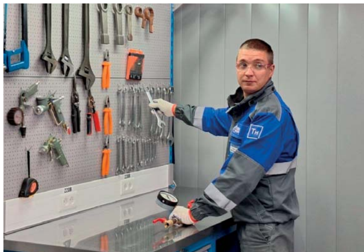
Обновлённая слесарная мастерская цеха №1, 2

В нашем филиале развёрнута масштабная программа по улучшению условий труда! Особенно радует, что подход руководства не точечный, а единый для всей компрессорной станции. После ремонта работаем в более светлых пространствах, ходим в тёмное время суток по освещённым дорожкам