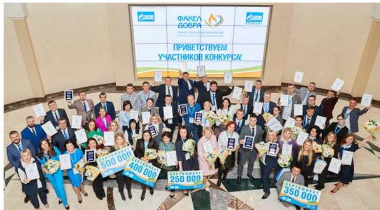
56 проектов конкурса «Факел добра» были отмечены наградами и призами

«Подводящее большинство проектов, поданных на конкурс, так или иначе связаны с детьми, а это наше будущее. Чему мы научим наших детей, с тем багажом они пойдут во взрослую жизнь», – отметил председатель