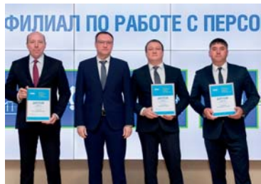
Лучшие филиалы по работе с персоналом в 2022 году (первая группа)