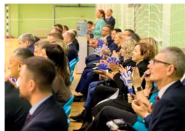
... и горячая поддержка болельщиков!