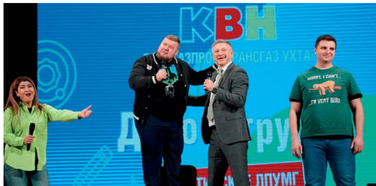
Победительница финала КВН-2023 ООО «Газпром трансгаз Ухта» – команда «Дело – труба!» (Воркутинское ЛПУМГ)

ГИД! ГИД! ГИД! – шутки о корпоративной цифровой экосистеме «порвали» зал от смеха и затмили своей популярностью даже новую операционную систему RED OS. Команды КВН предприятия «Газпром трансгаз Ухта» были щедры на юмор и остроты в финале ежегодного конкурса, который состоялся в Ухте 23 ноября.