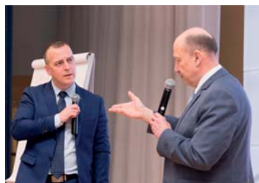
Обучающий блок по развитию личностно-деловых качеств