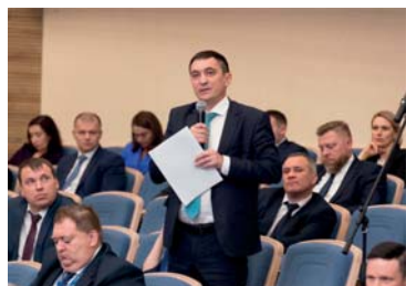
После докладов – время на вопросы из зала