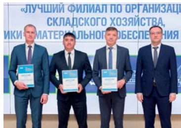
Лучшие филиалы по организации складского хозяйства, логистики и материального обеспечения