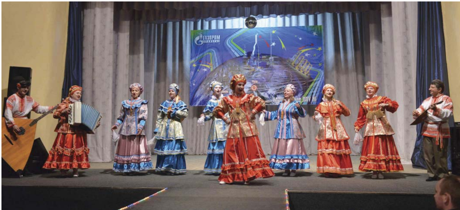
На сцене «Ухтинский сувенир»

«Фестиваль – яркий пример того, как через таланты людей могут тесно переплетаться искусство и серьезная производственная