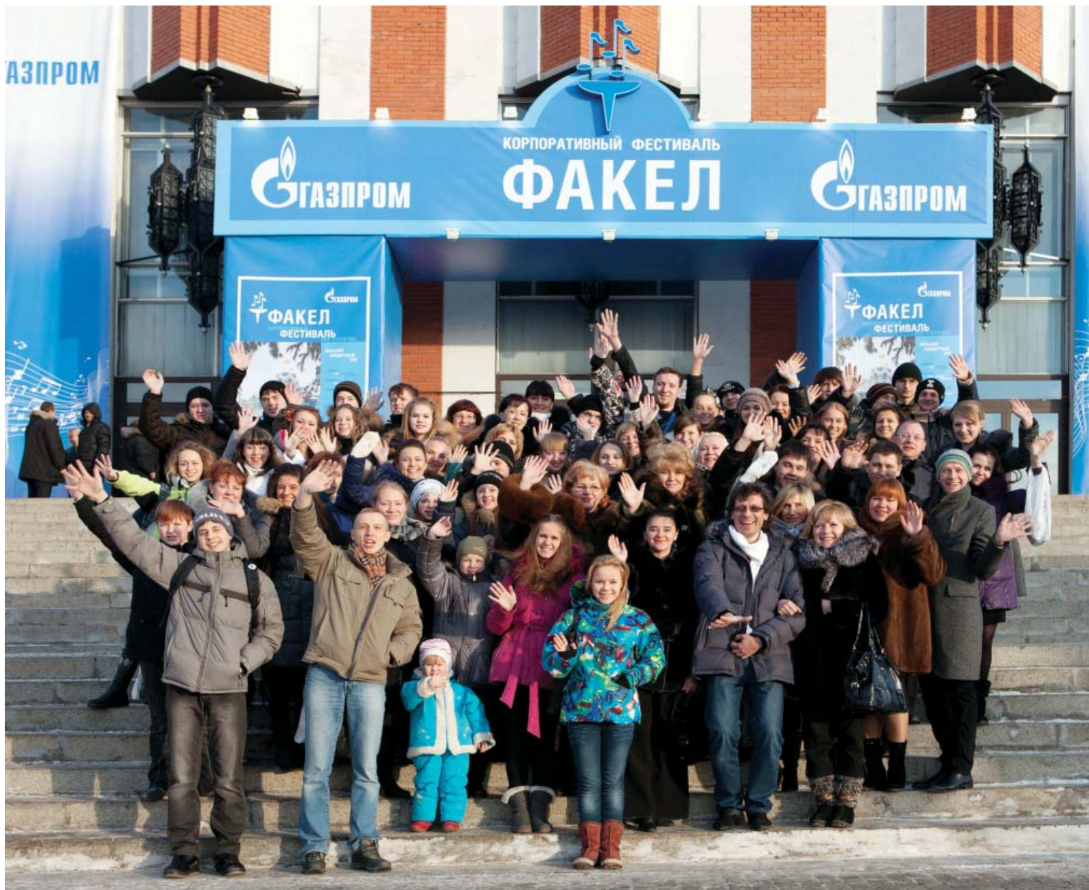
До новых встреч...