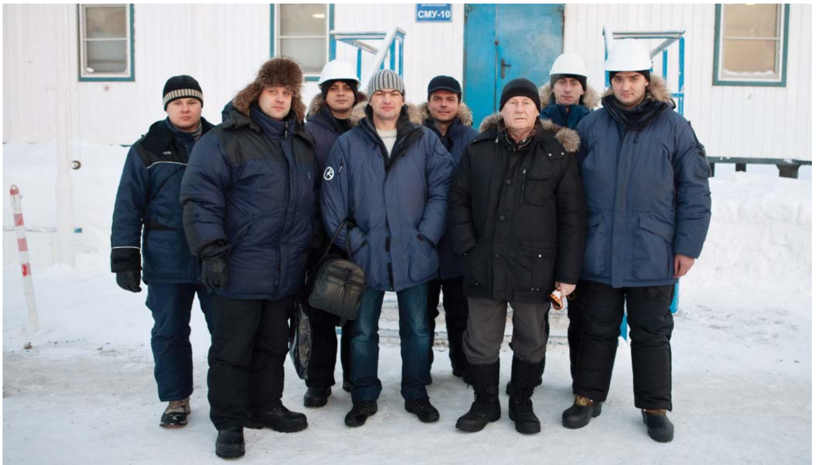
Памятная встреча, фото Е. Жданова