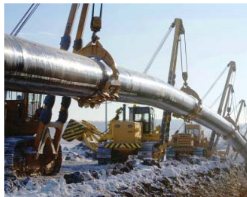
На трассе «Починки - Грязовец»

По итогам совещания профильным подразделениям, дочерним обществам и