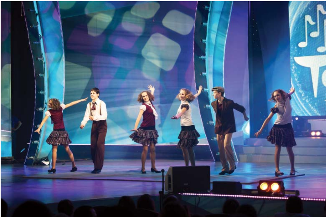
«Step by step»