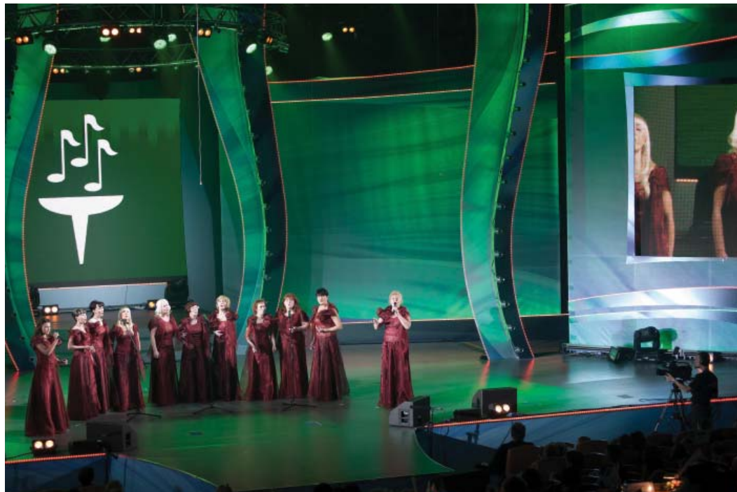
Камерный хор из Грязовца