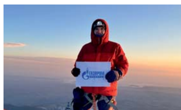
МИР УВЛЕЧЕНИЙ Моя судьба, мой Эльбрус