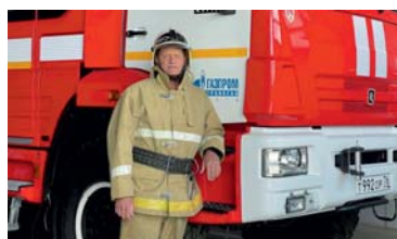
ГОСТЬ НОМЕРА Пожарный – это призвание!