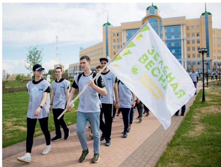
Для членов Совета молодых специалистов предприятия экологическая работа – одно из важных направлений