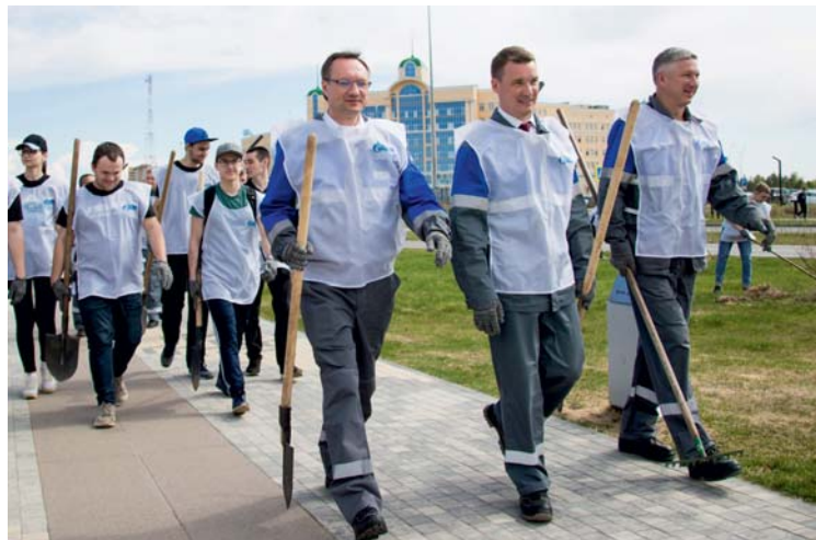
Руководители предприятия и профсоюзной организации приняли участие в экологической акции в Ухте

Сотрудники ООО «Газпром трансгаз Ухта» традиционно приняли участие во Всероссийской экологической акции «Зелёная весна-2023». Итоги субботников подвели 5 июня.