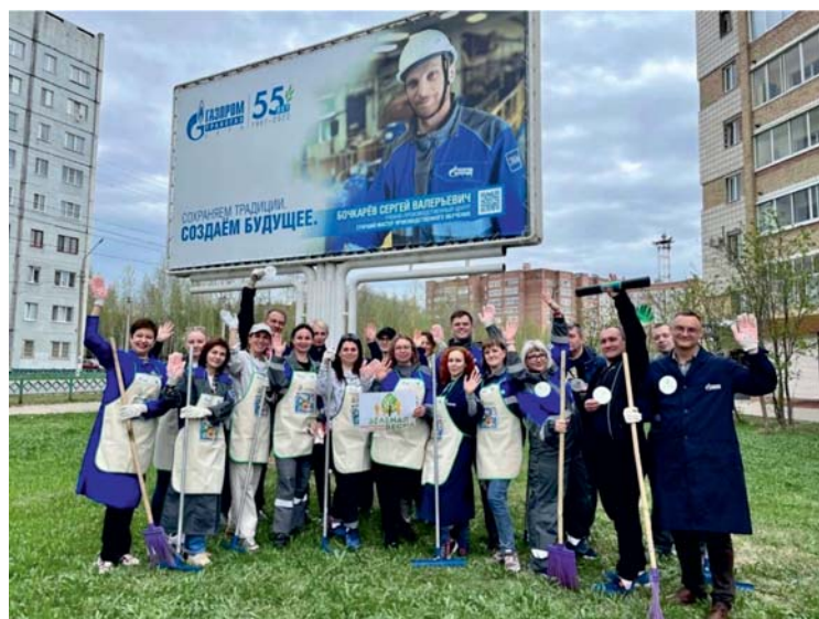
Сотрудники Учебно-производственного центра такие мероприятия считают полезными для сплочения коллектива