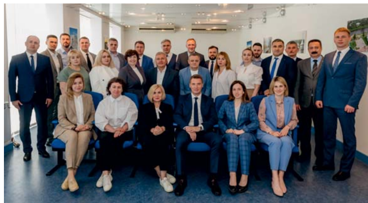
Участники семинара профсоюзных лидеров

С 29 мая по 2 июня в Вологде прошёл семинар профсоюзных лидеров, в рамках которого состоялись выездное заседание, обучающий семинар и награждение победителей в конкурсе на звание «Лучшая организация профсоюзной работы в области охраны труда в первичной профсоюзной организации филиала ООО «Газпром трансгаз Ухта».