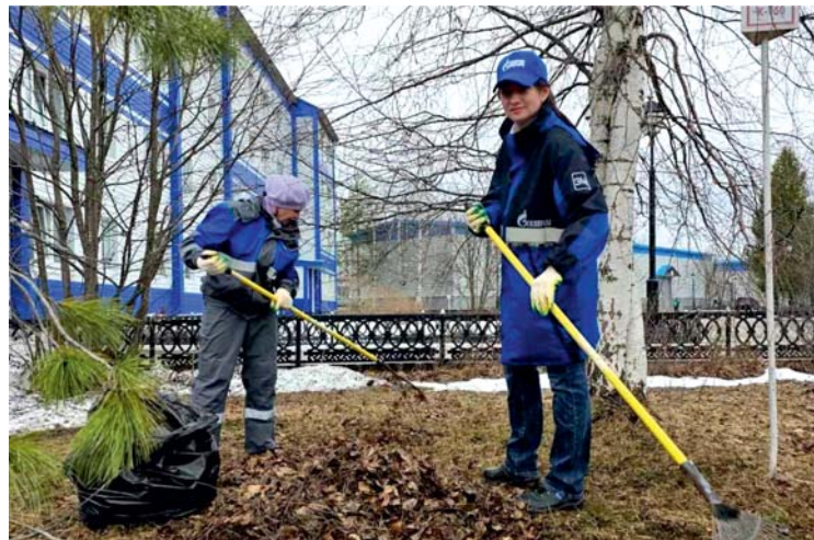
Сотрудники Управления связи успели всё: собрали мусор и завоевали 1 место в творческом конкурсе

Сотрудники Управления связи и Управления аварийно-восстановительных работ стали победителями в номинациях «Лучший видеоролик» и «В объективе – «Зелёная весна» творческого конкурса «Я – участник «Зелёной весны-2023» Неправительственного экологического фонда им. В. И. Вернадского.