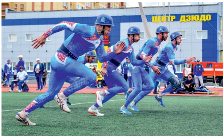
Во второй группе, в которой боролись наши сотрудники, было 23 команды

Команда нашего предприятия победила в XI соревнованиях по пожарно-спасательному спорту, проходивших с 20 по 23 июня 2023 года в Оренбурге на базе ООО «Газпром добыча Оренбург». В состязаниях приняли участие 250 спортсменов в составе 27 команд дочерних обществ ПАО «Газпром».