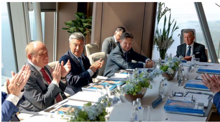
По итогам голосования годовым Общим собранием акционеров ПАО «Газпром» сформирован Совет директоров компании

Годовое Общее собрание акционеров ПАО «Газпром» состоялось 30 июня в форме заочного голосования. Собрание приняло решения по всем вопросам повестки дня.