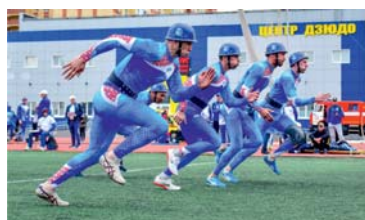
КОРОТКО О ГЛАВНОМ Решили выиграть – выиграли