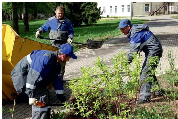
В Нюксенском ЛПУМГ работали все: люди и техника