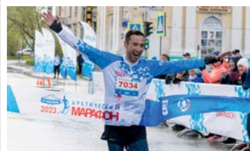
НЕ ГАЗОМ ЕДИНЫМ 5 лет арктических побед