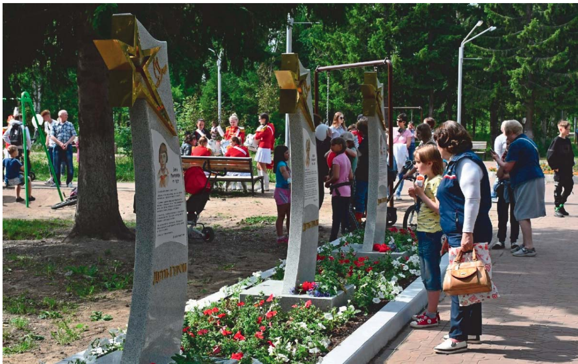
С момента открытия Аллея юных героев привлекает внимание горожан и гостей города Печоры