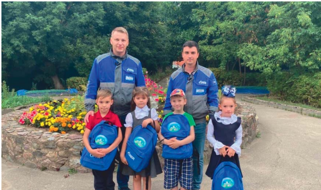
Сотрудники Переславского ЛПУМГ провели акцию «Путешествие в мир знаний»: 12 детей получили наборы первоклассника

Нередко случается так, что просто оказать поддержку — мало, надо сделать это как можно быстрее. Сотрудники Переслав-