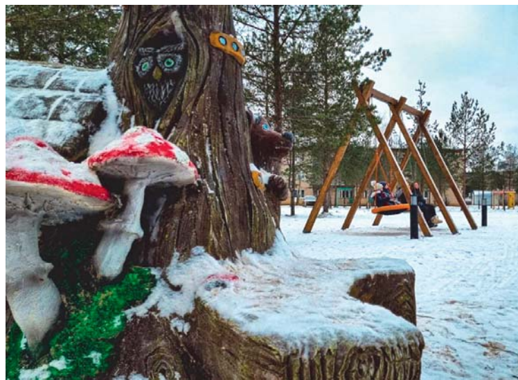
Дети по достоинству оценили «Сказочную аллею» посёлка Юбилейный

Много слов благодарности, в том числе и от местных ветеранов, услышали представители Юбилейного ЛПУМГ и за обустройство деревянной пешеходной дорожки до близлежащих деревень Топорихи и Светицы. У многих жителей посёлка в этих местах находятся дачи, и теперь дорога туда не зависит от капризов погоды. Установлены на тропе и две скамейки, что особенно актуально для людей старшего поколения. Этим летом впервые появилась в Юбилейном и цивилизованный пляж – на расчищенном берегу речушки Тиксны установили лежаки и раздевалки.