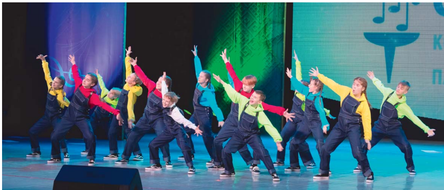
Танцевальный коллектив «United Bit» (Республика Коми)