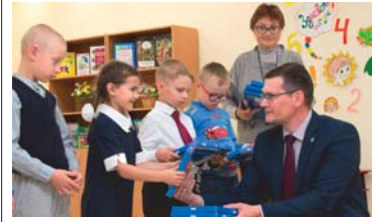
НЕ ГАЗОМ ЕДИНЫМ «Факел» добрых инициатив