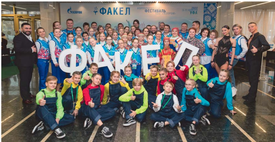
Делегация ООО «Газпром трансгаз Ухта»