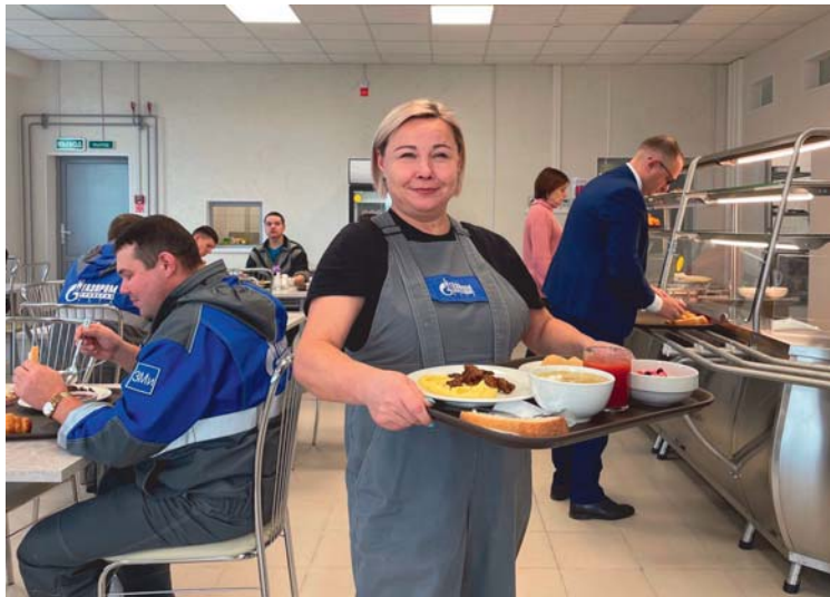
Новая столовая рассчитана на 50 посадочных мест

«Основа здоровья – это полноценное сбалансированное питание. От него зависит трудоспособность, сила и хорошее настроение сотрудников предприятия. Как говорится, хороший работник – сытый работник! Увеличилось время для приёма пищи, потому что раньше часть обеденного перерыва тратилась на