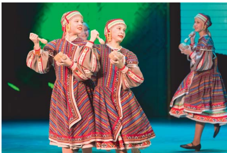
Образцовый детский ансамбль танца «Ёлочка» (Республика Коми)