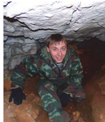
В сердце грота