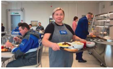
СОЦИАЛЬНАЯ ОТВЕТСТВЕННОСТЬ Новосиндорская столовая