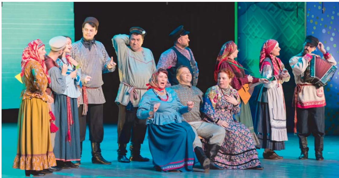
Фольклорный ансамбль «Карусель» (Ярославская область)

Фольклорный ансамбль «Карусель» был удостоен специального приза жюри фестиваля.