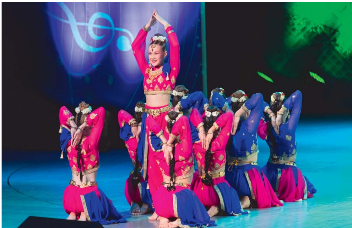
Ансамбль индийского танца «Лакими» (Архангельская область)