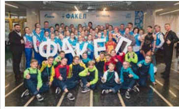
ФОТОРЕПОРТАЖ Мы – единая страна