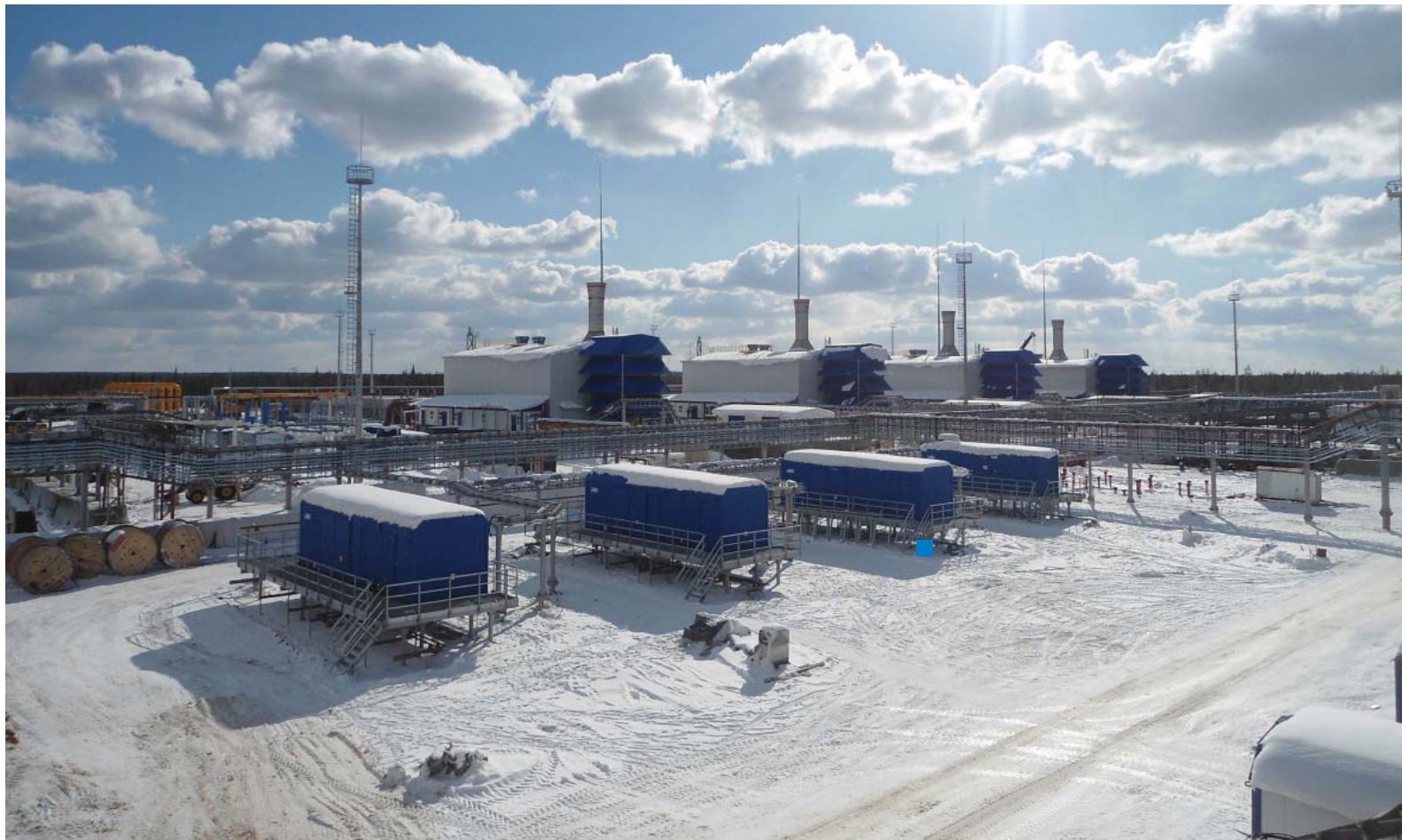
Общий вид ГПА КС-9 Малоперанская