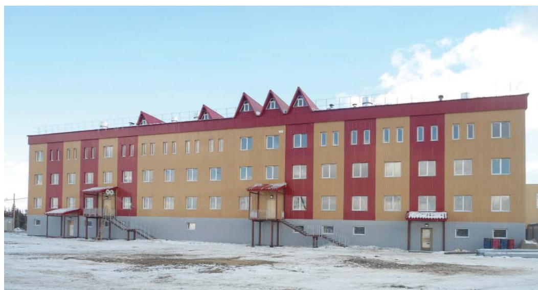
Общежитие ВЖК КС-9 Малоперанская