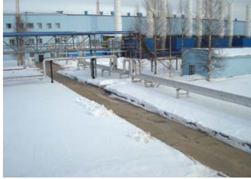
Плиты с подогревом

2013 год объявлен в Газпроме «Годом экологии». Это не просто важный приоритет производственной политики крупной компании. Это условие ее эффективности. Основываясь на «Экологической политике» ООО «Газпром трансгаз Ухта», экологи Нюксенского ЛПУМГ работают над оптимизацией технологических процессов и внедрением технологий с наименьшим потреблением энергоресурсов.