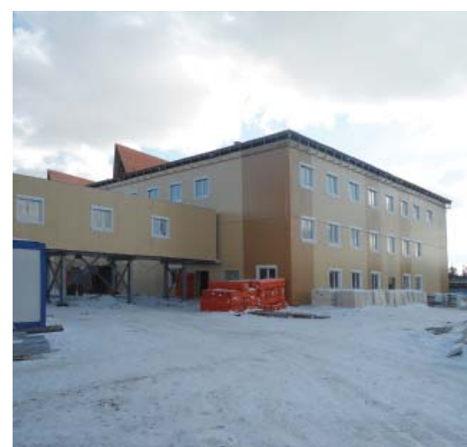
Общественный центр КС-9 Малоперанская