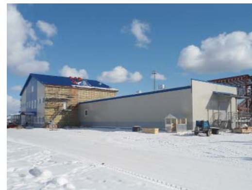
ПЭБ КС-9 Малоперанская

В Сосногорском ЛПУМГ полным ходом идет строительство двух новых цехов. График работ — напряженный. По плану, новые объекты должны вступить в строй к концу 2013 года.