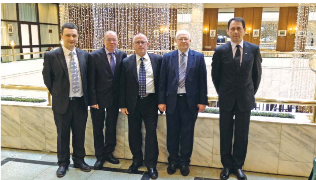
Лауреаты премии имени Н.К. Байбакова

21 марта в Президент-отеле Москвы прошел XXII съезд-форум Международной топливно-энергетической ассоциации (МТЭА), в ходе которого состоялось вручение престижной премии имени Н.К. Байбакова.