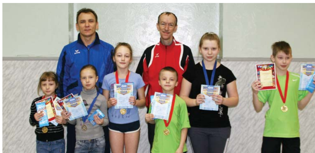
Призеры детской спартакиады