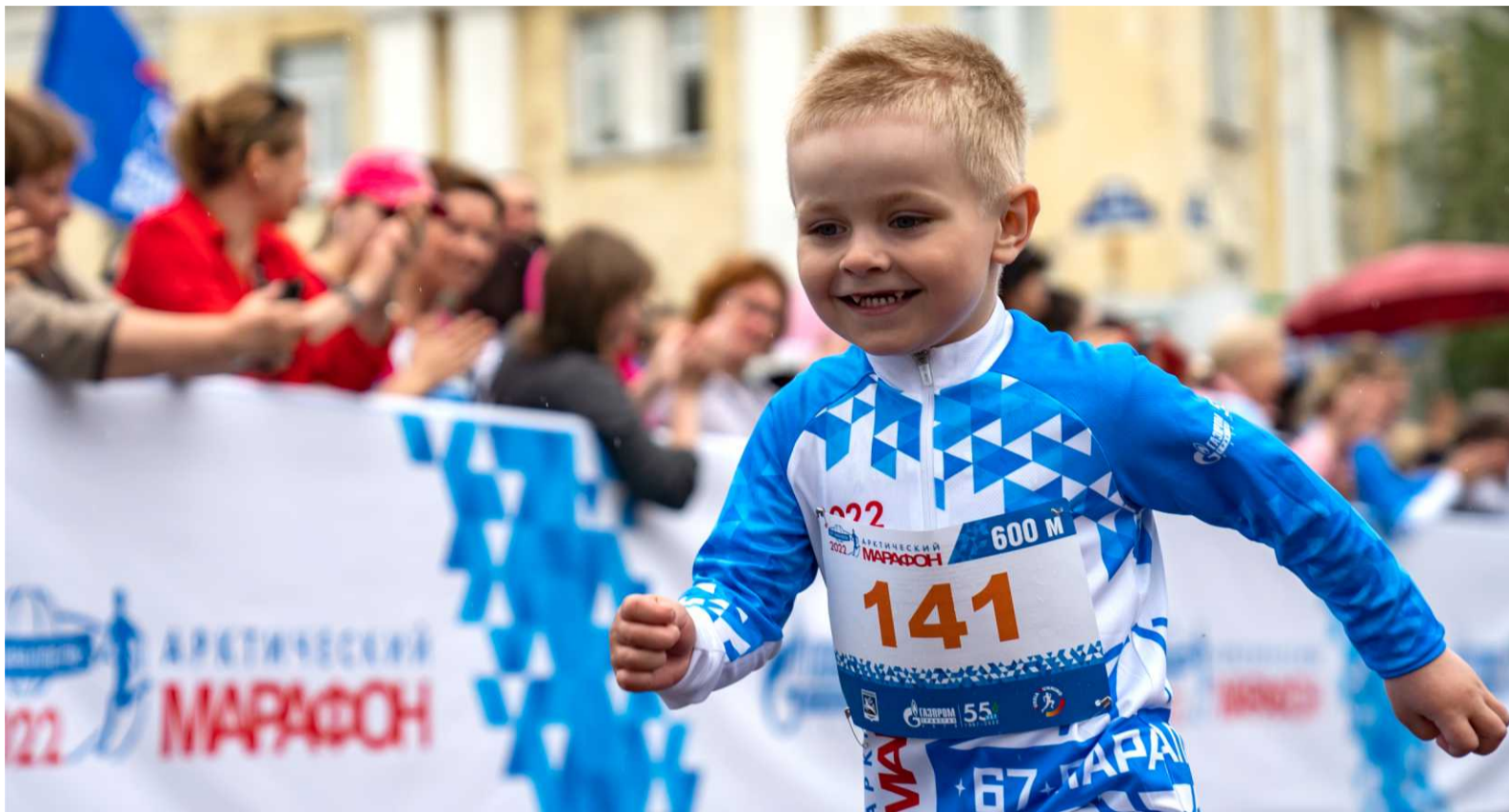
Первыми на старте – дети

Самая популярная дистанция – 3 км. Здесь много тех, кто не гонится за спортивным результатом, но в числе ярых сторонников здорового образа жизни. Маршрут прошёл мимо самого узнаваемого символа заполярного города – памятного знака «Воркута – 67 параллель». Часть марафонской дистанции – в окружении бескрайней тундры, с видом на Приполярный Урал.