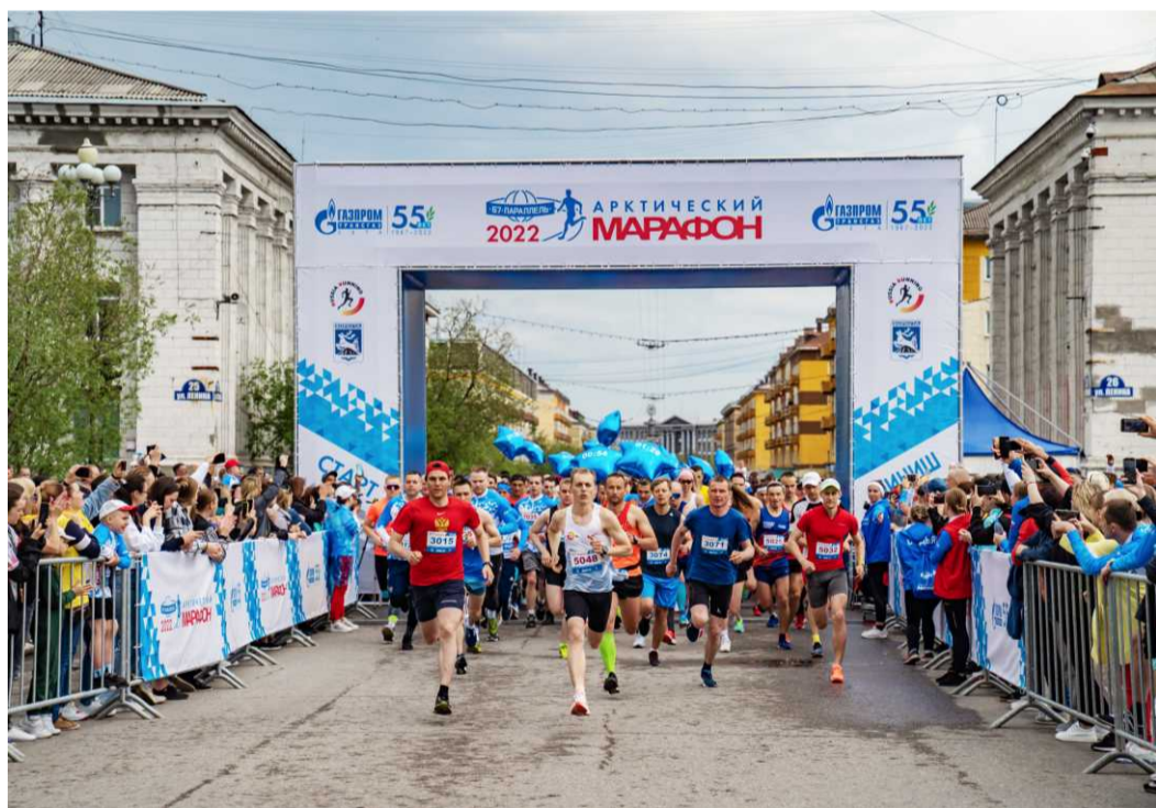
Массовые забеги прошли на пяти дистанциях. Поддержка зрителей и памятные медали – всем участникам

А. Бадич, видео Д. Плонина