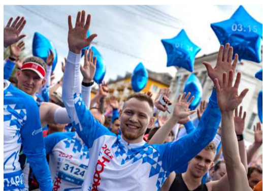
Перед каждым стартом – весёлые разминки