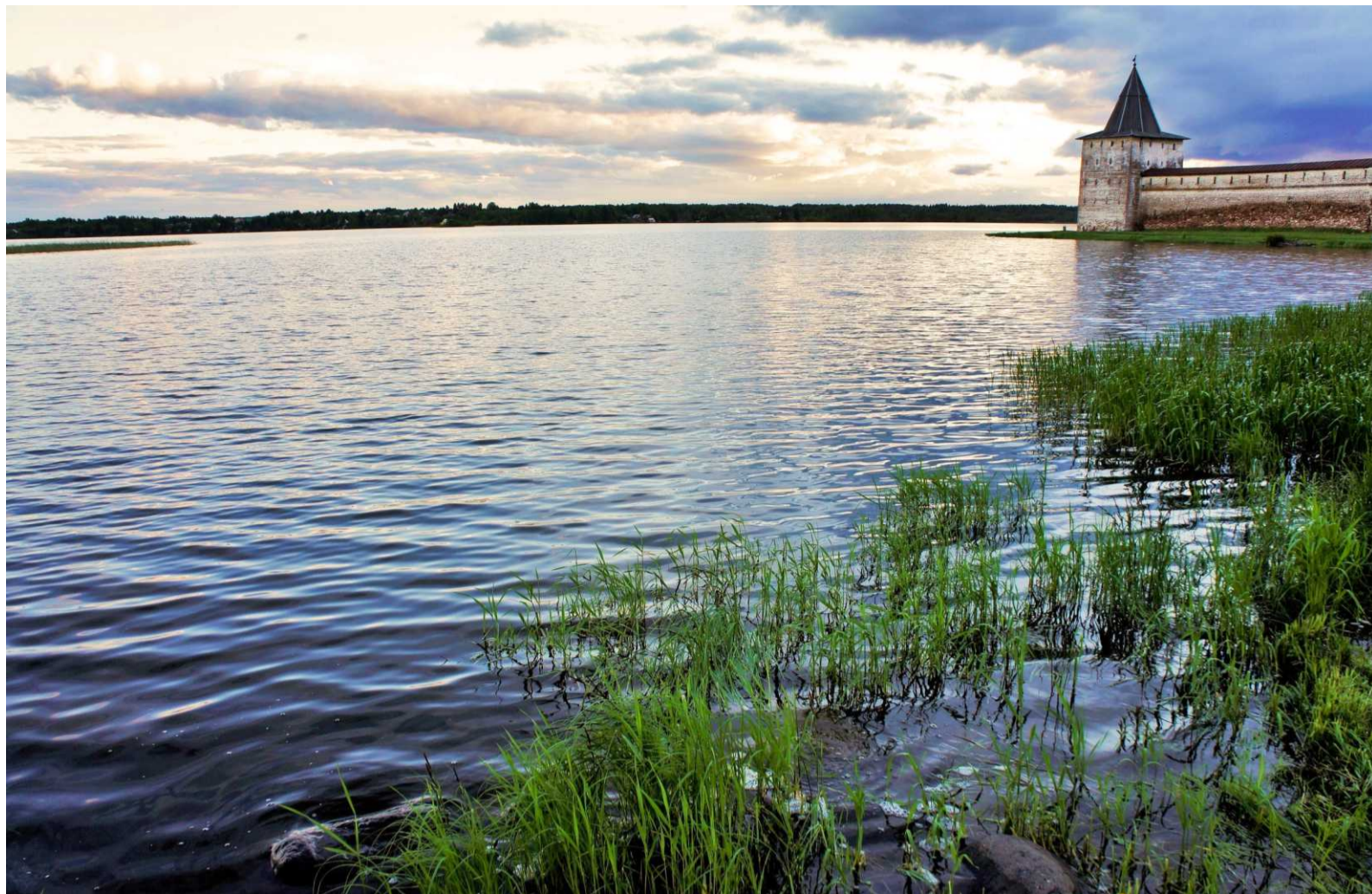
Кирилло-Белозерский монастырь на берегах священного Сиверского озера

Самая высокая точка – Цыпина (Ципина) гора. В расцвет живописи в России все дома неподалеку были выкуплены художниками, чьи полотна навсегда запечатлели удивительные пейзажи здешней природы. Гора Сандырева является памятником областного значения. На её территории запрещены