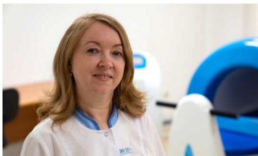
ГОСТЬ НОМЕРА В «Жемчужину» влюбилась навсегда