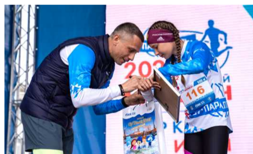
Автограф от олимпийского чемпиона