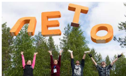
МОЛОДОСТЬ В АКТИВЕ «ЛЕТО» переФОРУМтировали