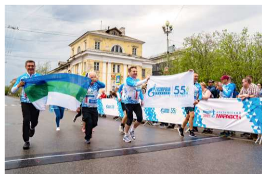
«Арктический марафон» приурочен к 55-летию ООО «Газпром трансгаз Ухта»