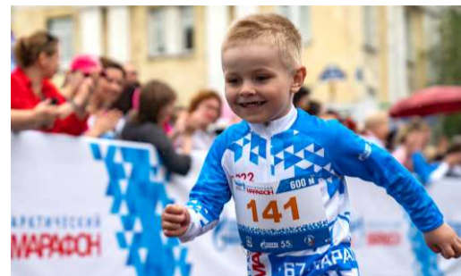
ФОТОРЕПОРТАЖ Возвращение за полярный круг