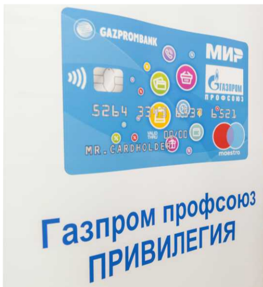
У программы лояльности 60 региональных партнёров

Итоги проделанной работы были подведены в начале июня в Москве на семинаре для ответственных за реализацию Программы «Газпром профсоюз ПРИВИЛЕГИЯ». В нём приняли участие представители 40 профсоюзных организаций компании Газпром. Благодарностями Председателя «Газпром профсоюза»