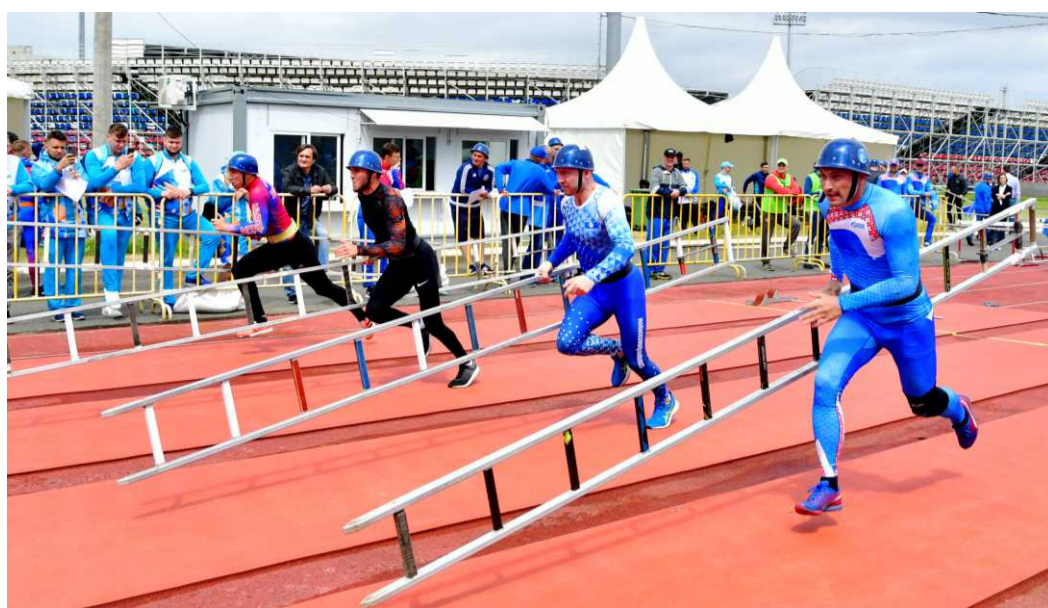
30 метров до учебной башни

Ежегодные соревнования по пожарно-спасательному спорту – это отличная возможность повысить уровень физической подготовки, профессионального и спортивного мастерства участников, сплотить команду и перенять опыт участия в подобного рода