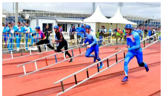
ЛУЧШИЕ ИЗ ЛУЧШИХ Поднялись по лестнице успеха