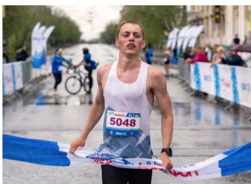
Победитель на дистанции 21,1 км