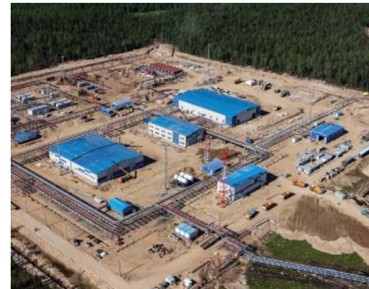
Сосногорское ЛПУ, КС-49 Малоперанская, промбаза