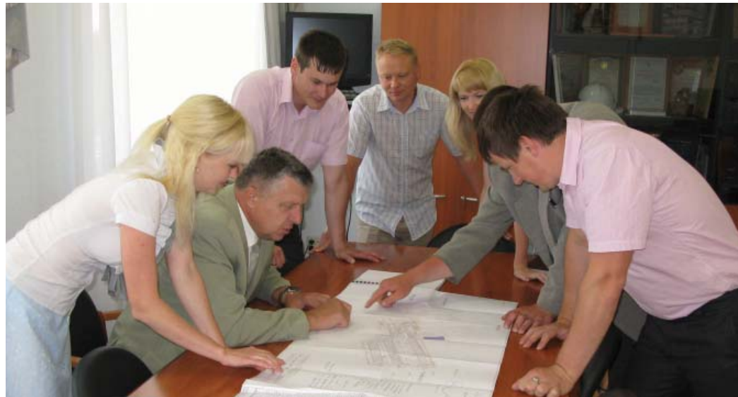
Молодые специалисты вместе с начальником ЛПУМГ обсуждают планировку парка отдыха в Юбилейном

получившие профессиональное образование, могли благополучно адаптироваться, нашли приложение своим силам. За послед-