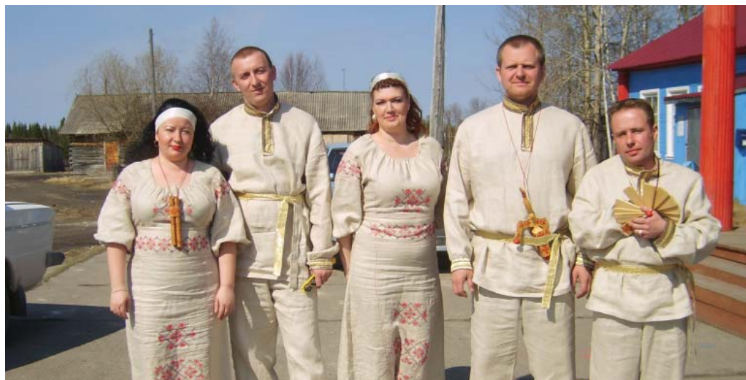
«Левый берег» – фольклорный коллектив Печорского ЛПУМГ