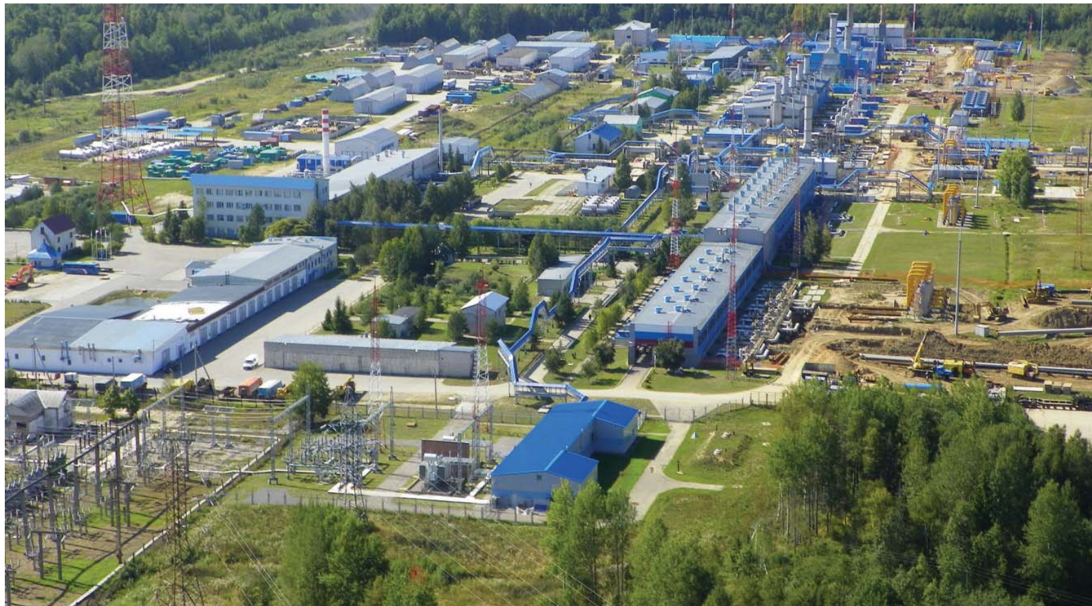
Грязовецкое ЛПУ сегодня