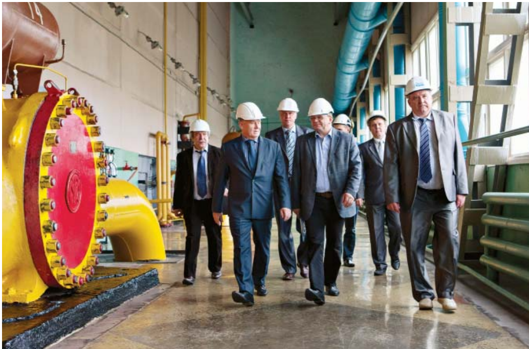
На КС-10. В центре - министр развития промышленности, транспорта и связи РК А.Н. Самоделкин

А.А. Захаров отметил, что такие соглашения на протяжении ряда лет, начиная с 2009, действуют между ООО «Газпром трансгаз Ухта» и правительством РК. Средства расходуются, в основном, на модернизацию, реконструкцию, капитальный ремонт медицинских учреждений, развитие спортивной базы регионов, строительство новых спор-