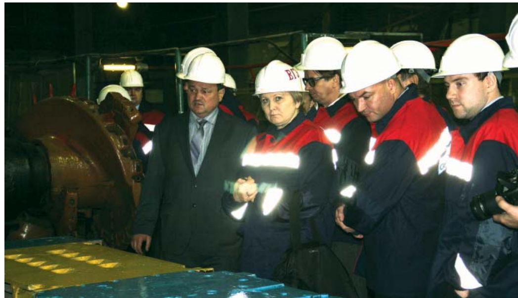
Газовики в гостях у шахтеров