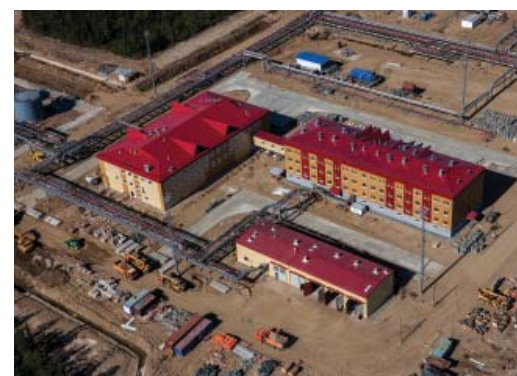
Сосногорское ЛПУ, КС-49 Малоперанская, ВЖК