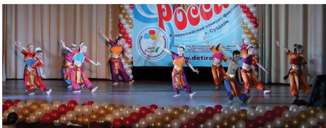
Детский коллектив «Лакшми»