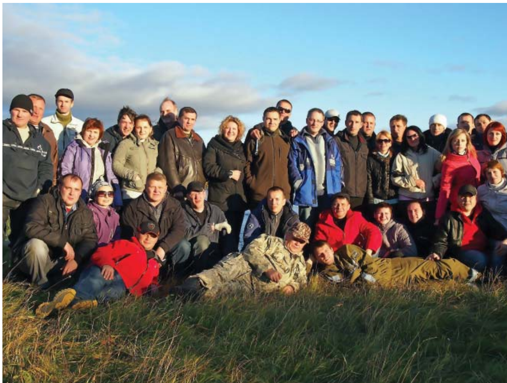
В День газовика, 2012 год

Нам действительно есть чем гордиться: есть реальная интересная работа, есть сплоченная команда профессионалов - удачное сочетание опытных специалистов с молодыми креативными ребятами. Впрочем, ветеранами тех, кто работает у нас «с первого колышка», назвать сложно - средний возраст сотрудников не превышает 40 лет.