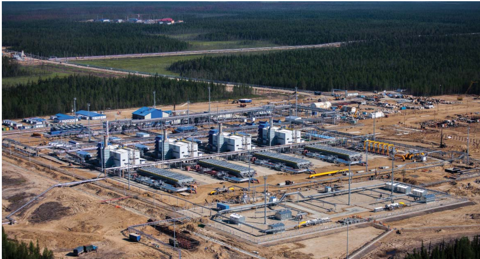
КС-Малоперанская, КЦ №1