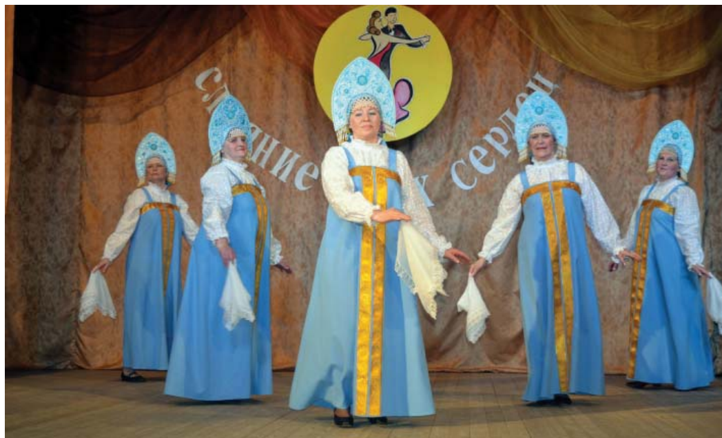
Выступают участницы танцевального коллектива «Приводушка»