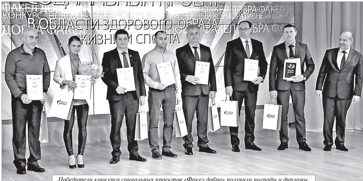
Победители конкурса социальных проектов «Факел добра» получили награды и дипломы.

В ООО «Газпром трансгаз Ухта» подвели итоги конкурса социальных проектов